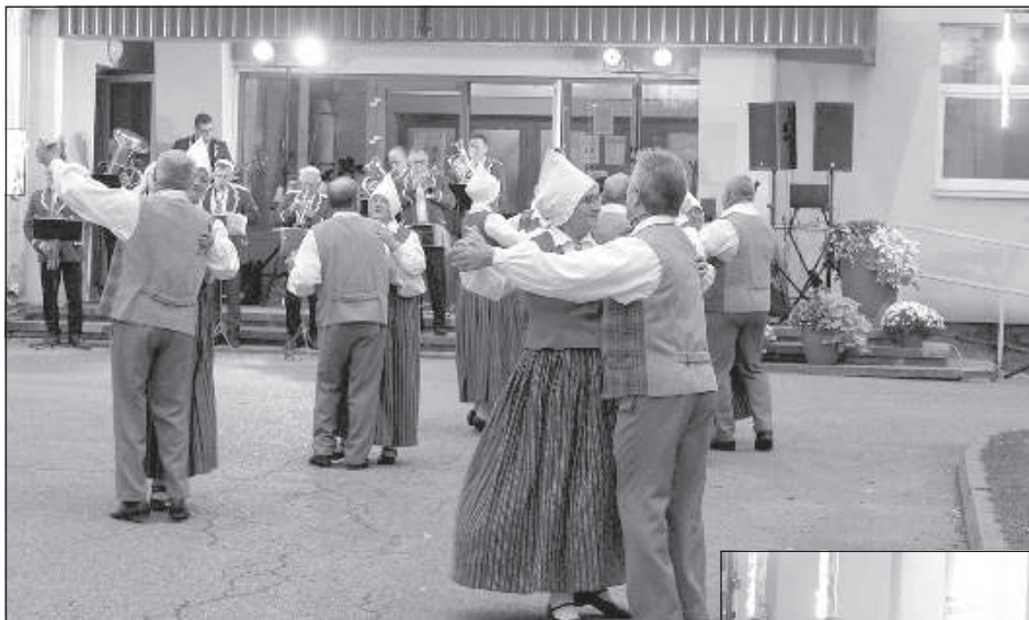
Танцевальный коллектив сениоров «Ozolziļes».