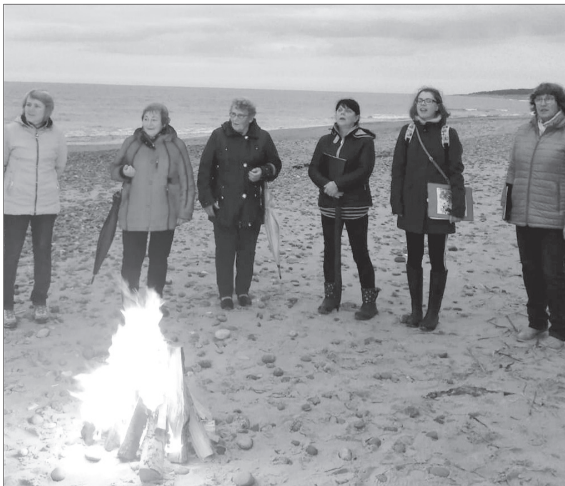
Vokālā ansambļa "Saiva" dziedātājas pie Užavas ietekas jūrā.