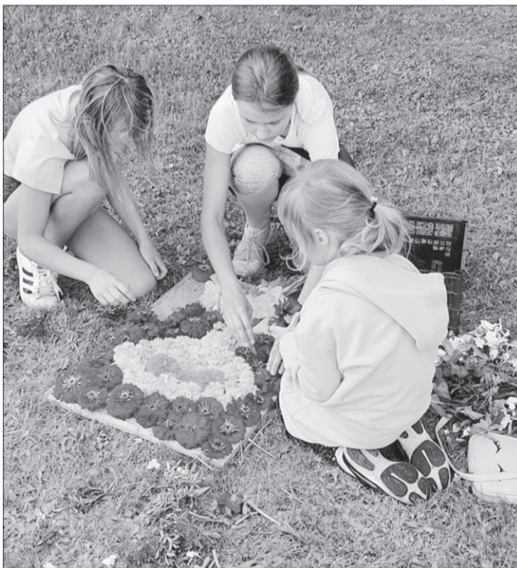
Pagasta svētkos tapa septiņi dažādi paklāji. Paldies to veidotājiem!