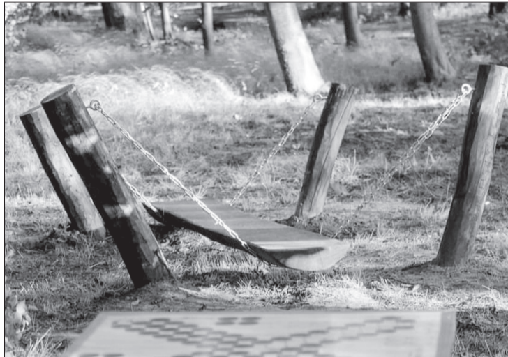
Bērniem patiks līdzsvara laipa un ričuračs.