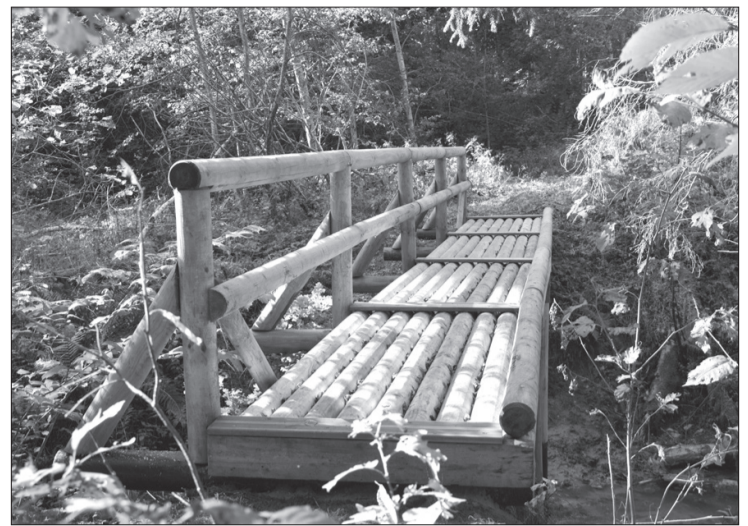
AS "Latvijas Valsts meži" Tak-U-gālē uzstādījusi tiltiņu, lai var ērti šķērsot grūti izbrienamu vietu.

Tā radās Tak-U-gāle. Jau semināra laikā Tak-U-gāles grupa kopā ar citiem idejas atbalstītājiem izstaigāja ceļu no dzelzceļa, ūdenstorna līdz pilskalnam un pārliecinājās, cik aizaugusi un grūti caurejama ir šī kādreiz tik iecienītā pastaigu taka. Ir notikušas vairākas ekspedīcijas, lai izvēlētos takas veiksmīgāko maršrutu, iezīmētu to dabā un saplānotu darāmos darbus. Saskaņojot darāmo ar "Latvijas Valsts mežiem", ir no-