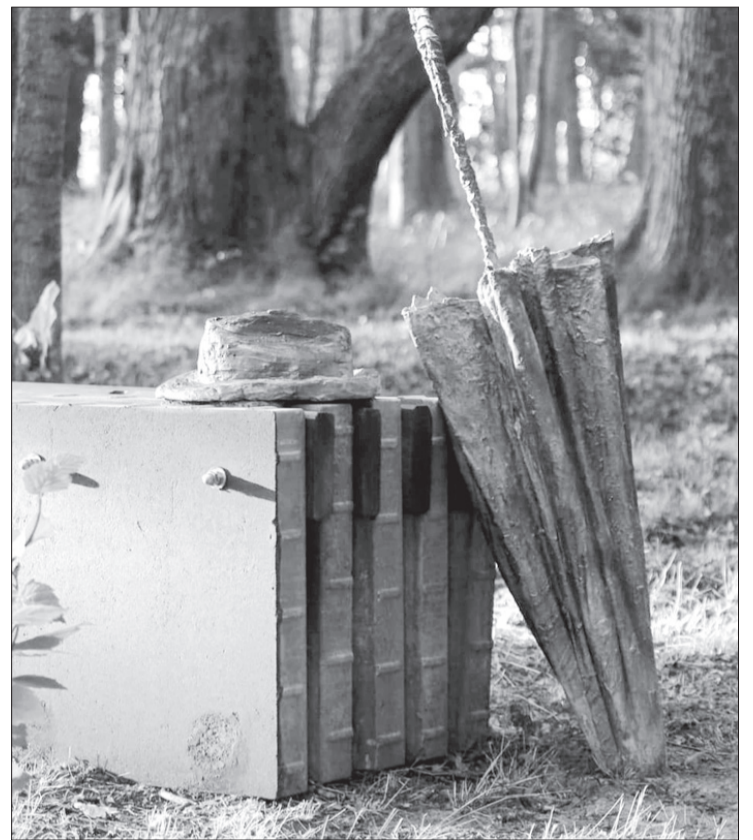
Ziru parkā parādījies lietussargs.