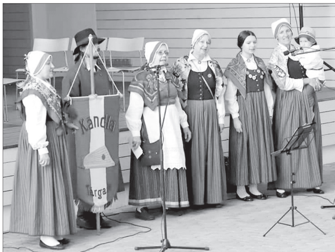
Tārgales pagasta līvu folkloras kopas "Kāndla" dziedātāji gavilēja muzeja pagalmā.