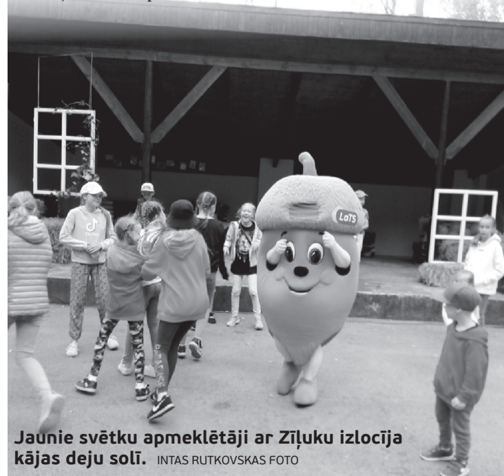
Jaunie svētku apmeklētāji ar Ziļuku izlocīja kājas deju soli.