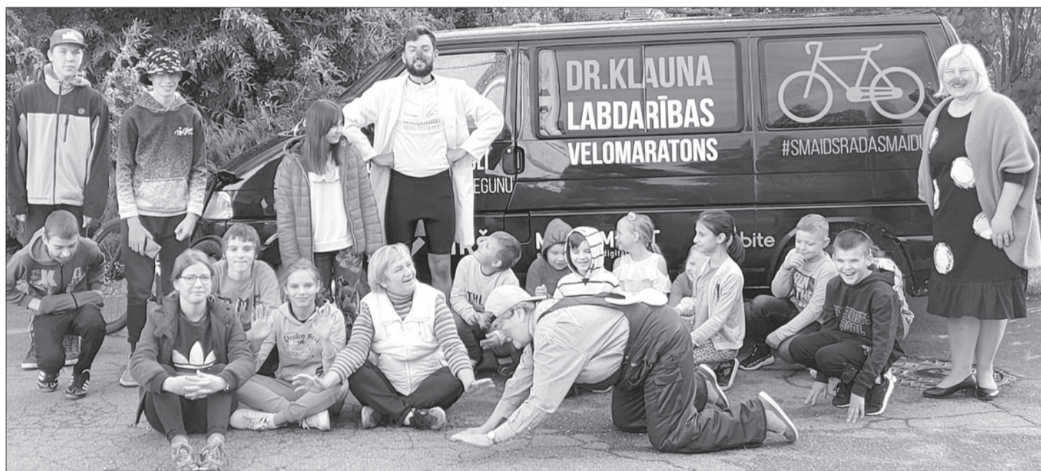
Ances bērni un pieaugušie priecājas, daktera klauna iedvesmoti.

Katra pagasta kultūras dzīves lepnums ir amatierkolektīvi. Mūsu pagasts var lepoties gan ar dejotājiem, gan aktieriem. Tā amatiereteātris “Nezāles” jau pieminēto R. Blaumaņa lugu izrādīja Puzes pagasta svētkos 21. augustā, bet 28. augustā vidējās paaudzes deju kolektīvs “Ance” kopā ar senio-