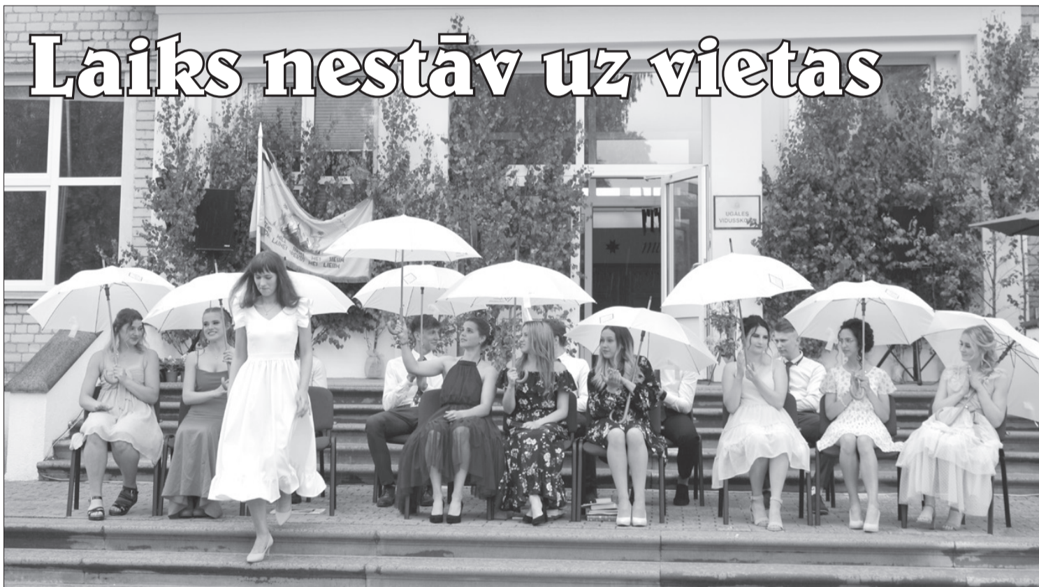
Divpadsmitie, kuri savu izlaidumu svinēja šovasar, nu jau ir studenti.

Smaidī, vārdi, dziesmas, ziedi un tas mazumiņš klātesošo, ko pieļauj šī gada kovida laika ierobežojumi. Brīdis, kurā klāt ir arī skumjas, satraukums par notiekošo un mazāka vai lielāka neziņa par rītdienu. Nepilnas divas stundas, un