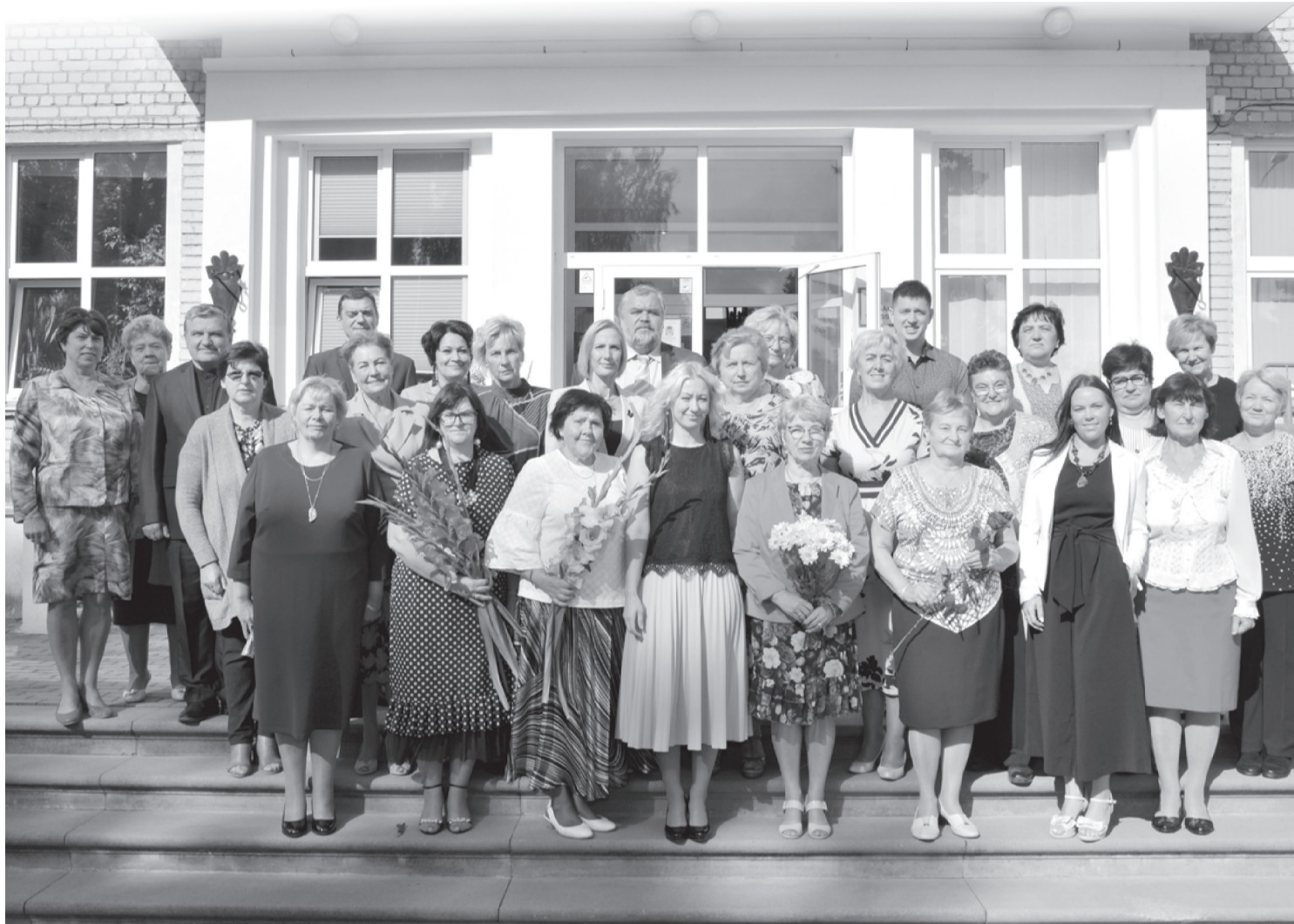
Uģales vidusskolas pedagogu saime. Lai veiksmīgs mācību gads!

Jāzeps Osmanis ir teicis: "Atkal skola pulcē kopā mūs./ Un tās balss ir silta, aicinoša." Šajā mācību gadā gribas dzejnieka vārdus pārveidot, "atkal" vietā liekot "beidzot", jo ir sācies jauns darba cēliens – jaunu zināšanu, izaicinājumu un iespēju laiks, kas vienmēr iet roku rokā ar nopietnu mācību darbu.