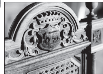
Restaurētā krēslu augšdaļa ar dekoratīvo kokgriezumu, kuru rotā fon Bēru dzimtas ģerbonis.