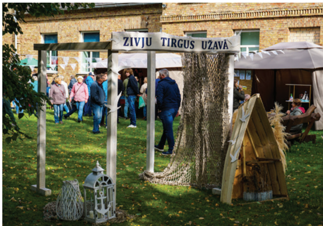
Pasākumā bija padomāts par gaumīgu noformējumu.

Atbalsta Zemkopības ministrija un Lauku atbalsta dienests