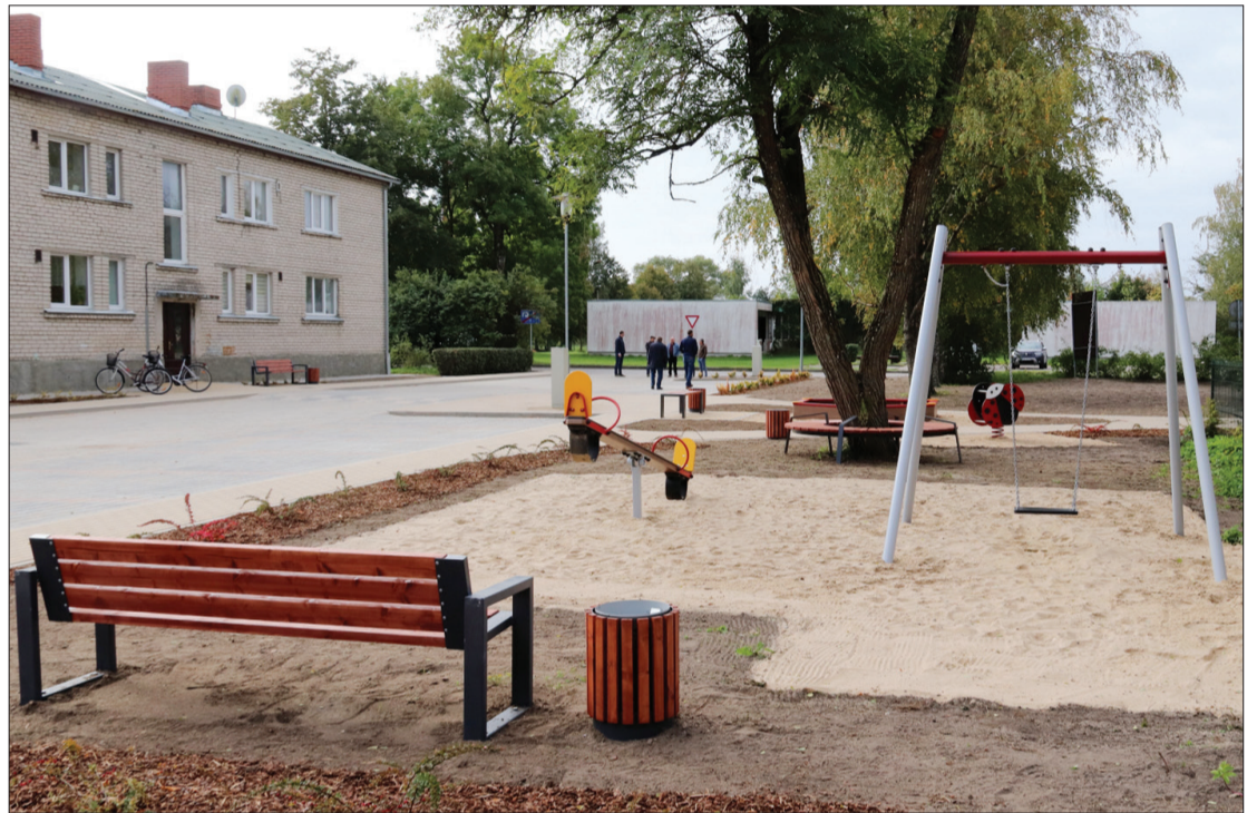
MARLENAS ZVAIGZNES FOTO

Rožu ielā 2 un Rožu ielā 4 Piltenē padomāts gan par pieaugušo, gan bērnu vajadzībām – ir, kur rotaļāties, ir, kur atpūsties.