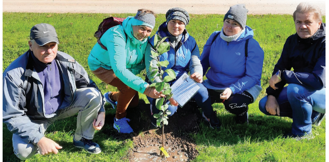
Užavnieki Zūrās pie pašu iestādītas ābeļītes.

Nav garlaicīgu pagastu, un nav sliktu laikapstākļu. Viss ir atkarīgs no cilvēka paša – viņa dzīves uztveres un vēlmes darboties.