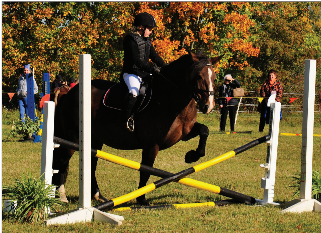
Sacensībās startēja dažādu vecumu jātnieki, bet visi centās, cik spēja.