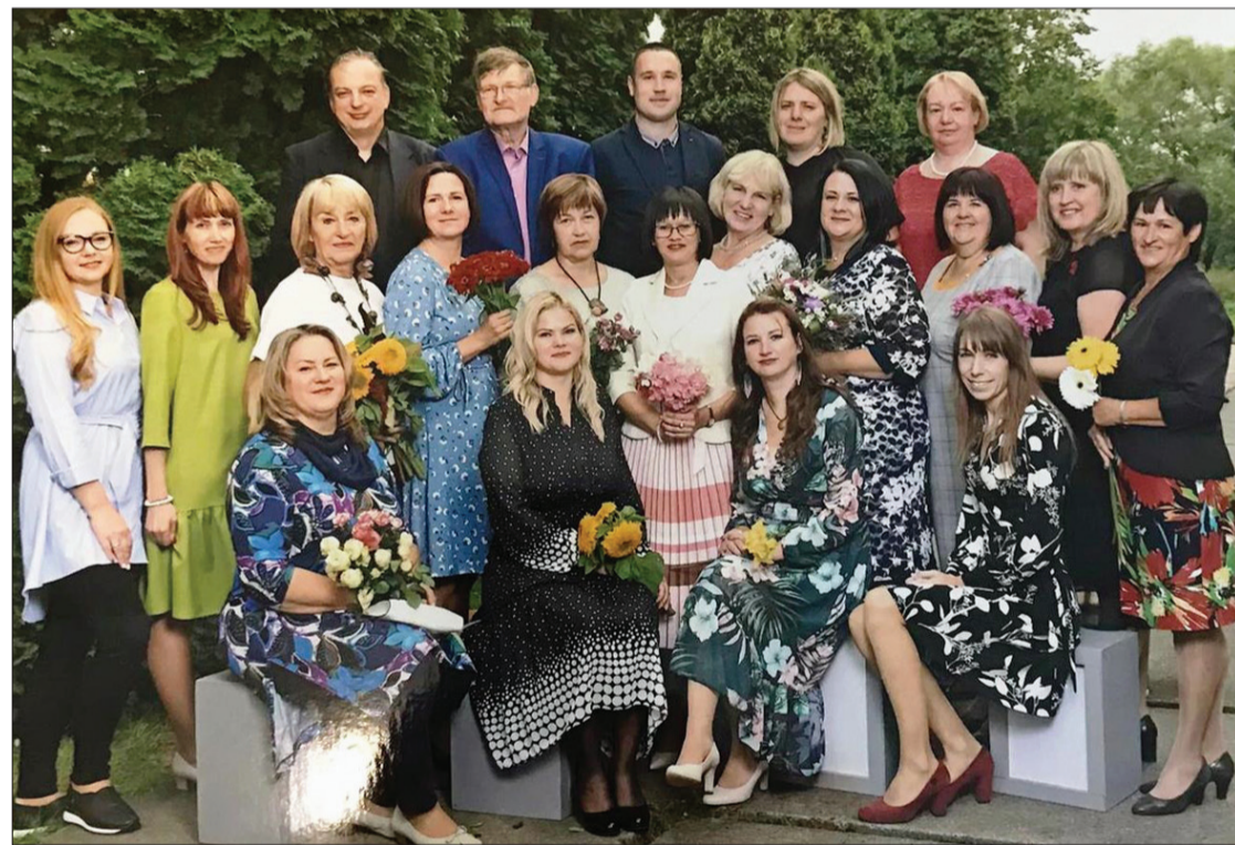
Piltenes pamatskolas pedagogu kolektīvs, uzsākot mācību gadu.

Ir aizsākusies jauna Iapaspuse Piltenes skolas dzīvē. 2020. gada martā Izglītības un zinātnes ministrija izdeva saskaņojumu, ar kuru tā saskaņo Ventspils novada domes 2020. gada februāra lēmumu – no 2021. gada 31. jūlija Piltenes vidusskolu reorganizēt par pamatskolu.