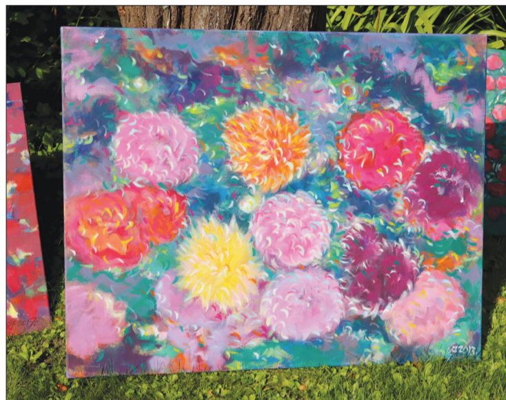
Šīm ugālnieces gleznotajām dālijām daudzi tuvojās kā runči krējūpodam – patika!

Pēdējos gados, kad gleznoju, strādāju pilnīgā klusumā, bet savulaik esmu klausījusies operas, bet viss jau var mainīties. Arī mani darbi