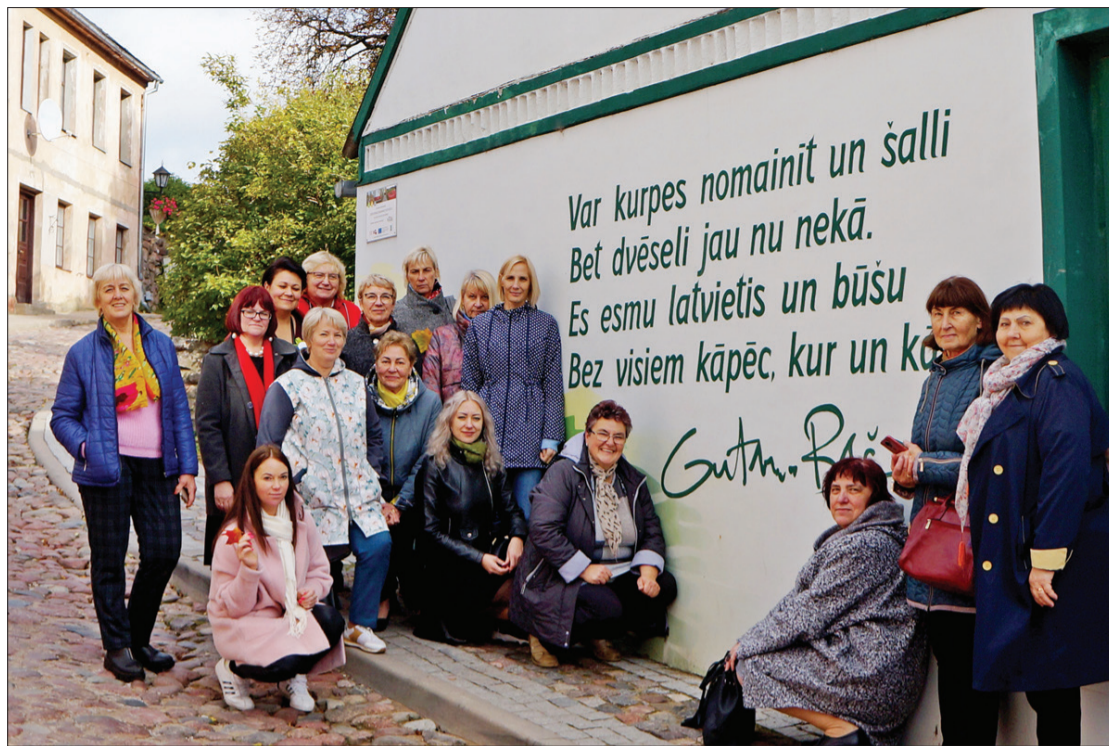
Ugāles vidusskolas pedagoges, viesojoties Kandavā.

tika godināti, loloti un sumināti skolotāji ar sirsnīgu svētku pasākumu. Ciemos bija atnākuši arī skolotāji, kuri savu darba mūžu veltījuši Ugāles vidusskolai. Īpaši tika sveikti skolotāji, kuru pedagogiskā darba stāžs rada prieku un lepnumu mums visiem: