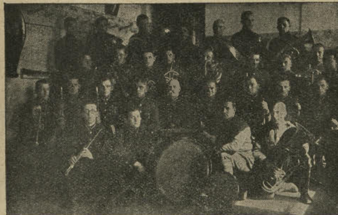
6. RIGAS KĀJNIEKU PULKA ORĶESTRIS.