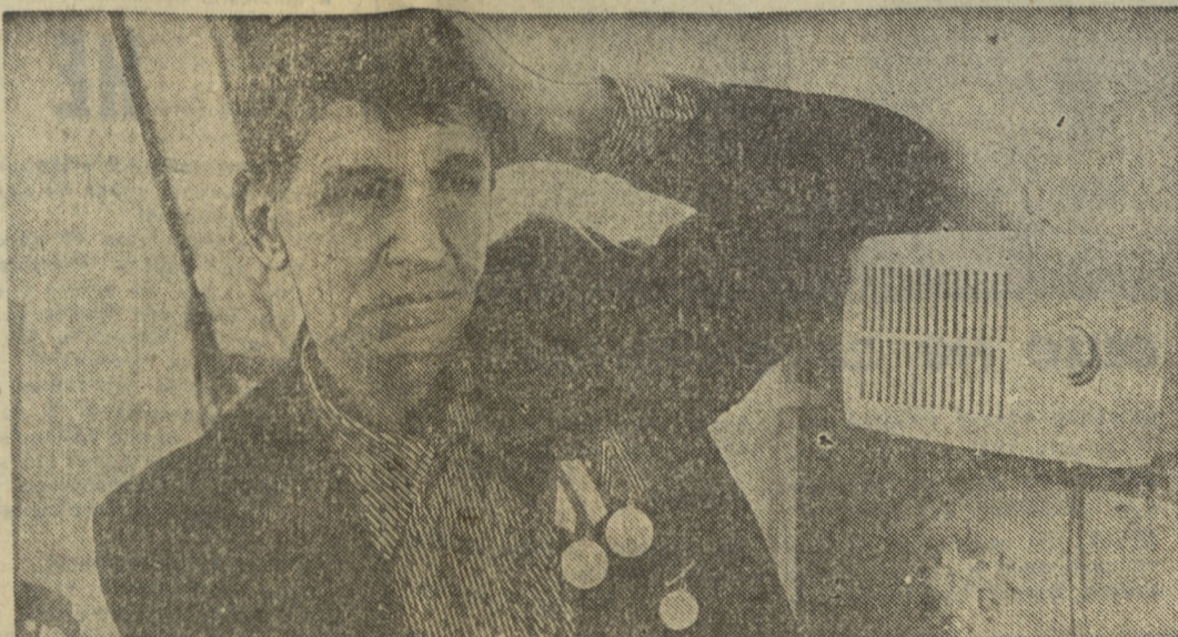
А хороших новостей все нет и нет.