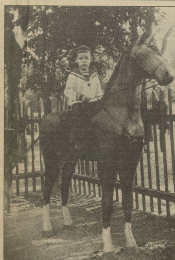
Юный Алексий Ридигер на деревянной лошади

об избрании митрополита Ленинградского и Новгородского Алексия пятнадцатым Патриархом Московским и всея Руси. Пресс-служба Алексия II с его благословения любезно предоставила редакции для публикации фрагменты дневниковых записей Патриарха. «Я не ехал на тот Собор с чувством, что могу вернуться в управление Петербургской митрополией я слишком сроднился с ней: в 1946 году, впервые приехав в город на Неве, чтобы поступать в возрожденные духовные школы, я застал полное игнорирование церковной жизни. И даже в 1986 году, когда я получил назначение на Петербургскую кафедру и высказал уполномоченному городскому совету по делам религий свое желание нанести визит мэру города, я получил категорический отказ: этого, мол, в Ленинграде никогда не было и быть не может. Главное, что мне удалось сделать за четыре года — добиться, чтобы с Церковью стали считаться. Только после Архиерейского Собора, где я получил больше всех голосов, я подумал: есть опасность, что чаша сия меня может и не миновать. Я говорю «опасность», потому что будучи 22 года управляющим делами Московской Патриархии при Святейших Патриархах Алексии I и Пимене, я прекрасно знал, насколько тяжел крест Патриаршего служения».