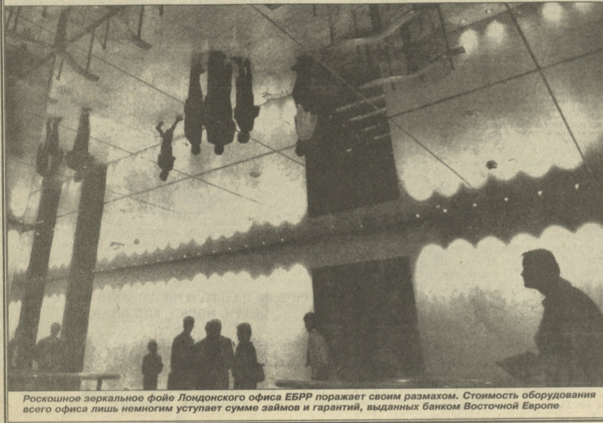
Роскошное зеркальное фойе Лондонского офиса ЕБРР поражает своим размахом. Стоимость оборудования всего офиса лишь немногим уступает сумме займов и гарантий, выданных банком Восточной Европе

На осуществление проектов в странах Восточной Европы реально предоставлено — 101 млн фунтов стерлингов ($165,64 млн) в виде кредитов. По статьям «непредвиденных расходов»: Всего — 200 млн фунтов стерлингов ($328 млн). В том числе: — отделка офиса ЕБРР: парадная зала первого этажа — 1 млн фунтов стерлингов ($1,64 млн) и ее художественное оформление — 250 тыс. фунтов ($390,6 тыс.); мрамор для облицовки лифтов — 750 тыс. фунтов стерлингов ($1,172 млн); — аренда самолета для Жака Аттали: в 1991 году — около 600 тыс. фунтов ($930 тыс.); в 1993 году было совершено около 18 поездок, каждая из которых стоила 22 тыс. фунтов стерлингов ($35 тыс.). Расходы на поездки президента составляют 8% транспортных расходов, предусмотренных проектом; — организация Рождественской вечеринки в лондонском Grosvenor House Hotel — 52 тыс. фунтов ($80,6 тыс.).