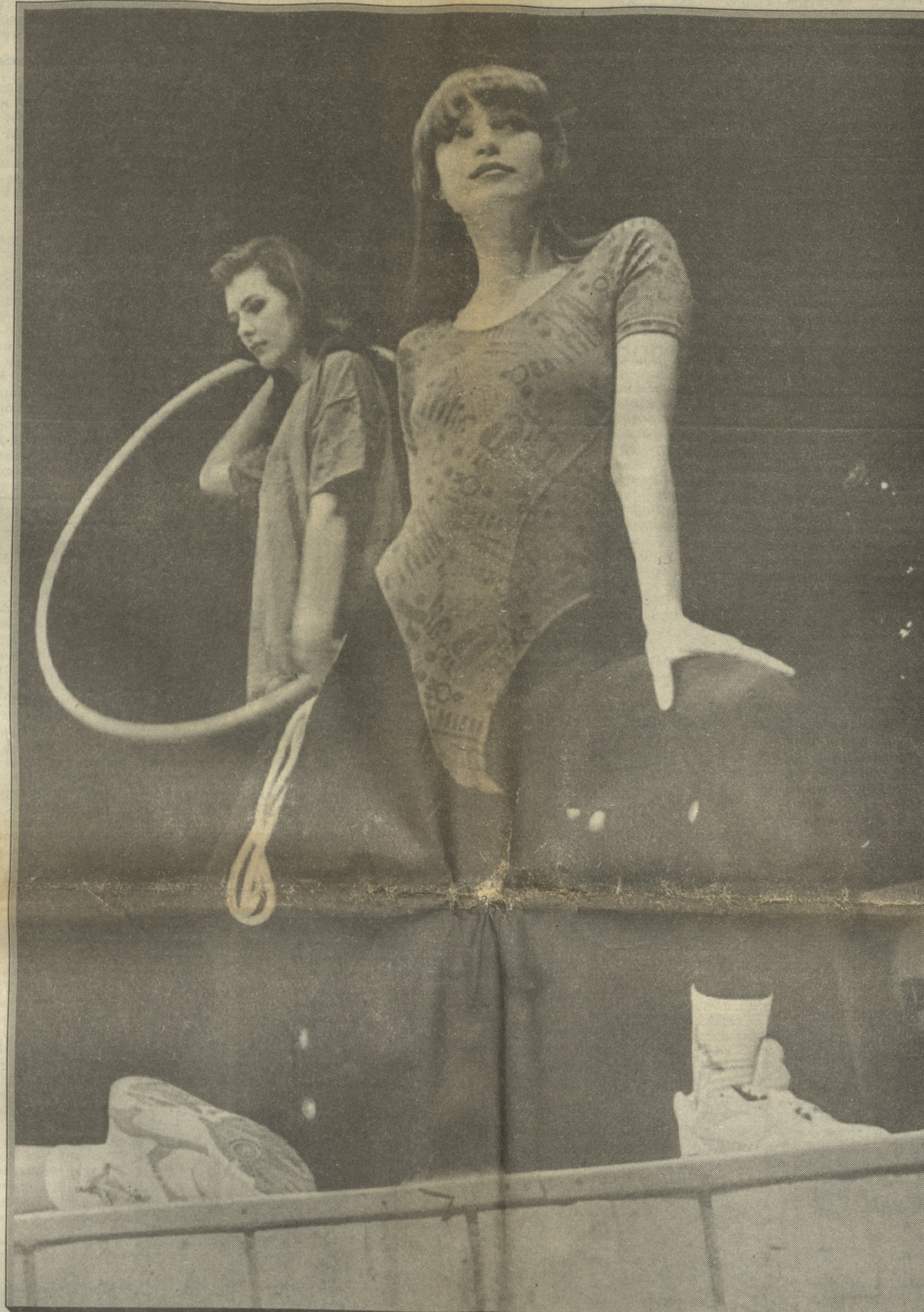
Коллекцию спортивной одежды Puma представляют манекенщицы агентства «Шарм»