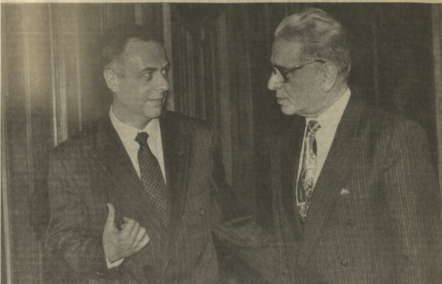
Премьер-министр Болгарии Стоян Беров согласен с Андреем Козыревым в том, что, несмотря на проблемы в двусторонних соглашениях, духовные связи между Россией и Болгарией не ослабли

Отправляясь с двухдневным официальным визитом в Москву, премьер-министр Болгарии Стоян Беров заявил, что несмотря на проблемы в двусторонних экономических отношениях, духовные связи между Болгарией и Россией не ослабли. Подтверждением этому, по его мнению, должно стать подписание в Москве соглашения о сотрудничестве в области науки и культуры. Вчера Стоян Беров принял президента России Борис Ельцин и премьер Виктор Черномырдин. Темы их бесед не ограничивались вопросами культурных связей: стороны успели обсудить и двусторонние экономические