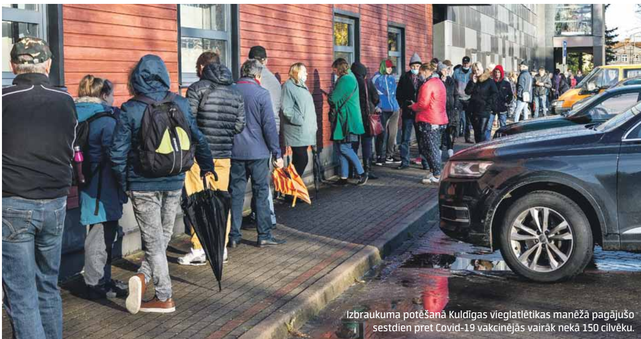
Izbraukuma potēšanā Kuldīgas vieglatlētikas manēžā pagājušo sestdien pret Covid-19 vakcinējās vairāk nekā 150 cilvēku.