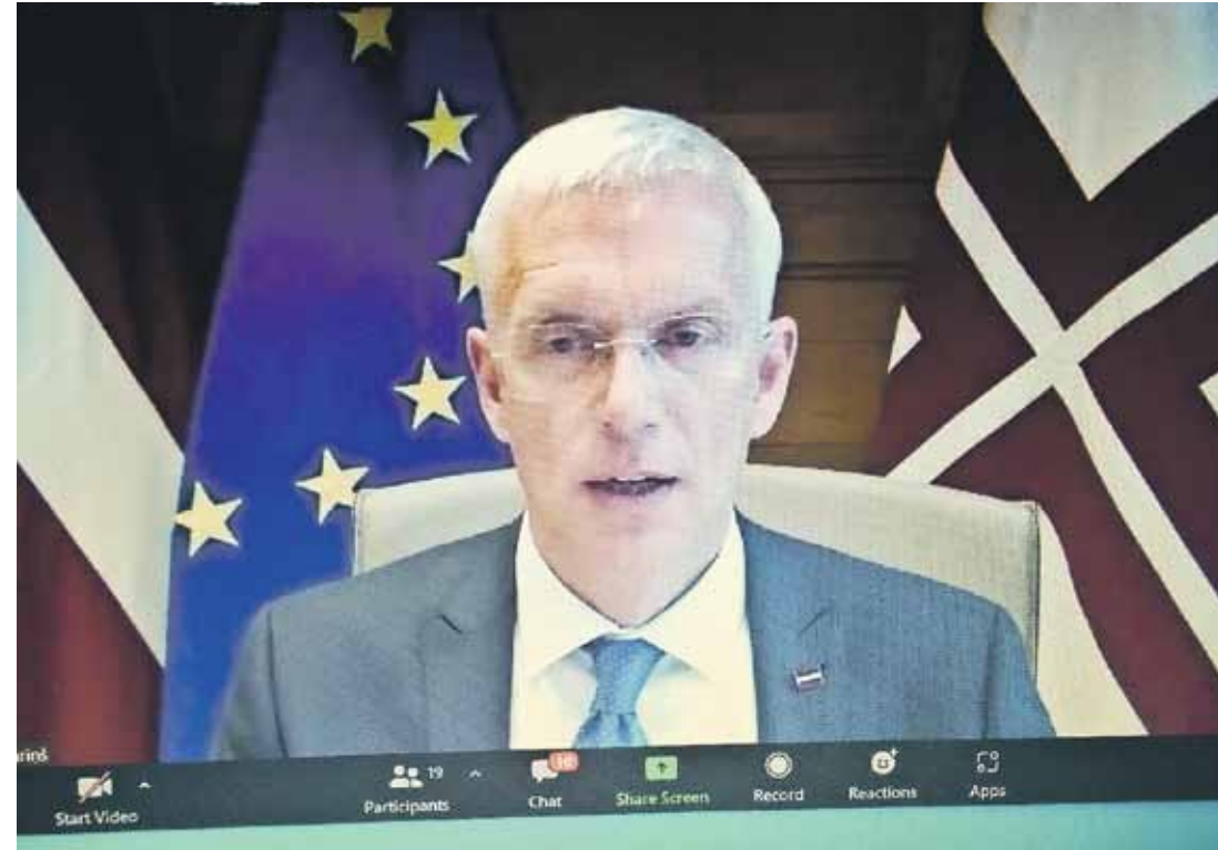
„Vajadzīga visas sabiedrības mobilizācija, uzrunājot vecākus cilvēkus – ne tikai ģimenes locekļus, bet arī kaimiņus. Tiem, kuri dzīvo vieni, jautāt, vai ir vakcinēti. Var palīdzēt pieteikt mājas vakcināciju vai piedāvāt aizvest uz tuvāko vietu,” aicina Ministru prezidents Krišjānis Kariņš.

jas ārstēšanai, algām un vēl daudz kam citam. Vēl 100 miljonu paredzēti investīcijām pašvaldībās, lai labāk var īstenot administratīvi teritoriālo reformu, uzlabot gan ceļus, gan citu infrastruktūru. Zinātnei bāzes palielinājums būs par 32%, un tas ir lielākais gada palielinājums, kāds vispār bijis. Nodokļu slogs darba ņēmējam būs vieglāks – no 1. janvāra neapliekamais minimums būs 350 eiro, bet no jūlija tie būs 500 eiro. Būs labas izmaiņas, kas veicinās mūsu ekonomisko attīstību.”