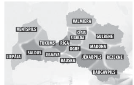
Kartes vizualizācija no Latvijas Televīzijas Twitter konta

attīstības ministrijas atbildību, devumu lietas labā. Ar saukļiem un lozungiem mūsdienās nekādu attīstību nevar panākt. Ja 25 neatkarības gados puse valsts autoceļu ir katastrofālā stāvoklī, tad tas zināmā mērā raksturo arī attīstības iespējas un demogrāfiju. Ir likvidētas pasta nodaļas, skolas, lai „ekonomētu līdzekļus”, bet tas nav devis nekādu ieguldījumu, lai iedzīvotājiem būtu pieejamāki pakalpojumi. Arī tagad nedos, ja Latviju sadalīs 16 apriņķos. Izskan doma, ka līdz 2020. gadam jau neko, iespējams, arī nepārkārtos, jo 9 lielajām pilsētām (nac. nozīmes centriem) un reģ. Nozīmes centriem šajā plānošanas periodā ir iezīmētas pavisam citādas attīstības iespējas, līdzekļi nekā pārējām 89 pašvaldībām. Kā būs pēc 2020.g. ar Eiropas Savienības struktūrfondu naudām, mēs neviens tā īsti nezinām, un tāpēc jo lielāks