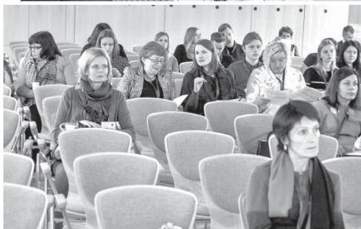
Salas vidusskolas skolotāji un skolēni LatSTE'2016 Plenārsēdē.

25. un 26. oktobrī notika gadskārtējais skolēnu rudens brīvdienų tradicionālais Latvijas izglītības darbinieku pasākums LatSTE'2016 – Latvijas Sabiedrības Tehnoloģiju Ekspozīcija, kas šogad norisinājās Liepājā, Liepājas Olimpiskajā centrā. Pirmo reizi šajā vērienīgajā konfe-