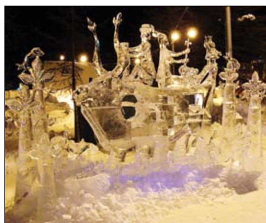
2. Starptautiskajā ledus skulptūru festivālā «Magadanas kristāls» uzvarētāju Jakutijas mākslinieku veidotā skulptūra.