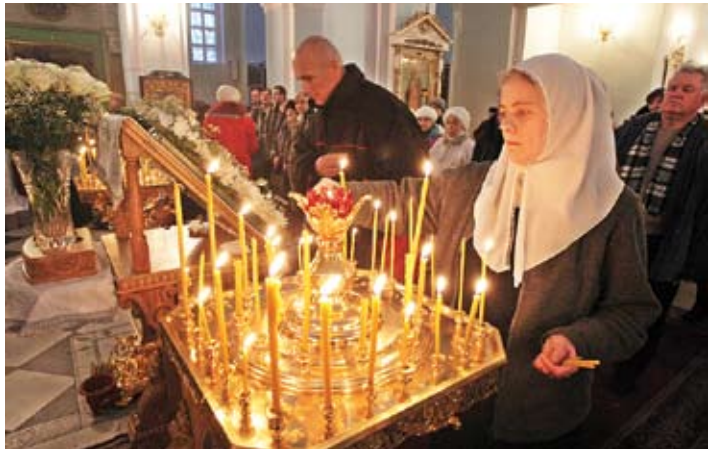
Jelgavas pareizticīgo baznīcā ar liturģiju tika sagaidīti Ziemassvētki.