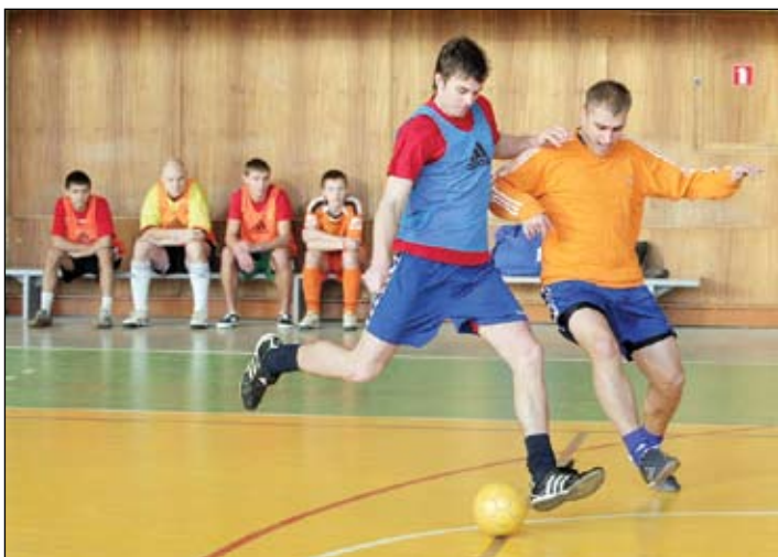
Futbola klubu noslēguma pasākuma simboliskajā turnīrā spēlēja gan futbolisti, gan viņu vecāki, gan līdzjutēji.