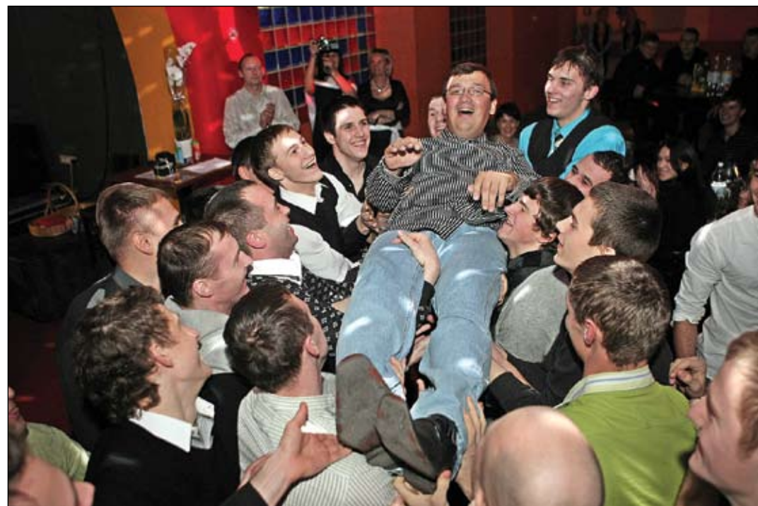
Komandas vienotība ir tās spēks – FK «Jelgava» futbolisti to apliecināja arī savā gada noslēguma pasākumā.

Pēc sīvām bezkompromisa cīņām vietu finālā izcīnīja FK «Viola» audzēkņu vecāku komanda, kā arī 1994. gadā dzimušie jaunie futbolisti. Kaut arī par favorītiem pamatoti tika uzskatīti vecāku komanda, kas arī paši aktīvi apmeklēja futbola nodarbības, tomēr spēles pamatlaiks mazliet negaidīti noslēdzās ar neizšķirtu 2:2. Lai noskaidrotu uzvarētāju, bija jāizpilda 11 metru soda sitiens, un šeit