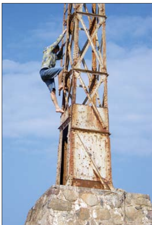
Nereti, lai atrastu kādu slēpni, jāielien vai jāuzrāpjas visneiedomājāmākajās vietās. Tieši šādos gadījumos pastāv iespēja izvērtēt savas spējas un tikai tad darīt.

Protams, ir slēpņi, kuros uzreiz pēc koordinātām var atrast, bet ir arī tādi, pie kuriem var tikt tikai tādā gadījumā, ja būs izpildīts viens vai vairāki uzdevumi vai galā pēc noteiktas formulas aprēķinātas