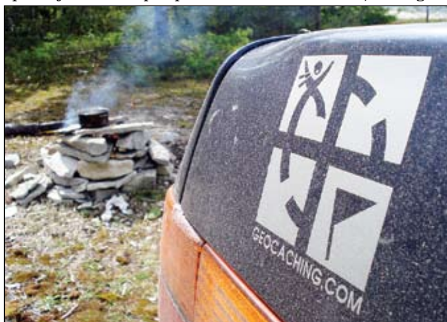
Īpašā kešeru paziņšanās uzlīme – tā apliecina, ka šis braucējs iesaistījies geokešingā.