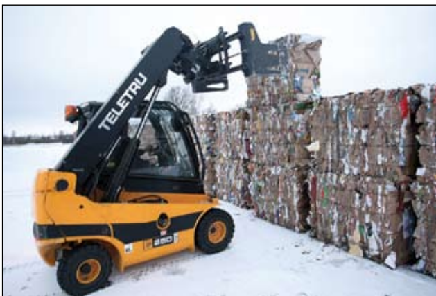
Atkritumu pārstrādes tirgus ir apstājies visā pasaulē – pašlaik, ja vien ir tāda iespēja, izdevīgāk ir veidot produkcijas uzkrājumus, lai vēlāk to realizētu par augstākām cenām. Atkritumu šķirošanas laukumā Ganību ielā izdevīgāku tirgu gaida sapresēts kartons – ir pamatotas cerības, ka jau mēneša beigās cena par tonnu šī materiāla varētu augt.