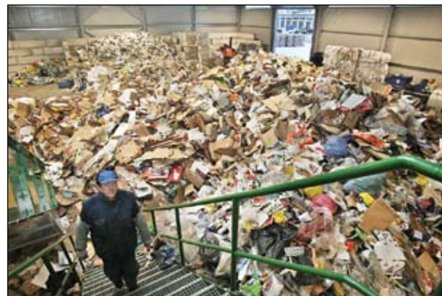
Tas, kas pilsētā ir atkritumi, laukumā Ganību ielā kļūst par materiālu, kam ir pavisam cita tirgus vērtība. Jau tagad pasaules tirgū jelgavnieki var konkurēt ar produkcijas kvalitāti, nu jāgādā, lai kāpinātu arī apjomu – jaudas ir tik lielas, ka varētu pārstrādāt uz pusi vairāk atkritumu.