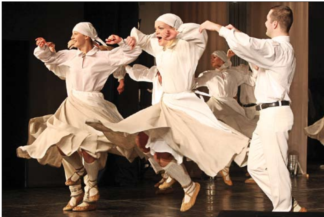
30 gadu jubilejas koncertā «Diždancis» vairāk nekā trīs stundu garumā, mainot dažādu krāsu un tautu tērpus, centās izdejojot vienu «Diždanci» gadu.