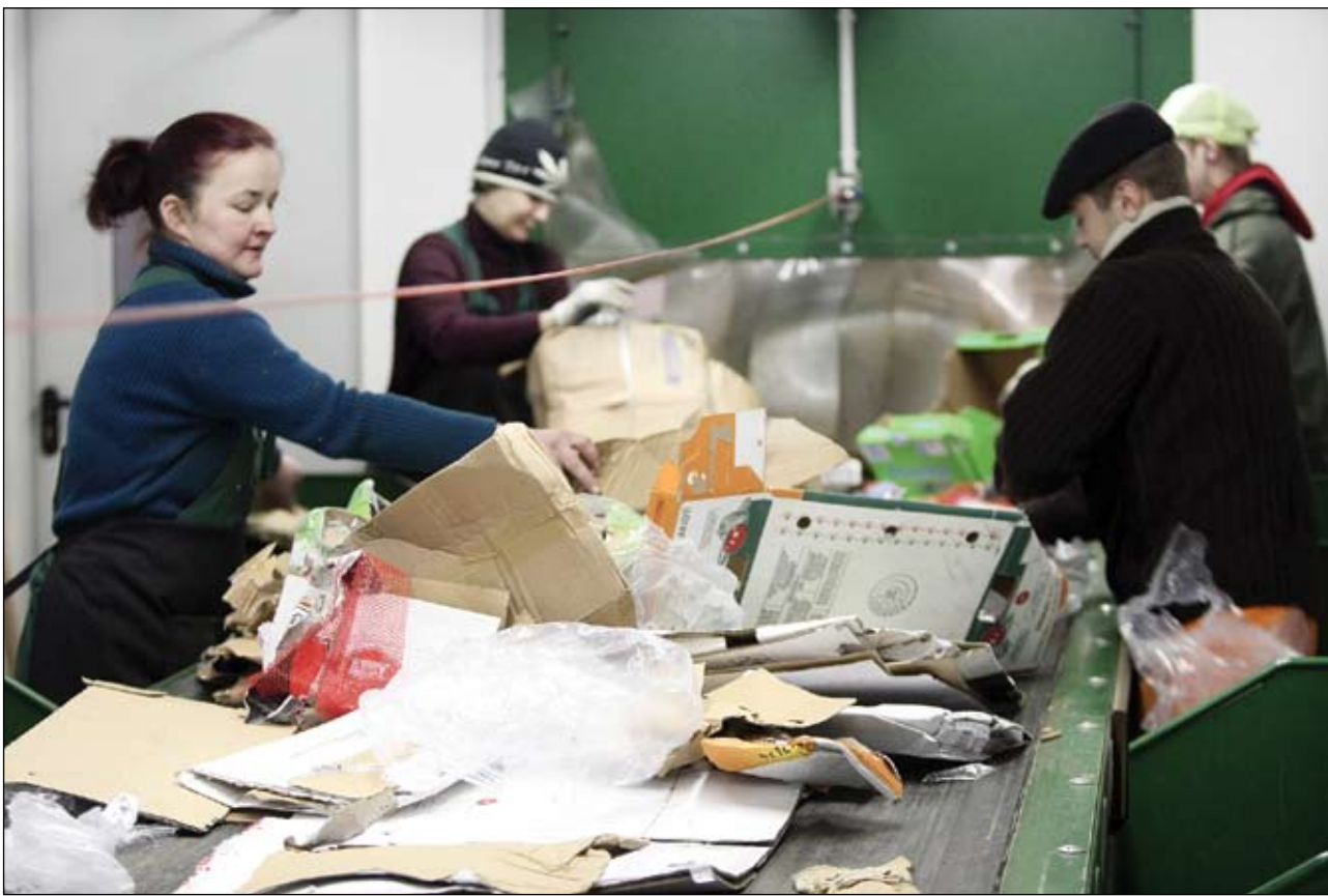
Šķirošanas līnijā strādājošie neslēpj, ka pašlaik darba apjoms ir samazinājies, jo, kā šajā nozarē ierasts, pēc svētkiem sarucis gan pārstrādājamās produkcijas, gan arī tās realizācijas daudzums. Piemēram, maksa par tonnu sapresēta kartona samazinājusies vidēji četras reizes – decembrī to varēja realizēt vien par 15 eiro.