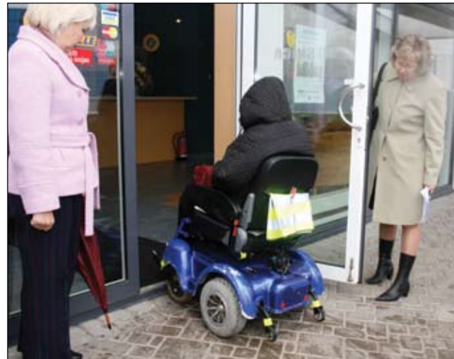
Šķiet, «Zvaigznes» dalībnieces bija vienas no pirmajām, kas pilsētā iesaistījās akcijā, kuru mērķis bija pārliecināties par vides pieejamību cilvēkiem ratiņkrēslā. Viņas atzīst, ka tādos brīžos galvenā doma ir, cik labi būt noderīgam.

Sievietes atzīst, ka «Zvaigzne» viņām ir neatņemama dzīves sastāvdaļa. «Jo te mēs visas sadraudzējamies, apmaināmies ar informāciju, uzzinām, kā kuram klājas, ko kāds kaut kur uzzinājis, par