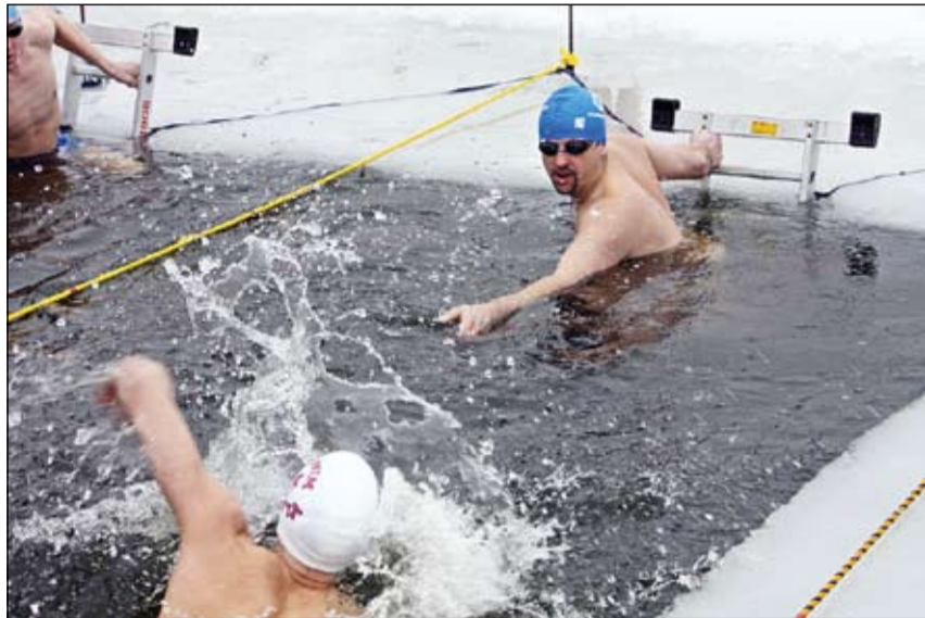
«Jelgavas roņi» komanda 4x25 metru stafetē ir viena no spēcīgākajām Latvijā. To pierāda arī šā gada Latvijas čempionātā stafetē izcīnītā 1. vieta un uzstādītais Latvijas rekords – 01:03,78.

Lai gan pasaules čempionāts notiks nākamgad, arī šogad gaidāmas būtiskas sacīkstes. «Jelgavas roņi» augustā plāno piedalīties starptautiskās sacensībās