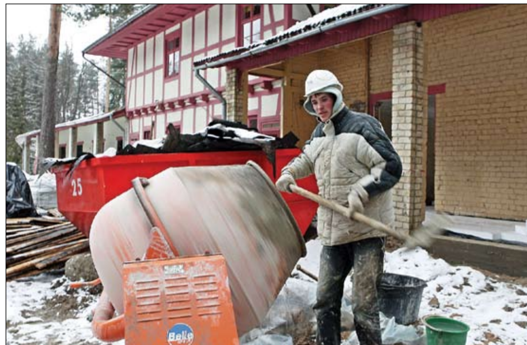
Šobrīd pilnā sparā rit «Lediņu» nometnes rekonstrukcija, un darbus plānots pabeigt jūnijā. Kad sāksies vasaras brīvlaiks, nometne apmeklētājus varēs uzņemt jau jaunā veidolā.