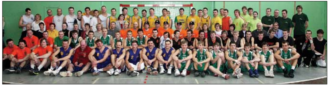
Šogad sacensībām bija pieteicies rekordliels dalībnieku skaits – 12 komandas.