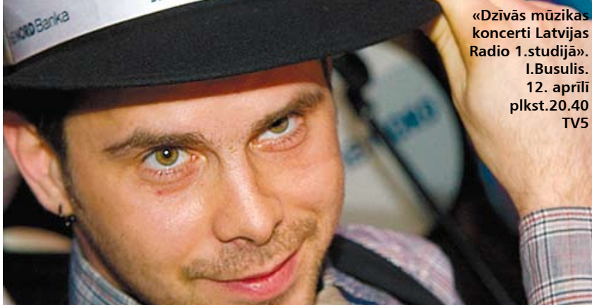
«Dzīvās mūzikas koncerti Latvijas Radio 1.studijā». I.Busulis. 12. aprīlī plkst.20.40 TV5

15.15 «Mis TV 2009» (krievu val.). Latvijas konkurss. 15.30 «Krievijas sensācija» (krievu val.). 16.30 «Makšķerēšanas noslēpumi» (krievu val.). 17.00 «Autoziņas» (krievu val.). 17.30 «Medību sezona» (ar subt.). 18.30 «Viss par kino» (ar subt.). 19.00 «Kriminālā Latvija» (krievu val.). 19.30 «Septiņi jaunieši» (krievu val.). 20.40 «Dzīvās mūzikas koncerti Latvijas Radio 1.studijā». 21.40 «Programma Maksimums» (ar subt.). 22.20 «Kriminālā Krievija» (ar subt.). 23.20 «Mis TV 2009» (krievu val.). Latvijas konkurss. 0.20 «Dāvida šovs».* 1.35 «Izsole» (krievu val.); «SMS ar iepazīšanos».