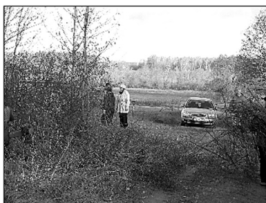
Mājas pagalms, uzsākot darbus.

28. oktobrī notika talka dabas parkā "Dvietes paliene" Bēbrenes pagasta "Putnu salā". Uz aktīvu darbošanos svaigā gaisā tika aicināti biedrības "Dvietes senlejas pagastu apvienība" biedri un visi citi, kas vēlējas pavadīt brīvdienu, aktīvi darbojoties mūsu novada dabas un kultūrvēstures saglabāšanas labā.