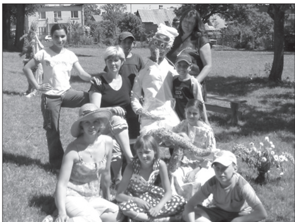
Vasaras nometnes dalībnieki. 8.06.07.

1.jūnijā piedalījāmies Sarkanā Krusta organizētajās pirmās palīdzības sniegšanas sacensībās, kur mūsu skolotāji vadīja radošās darbnīcas.