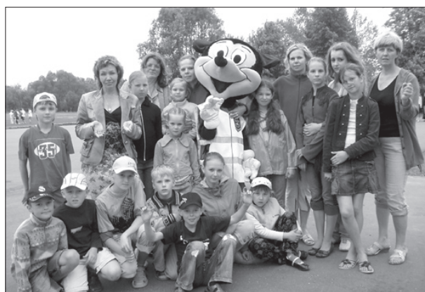
Radošo darbnīcu dalībnieki stadionā. 01.06.07

Ilūkstes bērnu un jauniešu centrs aicina 2007./2008. mācību gadā pieteikties pulciņos: