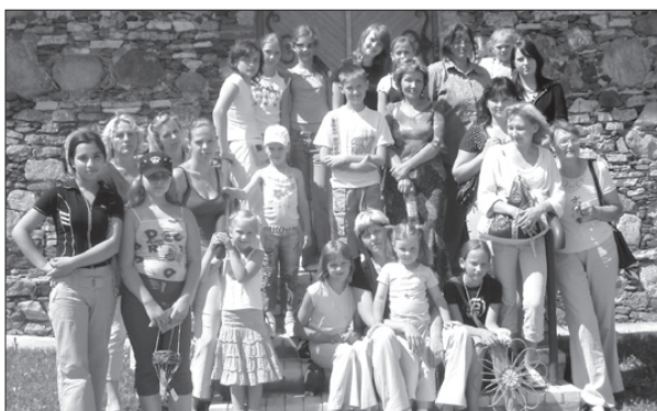
Nometnes "Ziņkārīgā vārņa" dalībnieki un skolotāji pie Līvānu amatniecības centra. 12.06.07

Par atbalstu šai programmai gribam teikt paldies Ilūkstes sociālās palīdzības dienestam. Ar viņu atbalstu daudzi bērni varēja ēst bezmaksas pusdienas nometnes laikā. Vēlreiz gribam teikt paldies arī Ilūkstes ēdnīcas darbiniekiem par garšīgajām pusdienām.