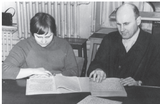
Darbs tipogrāfijā kopā ar neredzīgajiem.