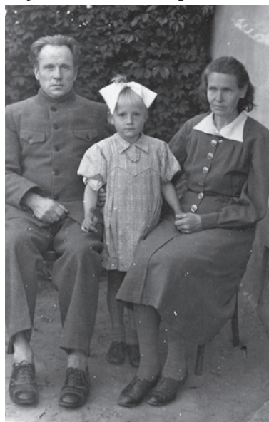
5 gadu vecumā ar audžuvecākiem.

Man patīk arī laba mūzika. Reizēm klausos Radio 2 vai "Klasiķi". Ļoti tuvs man ir P. Čaikovskis, D. Šostakovičs, E. Dārziņš. Mūzika dziedina dvēseli. Kā Jēzus teicis vienai svētajai: "Mūzika ir spārni, kas paceļ dvēseli virs zemes." Bieži klausos arī Kristīgo radio, skatos kristīgos TV raidījumus "Garīgā dimensija", "Vertikāle". Laicīgās avīzes mani neinteresē. Ja gribu, paklausos ziņas. Kad kādreiz dodu kādam garīgu grāmatu, lai palasa, tad skan atbilde, ka neesot jau laika lasīt. Citam miegs nāk, citam darbi. Bet avīzēm laika vienmēr pietiek... Tad gan sirds nosāp.