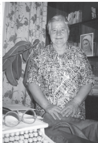
Pirms 5 gadiem pie savas rakstāmmašīnas.

sists uz augšu. Bet ko es varu darīt? Kādu Dievs mani radījis, tāda esmu. Dievs katram ir devis savu talantu: vienam taisīt ēst, otram šūt, citam zemi art. Cilvēks varbūt pat neapzinās, ka tā ir Dieva dāvana. Dzejnieku pilnībā var saprast tikai dzejnieks. Un tie, kam ir dzejnieka dvēsele, pat ja viņš pats neraksta. Bet, ja interesē tikai manta un nauda, tad tādu cilvēku dzeja var vienīgi sakaitināt. Taču ir arī kristīgi cilvēki, kuri pasaka: "Ar dzejolīti vien debesīs netiksi." Bet es citādi