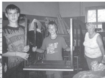
Humāno palīdzību saņem Raudas skola.

Uzsākot jauno mācību gadu, visiem skolotājiem novēlu daudz radošu ideju, zinātkārus skolēnus, dzīvesprieku un nepagurt skolas straujajā ritmā! Skolēniem novēlu, lai gribasspēka būtu vairāk nekā slinkuma un zinātkāres būtu vairāk nekā vienaldzības!