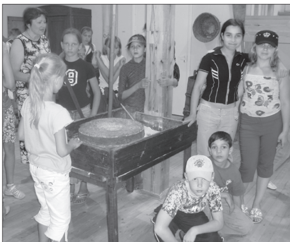
Mēs amatniecības centrā uzzinājām, kā agrāk mala miltus. 12.06.07.