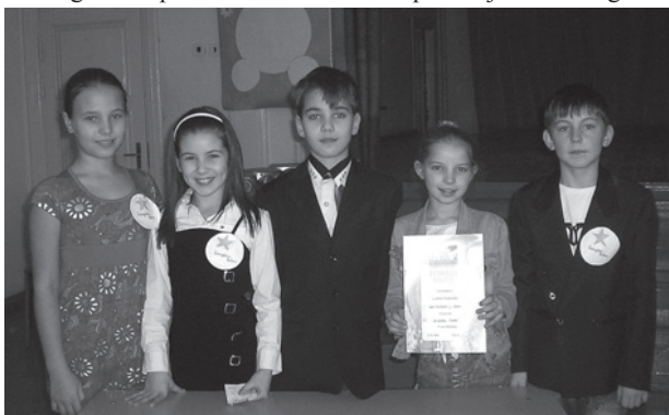
Konkursa "Erudīts" 1.vietas ieguvēji 3. – 4.klašu grupā 4.b klase.

Ilūkstes 1.vidusskolā 2.semestra sākums paiet konkursu „Erudīts” zīmē. Tradicionāli zināšanu un atjautības konkursi tiek organizēti par noteiktām tēmām. Iepriekšējos mācību gados