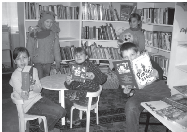
Bērnu stūrītis Bebrenes pagasta bibliotēkā.

Mazie lasītāji par iestāšanos bibliotēkā un piedalīšanos programmā saņems Māras Cielēnas grāmatu „Burtu māja”.