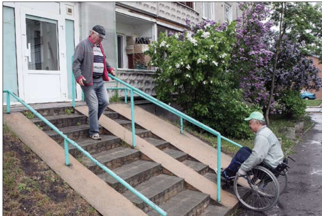
Pie ārsta prakses Meiņu ceļā ļoti domātā lieta sevi tomēr neatrisina – uzbrauktuve gan izveidota, taču reāli cilvēks ratiņkrēslā bez palīdzības pa to uzbraukt nevar.

Vides monitorings sākās pie ēkas Pulkveža O.Kalpaka ielā 16, kur tiek sniegti veselības pakalpojumi. Dienmžēl šeit ratiņnieki nevarēja iekļūt bez citu palīdzības – durvis par smagu un pirmajā stāvā kāpnēs. Taču, neraugoties uz to, ēkai tomēr ir kāds pluss. Proti, koridors, kas atrodas ēkas pirmajā stāvā. Par to sajūsmā ir S.Sprōģe, atzīstot, ka šis koridors ir izcili piemērots vājredzīgiem cilvēkiem. «Grīdas flīzēm malējā līnija ir