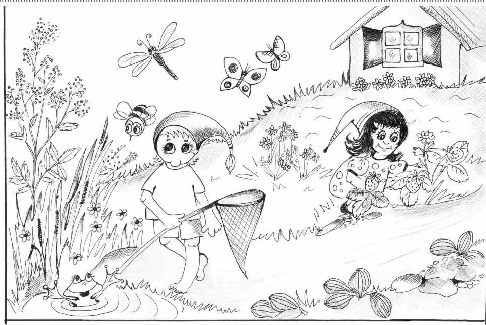
Sagatavoja - Inese Vuškāne