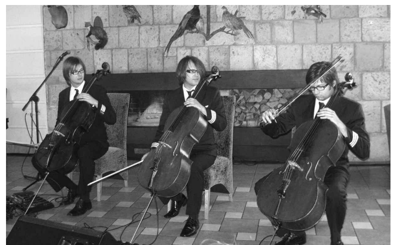
Finālistes un visus klātesošos iepriecināja vienreizējs čellistu trio „Melo – M” sniegtais koncerts.

Latvijas Avīzes rīkotais pasākums Valgumā, kurā tika pulcinātas visas 12 Latvijas sievietes 2009., izvērtās par skaistu un sīrsnīgu labas gribas, labas domas un labu darbu salidojumu. Es