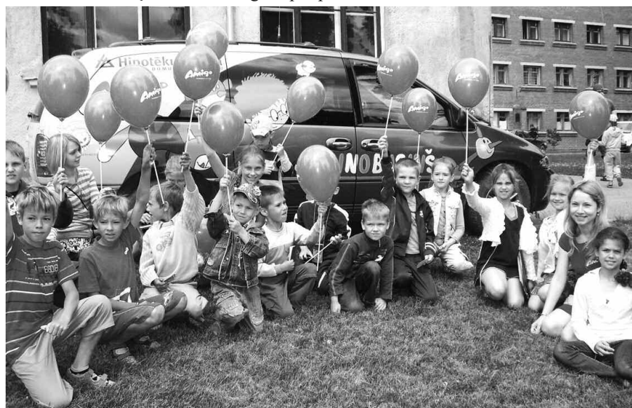
Mazie pasākuma dalībnieki ar „Amigo” dāvētajiem baloniem.