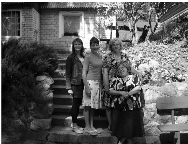
Sēlijas mazpulku vadītājas Aglonā.

2011. gada 1. – 2. augustā Aglonas novadā, viesu namā „Mežinieku mājas” notika trešais seminārs mazpulku vadītājiem projekta „Latvijas mazpulku attīstībai” ietvaros.