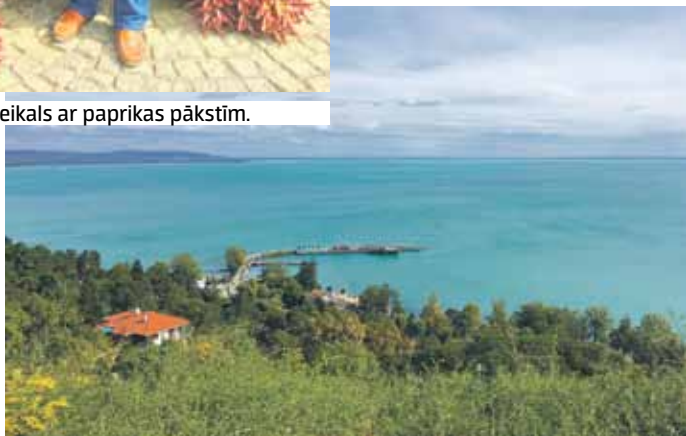
Skats uz Balatonu.