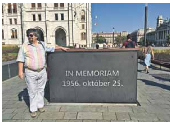
Autors pie ieejas 1956. gada sacelšanās muzejā Budapeštā.