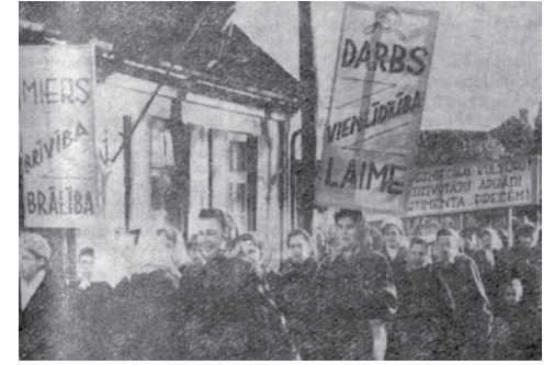
Padomju Dzimtene 1962. gada 10. novembrī