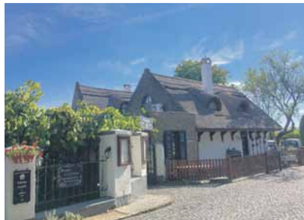
Sena ungāru māja.