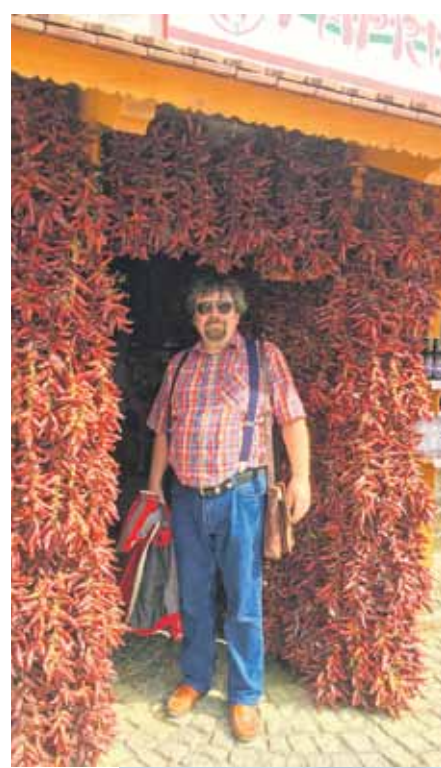
Garšvielu veikals ar paprikas pākstīm.