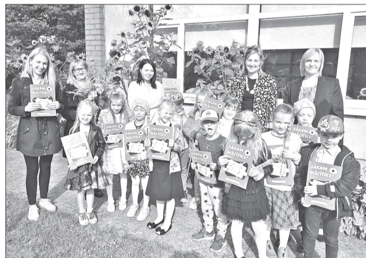
Par tikšanos priecājas gan PII darbinieki, gan mazie ķipari.