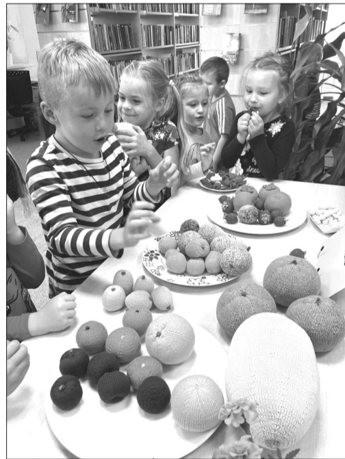
Aditīve augļi un dārzeņi izskatījās tik dabiski, ka bērniem tā vien kārojās tajos iekosties.