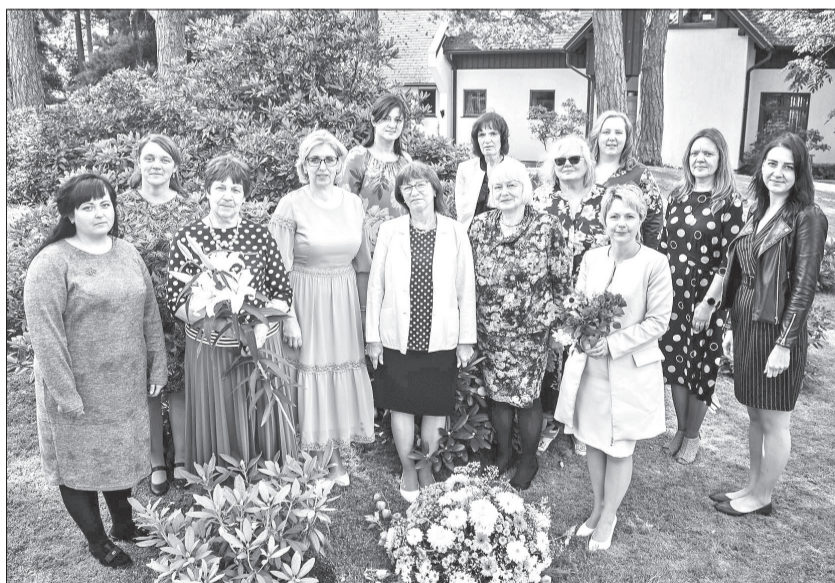
Rojā Mūzikas un mākslas skolas kolektīvs jaunajam mācību gadam sagatavojies godam.