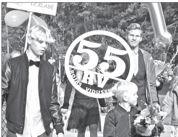
Rojas vidusskolai jau apai 55 gadi.