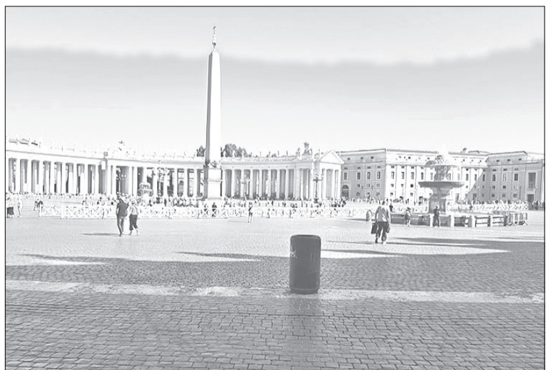
↑ Vatikāns un Sv. Pētera katedrāle – vismazākā valsts pasaulē ar vislielāko ietekmi uz daļu no planētas iedzīvotājiem un notiekošajiem procesiem. Sv. Pētera katedrāle un laukums, panorāmas skats uz Romas septiņu pakalnu Vatikāna dārziem no katedrāles kupola. Bez tā visa vēl skatījām Vatikāna muzejus, kuri iekārtoti pilnīgi, kuras tika celtas renesanses laika pāvestiem. Pašlaik Vatikāna muzeju vairāk nekā tūkstoš zālēs un istabās glabājas vairāk mākslas vērtību nekā jebkurā citā pasaules vietā. Karšu galerija, Rafaēla zāles ar mākslinieka un viņa skolnieku darinājumiem, Vatikāna mākslinieku darbu kolekcija un visu muzeja apmeklētāju mērķis – Siksta kapela ar Mikelandželo veidotajām slavenajām griestu un altāra daļas freskām.