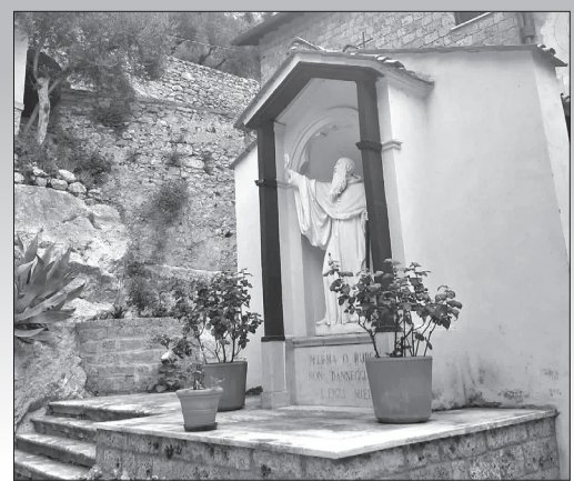
Svētā Benedikta statuļa viņa vārdā nosauktā klostera pagalmā. Teika vēsta, ka ar augšup pavērsto roku viņš ir apstādījis zemestrīci. Vairāk lasiet 5.lpp.