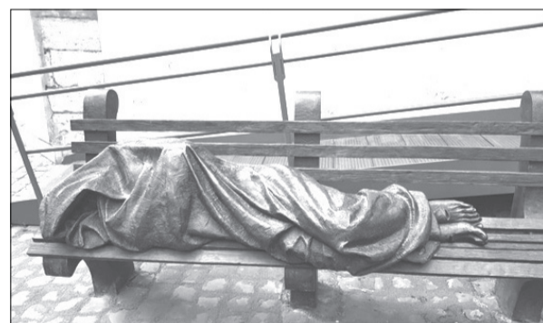
↑ Šis darbs novietots pie bezpajumtnieku atbalsta centra Romā. Lai arī bezpajumtniekiem tiek sniegts vislielākais atbalsts, viņu joprojām Romā ir ļoti daudz. Agrās rīta stundās vai vēlos vakaros mums pašiem gadījās redzēt viņus guļam vāgrūmēs, parkos uz soliņiem vai vienkārši zālē. Pāris soļus no mūsu viesnīcas arī katru nakti gulēja kāds vīrs. Pa dienu visa viņa iedzīve – noplūkusi sega – rūpīgi salocīta, atradās turpat pie mājas durvīm, kur viņš pavadīja naktis.