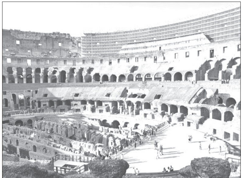
↑ Kolizejs. Tas celts un sākotnēji bija pazīstams kā Flāvija amfiteātris. Tajā bija vietas 50000 skatītājiem. Amfiteātra centrālo daļu aizņēma arēna, kurā notika gladiatoru cīņas, bet ap to bija izvietotas ar marmoru apšūtas skatītāju sēdvietas. Pirmajos pastāvēšanas gados Kolizejā trūka telpu daudzajiem savvaļas zvēriem, gladiatoriem un uz nāvi notiesātajiem cietumniekiem. Zem amfiteātra koka grīdas tika izrakti milzīgi pagrabi, un vēlāk inženieri Kolizejā ierīkoja asprātīgu liftu sistēmu, kas ļāva savvaļas dzīvniekus, kuri pirms tam trīs dienas bija turēti tumsā un badā, pa neredzamām lūkam pēkšņi nogādāt arēnā. Izrādēm Kolizejā vajadzēja ļoti daudz dzīvnieku, jo tās parast sākās ar zvēru cīņām. Vienā no šādām izrādēm nogalināja pat 11000 dzīvnieku, turklāt, jo mežonīgāki un eksotiskāki tie bija, jo labāk. Zvērus arēnā parasti nogalināja mednieki, taču ar bīstamiem un lielām plēšņām cīnījās īpaši apmācīti gladiatori.