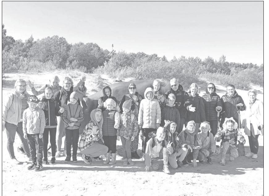
Pārgājienu laikā Rojas pludmalē.

2. No 1. novembra līdz 14. novembrim pārtraukts mācību process klātienē un tiek nodrošināts profesionālās ievirzes izglītības, interešu izglītības programmu apguve process attālināti, izmantojot tiešsaistes stundas E-klases video saziņā vai Zoom platformas saziņā, ko pedagogs pievienojis stundas tēmai vai nosūtījis privātā sarakstē (attiecināms uz interešu izglītības izglītojamajiem);