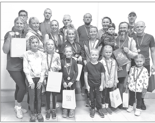
Aktīvākie skrējēji tika apbalvoti ar piemiņas dāvanām.