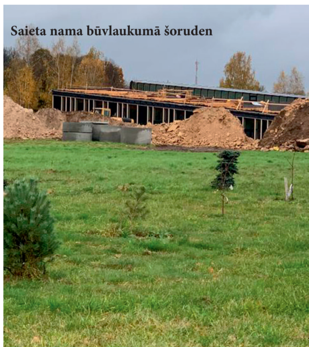
Saieta nama būvlaukumā šoruden