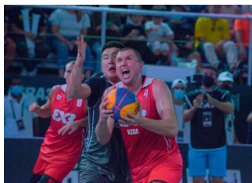
Edgars Krūmiņš (ar bumbu)

3x3 basketbola komanda Rīga piedalījās Pasaules tūres Abu Dabī posmā. Pirmajā spēlē mūsu basketbolisti ar Nauri Mīezi, Kārli Paulu Lasmani, Agni Čavaru un Edgaru Krūmiņu ierindā ar rezultātu 21:16 uzvarēja Mongolijas vienību Ulaanbaatar.