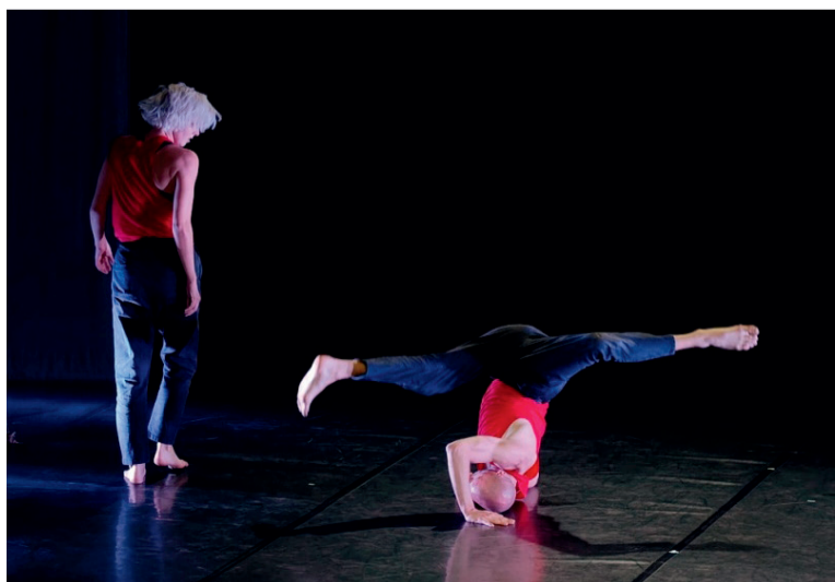
Cie De Fakto. Kad balets sastopas ar hiphopu. Franču jauno dejojāju azarta un jutekliskuma sinerģija