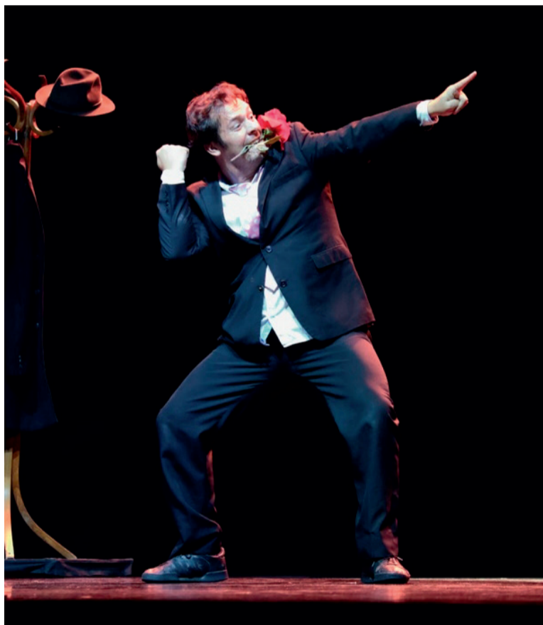
Cie De Fakto. Francijas mūsdienu dejas tendences un šarms mākslinieka Aureliana Kairo interpretācijā