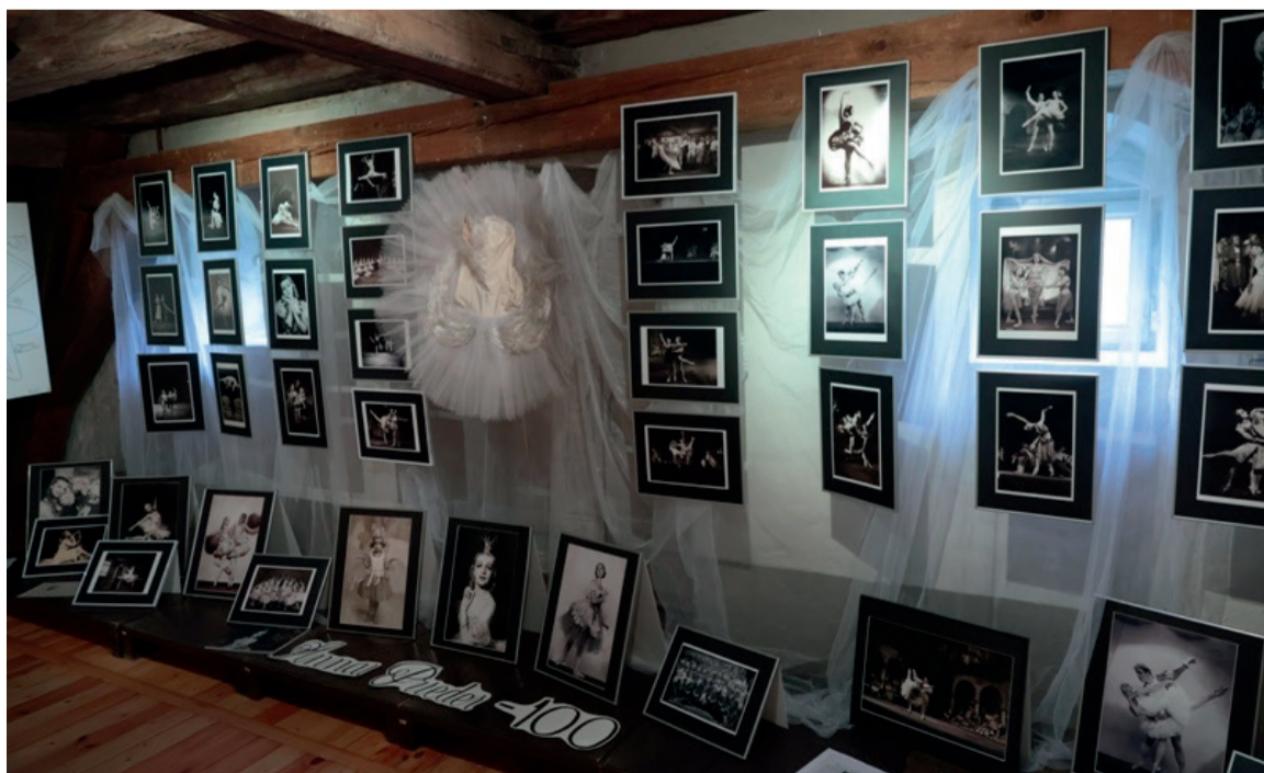
Izstāde Mencendorfa namā Rīgā