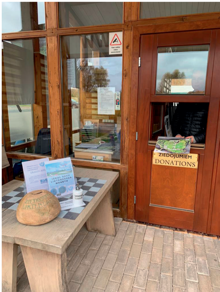
Ievērojot valdības noteikto ierobežojumu darbam klātienē, Likteņdārza Informācijas centrs līdz 14. novembrim būs slēgts

kādos dzīvojam, un tikai kopā, būdami solidāri, patiesi ievērojot šobrīd noteiktos ierobežojumus, varēsim Latvijā apturēt pandēmijas strauju izplatību un atgriezties pie tādas ikdienas, kādu mēs vēlamies."