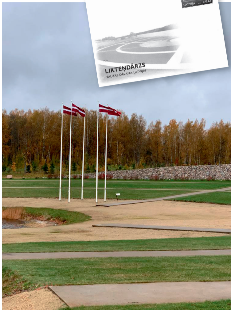
Skats uz amfiteātri no Ulža Gravas tiltiņa