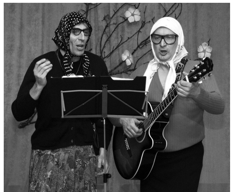
Pasākumu vadīja divas jautras večiņas...

Bebrenes kultūras nama vadītāja Ināra Lapa