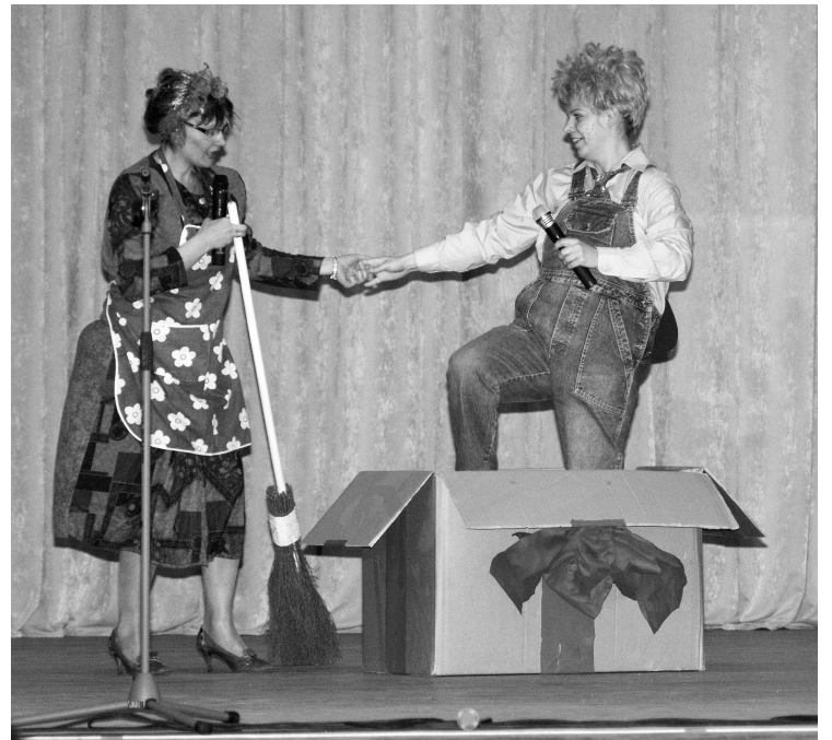
Bokas jaunkundzes pārsteidzošā dāvana