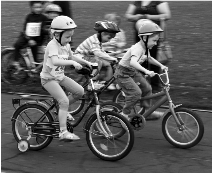
Mazie censoņi ...