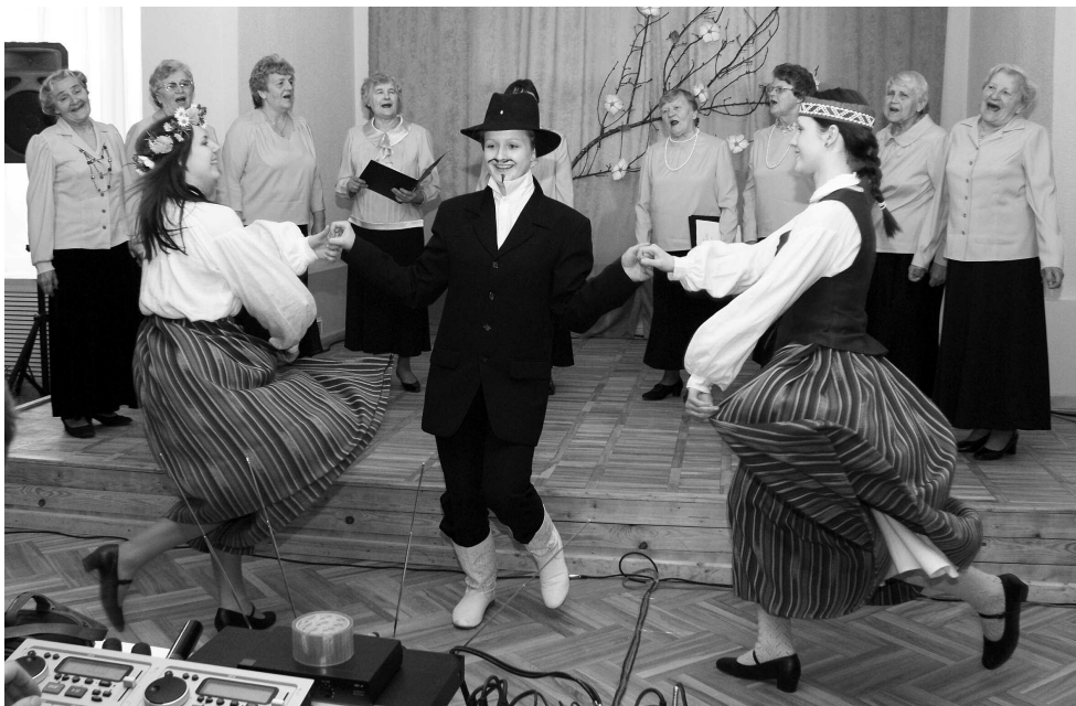
Bebrenes kultūras nama senioru vokālais ansamblis „Sarma” un Bebrenes jauniešu deju kolektīvs vienojās kopīgā priekšnesumā