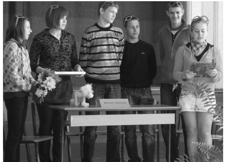
Pirmo vietu izcīnīja ciemiņi - Bēbrenes vidusskolas skolēnu komanda