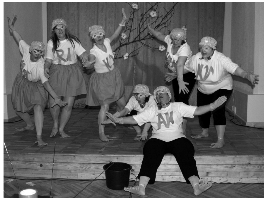
Ilūkstes kultūras centra sieviešu vokālā ansambļa „Saskaņa” atraktīvais priekšnesums