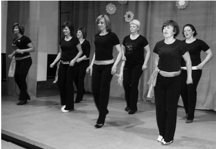
līnijdejojotājas no Šeđeris KN