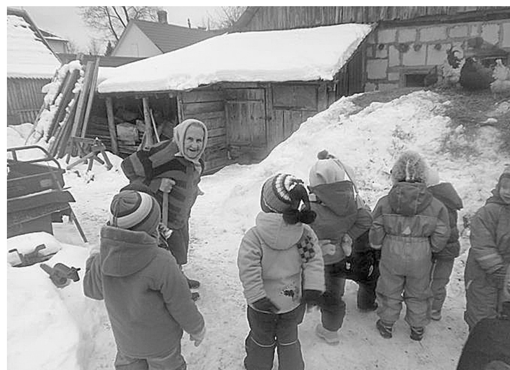
„Saulītes” un „Zīļuki” V. Skrimbles kundzes saimniecībā

jas centra aicinājumu 1. martā rīkot Labestības dienu. Jau no paša rīta iestādē valdīja patīkams satraukums, jo visi bērni piedalījās šajā akcijā. Vispirms ar bērniem tika pārrunāts, kas ir labestība un kā labestību ikviens varam atrast sevī. Kopīgi secinājām, – ja visi cilvēki būtu labestīgi, nebūtu tādu, kuri dara sāpes citiem, nebūtu