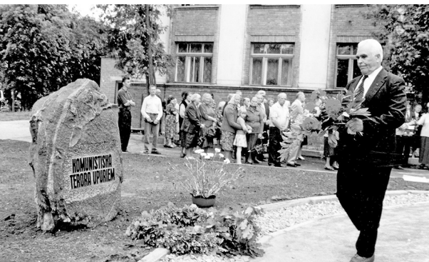
Pieminot salauztos likteņus...

Ceļa vilciens ik pa laikam apstājās, no vagoniem laida laukā cilvēkus. Kad tas nogriezās pa kreisi no Maskavas uz Pečoru pusi, kāds izglītots agronoms, kurš nedaudz pārzināja Krievijas teritoriju, teica, ka visticamāk dodamies uz ziemeļiem, laikam uz Vorkutu, jo pie apvāršņa redzami Urālu kalni. Ešelonu apturēja 19 kilometru attālumā no Vorkutas. Bija skaista, saulaina diena kā šodien. Mūs, apcietināto leģionāru, bija vairāk kā simts, bet tur bija tikai viena kalna nogāzē apakš zemes ierikota ēdnīca, – skurstenis ārā, bet jumta vietā uzvilks brezents. Nakšņojām zem klajas debess, bet nesalām, jo katram bija šinelis. No rīta sākās formēšana uz darbu brigādēs. Galvenais darbs bija ceļu būve un dzelzceļa sliežu paplašināšana. Viens sliežu ceļš jau bija izbūvēts, vajadzēja otru, lai vilcieni var samainīties. Darbs un dzīves apstākļi bija smagi. Tajā laikā es svēru tikai 45 kilogramus, daudzli slimoja. Tikai vēlāk sāka būvēt barakas. Tā mēs tur strādājām un dzīvojām līdz 1946. gada 27. oktobrim.”