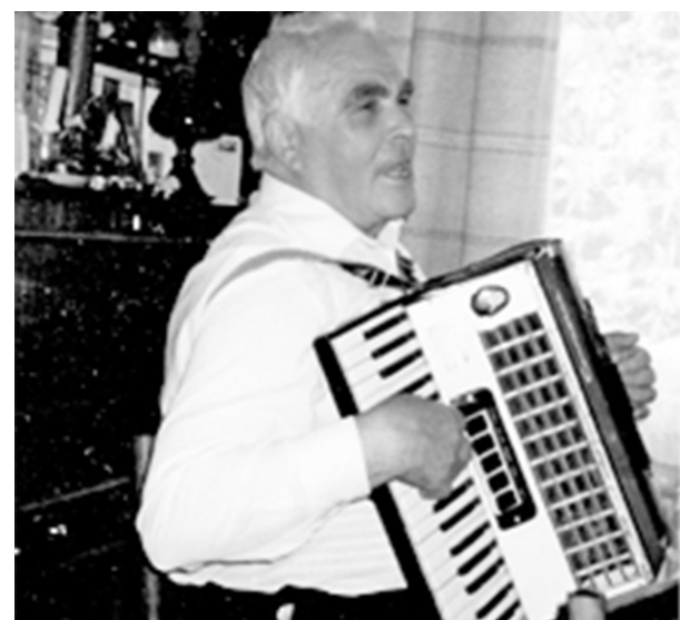
Jubilārs savulaik bijis arī izslavēts muzikants