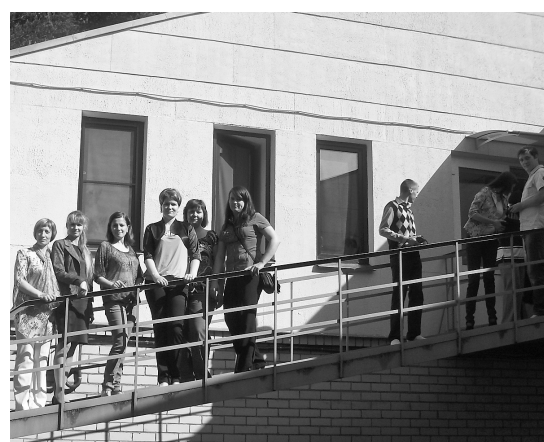
Ilūkstes novada pašvaldības pārstāvji Pleskavā

Kā nākamās projekta aktivitātes tiek plānotas divas starptautiskas bērnu atpūtas nometnes „Atgriešanās dabā” Silajānos, Riebiņu novadā, 2013. gada 8. - 14. jūlijā un Pleskavas apgabalā no 2013. gada 22. - 28. jūlijā 12 - 14 gadus veciem bērniem no daudzbērnu un nepilnām ģimenēm, kā arī bērniem ar īpašām vajadzībām. Nometnes laikā notiks dažādi dabas terapijas kursi: reiterterapija, kanisterapija, fitoterapija, smilšu terapija u. c.