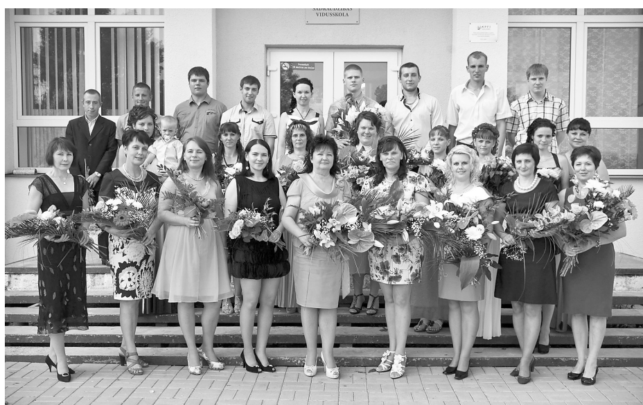
Ilūkstes Sadraudzības vidusskolas neklātienes nodaļas 12. klase kopā ar skolotājiem