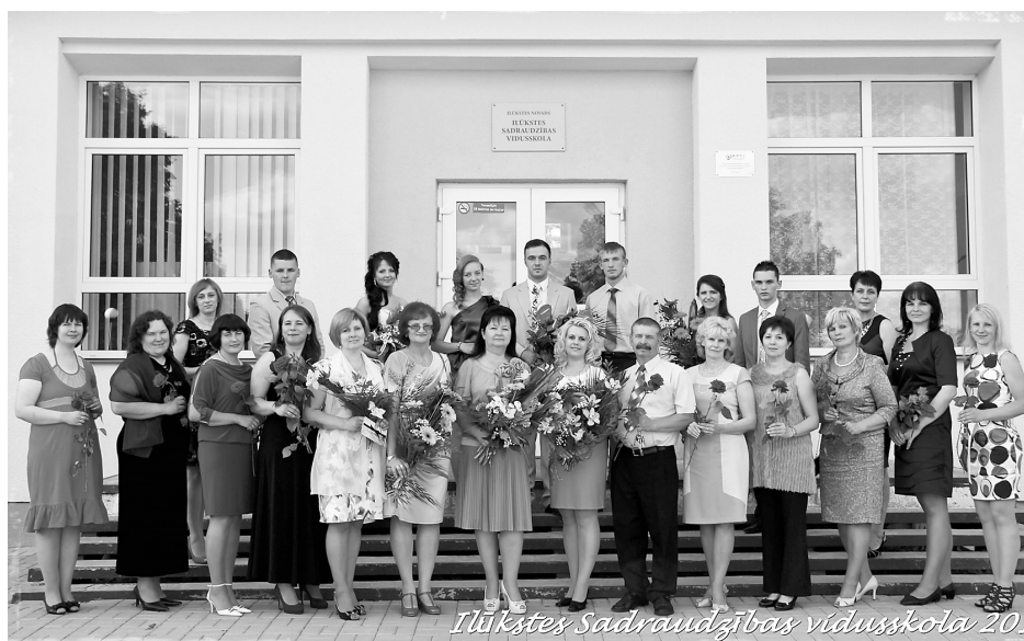
Ilūkstes Sadraudzības vidusskolas 12. klase kopā ar skolotājiem