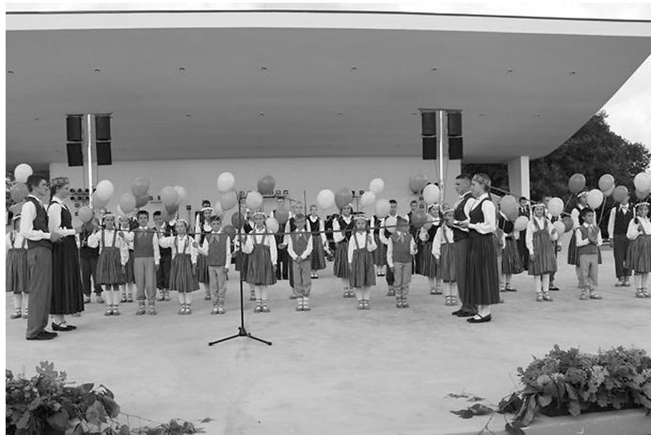
Foto no estrādes atklāšanas pasākuma 10.08.2012.

Šādam brīvdabas objektam viens no būtiskākajiem priekšnosacījumiem ir pārdomāti izvēlēta vieta pilsētā un novietojums konkrētās vides kontekstā. Īpaši veiksmīgi, ja būves funkciju atbalsta tai piemērots dabīgais reljefs kā labas pārskatāmības un akustiskās telpas pamats un vēlāmā virzienā orientēts dabīgais apgaismojums, turklāt šādam objektam jāatrodas labi pieejamā un piebraucamā vietā. Visus uzskaitītos parametrus Ilūkstes pašvaldība ņēma vērā, izvēloties būvniecībai paredzēto zemesgabalu.