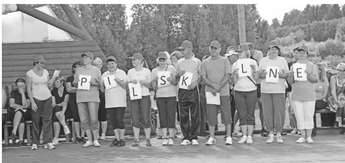
Pilskalnes pagasta pārvaldes komandas pieteikums

priekšnesumos demonstrēja zināmu drosmi un pārliecību par saviem spēkiem, došs paliek drošs – teju katra mēģināja uzpirkt sacensību tiesnesus ar kādu „kukuli”. Piemēram, SIA „Veselības centrs „Ilūkste” komanda „Smailīki” bija sagatavojusi īpašu „zāļu izvilcumu”, tomēr nedz „Smailīkiem”, nedz arī citiem neizdevās korumpēt godprātīgās sacensību amatpersonas. Savu nostāju par vienlīdzības principa ieviešanu tiesneši saglabāja līdz sacensību beigām.