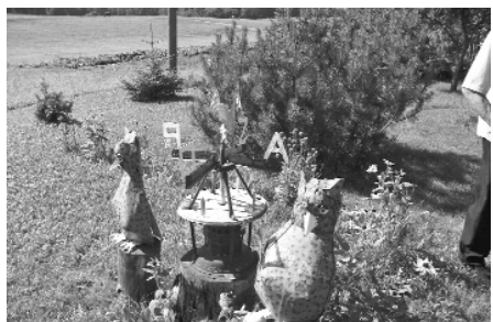
Oriģināls vējrādis Spēku ģimenes dārzā