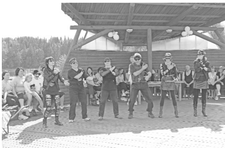
Rokeri „sīt spriguļus”

Vairākās Latvijas pašvaldībās jau sen ir iedibināta jauka tradīcija – reizi gadā, vasaras nogalē rīkot pašvaldības un novada iestāžu darbinieku sporta un atpūtas svētkus. Šogad arī mūsu pašvaldības izglītības, kultūras un sporta nodaļas darbiniekiem radās ideja ieviest šādu tradīciju. 30. augustā pēc rūpīgas plānošanas un gatavošanās varēja sākties pirmie Ilūkstes novada pašvaldības iestāžu un kapitālsabiedrību darbinieku sporta svētki.