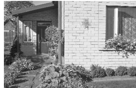
Karoga turētājs ausekļiša formā pie Dilānu ģimenes mājas

Zinām, ka mūsu novadā nav mazums čaku senioru, kuri rūpējas par savas apkārtnes izdaiļošanu. Tas priecē un uztur cerību, ka, sekojot viņu priekšzīmei, sarosīsies arī tie, kuriem pie mājas vēl aug nātres. Varbūt ar domes administratīvās komisijas palīdzību varētu panākt, lai nezales neaug arī pie tām mājām Ilūkstē, kurās it kā neviens nedzīvo, bet kurām ir