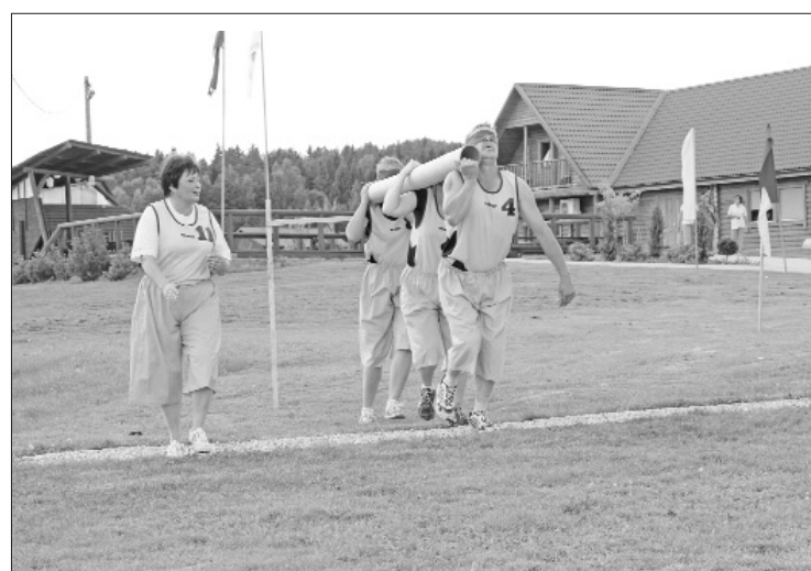
„Noķer mani” smagā panesienā

Par absolūto sacensību uzvarētāju kļuva Ilūkstes novada sporta skolas komanda „Profi”, kura bija nepārspējama „Četrčiņa laivā” un „Malkas gādāšanā”. „Profi” ieguva ceļojošo kausu un uzņēmās pienākumu organizēt