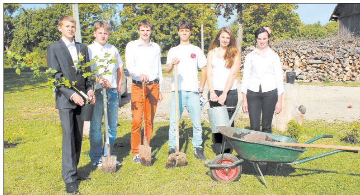
Čaklie rožu stādītāji