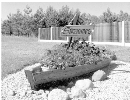
Treščinsku ģimenes mājas nosaukuma noformējums