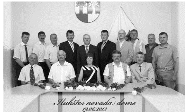
2013. - 2017. gada sasaukuma domes deputāti, uzsākot darbu

Ilūkstes novada pašvaldības ceturrtā sasaukuma domes pirmā sēde