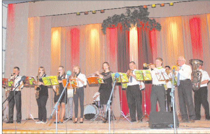
Pūtēju orķestris „Sēlija” spēlē svētku maršu

Sākot no 15. novembra, novada pagastu kultūras nami aicina uz valsts svētku koncer-