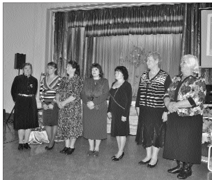
Bijušie un esošie skolas darbinieki

Pēc daudziem gadiem Mēs atkal pārnākam mājās, Vai pasaules lielceļos Staigāts patiešām tik daudz? Un tas ir vienalga, Vai labi vai slikti tur gājis, Tu šodien mūs, skola, Ar jaunību satikties sauc.