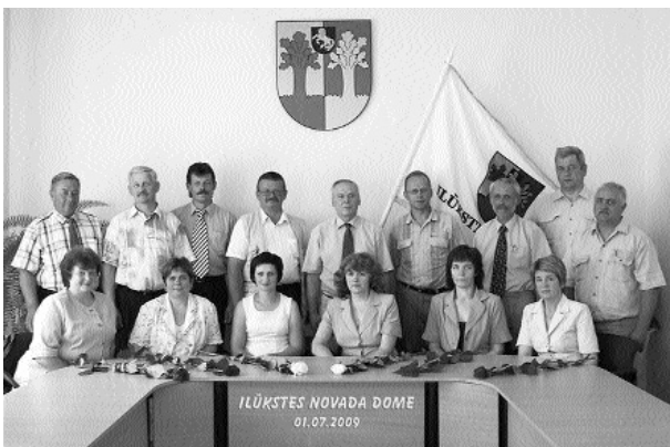
2009. - 2013. gada sasaukuma domes deputāti, uzsākot darbu