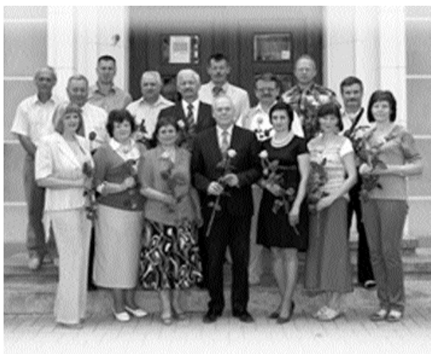
2009. - 2013. gada sasaukuma domes deputāti, noslēdzot darbu

2010. gada 15. februāris Subates pilsēta ar lauku teritoriju tiek sadalīta divās vienībās „Subates pilsēta” un „Prodes pagasts”.