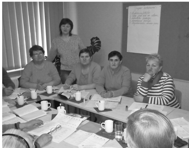
Ar prieku apgūstot latviešu valodu