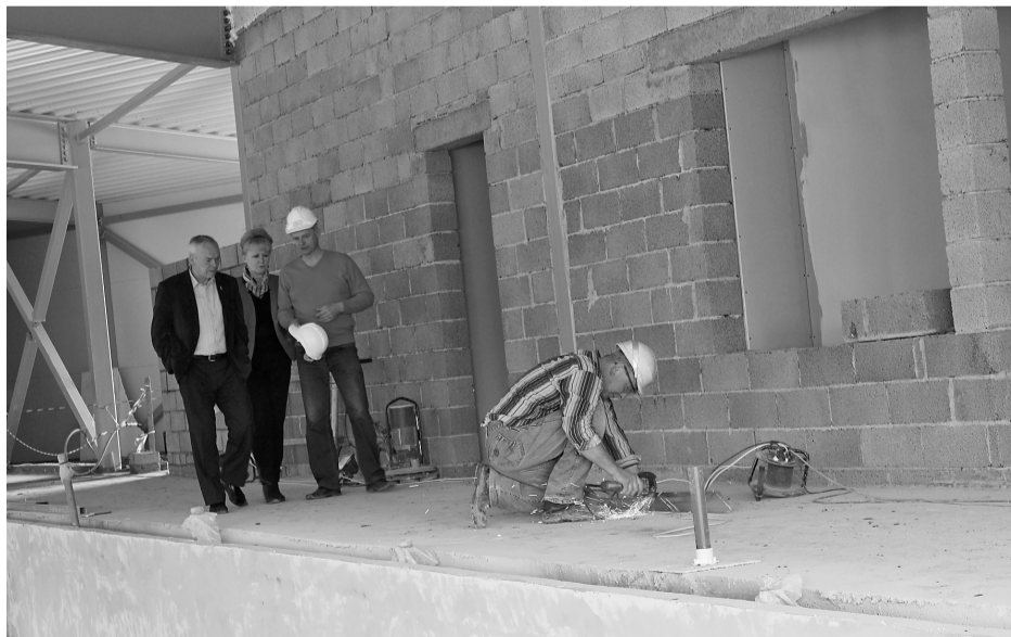
Iepazīstoties ar būvdarbu gaitu

Turpinot realizēt Ilūkstes sporta skolas sporta centra būvniecību, Ilūkstes novada domes deputāti, kopā ar pašvaldības darbiniekiem un pārvalžu vadītājiem, 28.maijā devās uz būvdarbu vietu, lai iepazītos ar paveikto.