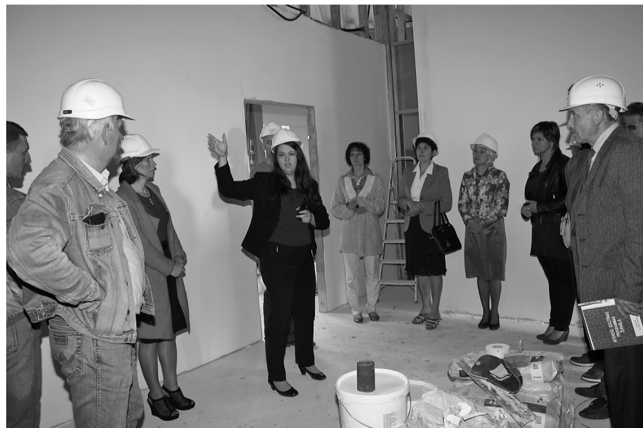
Ikvienam bija iespēja uzdot interesējošus jautājumus