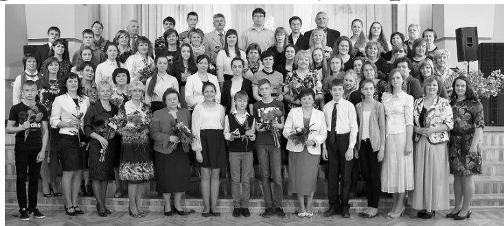
Olimpiāžu un konkursu laureāti un viņu pedagogi

un piedalījās šādās valsts olimpiādēs: vēstures, matemātikas, latviešu valodas 8 - 9. klašu un 11. - 12. klašu grupā un ekonomikas olimpiādē. Valsts ekonomikas olimpiādē