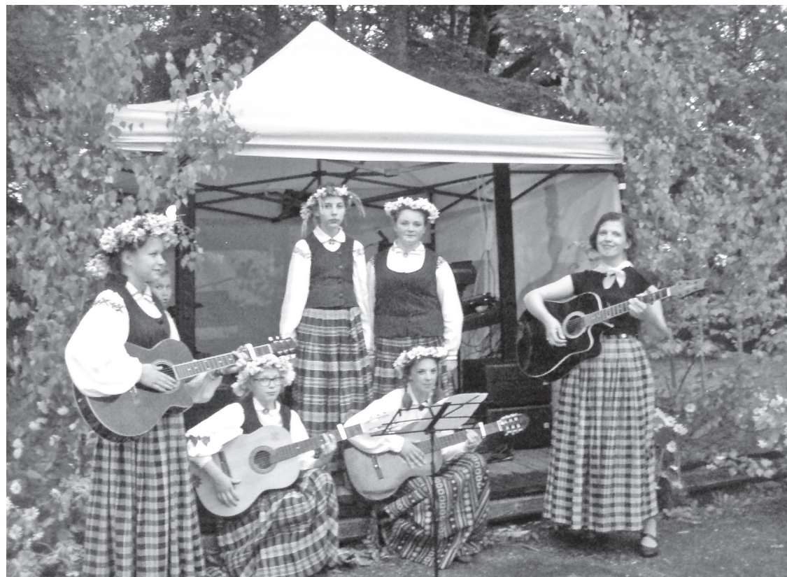
Eglainieši, turpinot tradīcijas, Līgo vakarā pulcējās Lašu pilskalnā

Aivara Stašānu izdotajā „Dvietes burtnīcā Nr.5”. Izstāžu zālē bija apskatāma Sēļu kluba ceļojošā foto izstāde „Sēlijas pilskalnu sasaukšanās”, Daugavpils mākslinieces Unas Guras gleznas, Daugavpils amatnieku biedrības darinātie izstrādājumi. Protams netrūka ne alus kausa, ne vīna glāzes. Sveču liesmiņas aicināja doties no vienas telpas otrā un