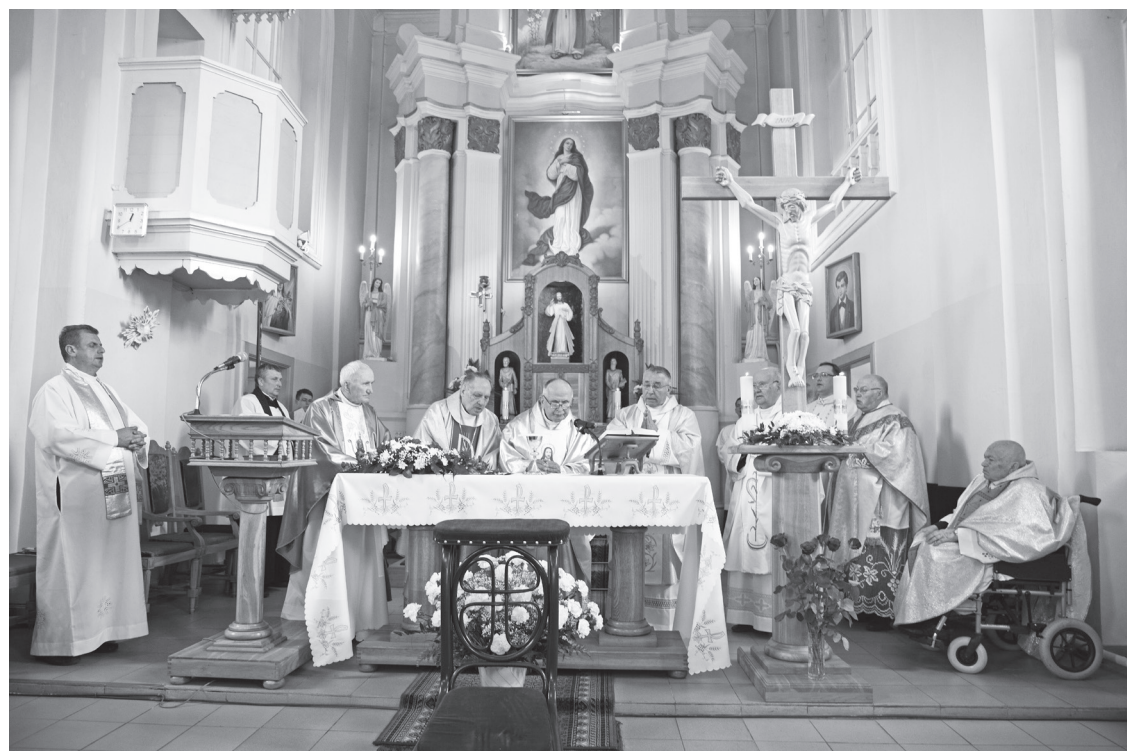
Atzīmējot priestera prelāta Jāņa Krapāna priesterības 50 gadus