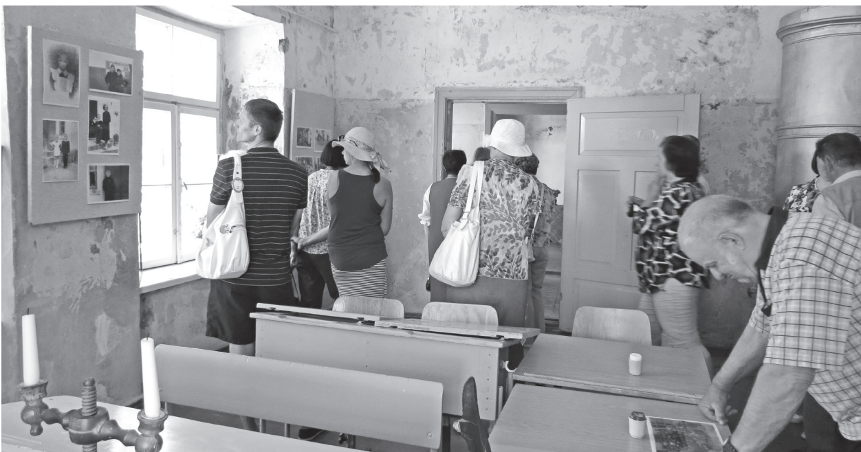
Tiek apmeklēta Dvietes „Muižas ēka”

Neiztrūkstoša pasākuma sastāvdaļa bija dzeja. Skanēja Raiņa un Sukatnieka dzejoļi un pasākumu kuplināja novada dzejnieki. Bet, lai kaut nedaudz veldzētos no svelmainās saules pasākuma gaitā visi tika aicināti tālāk doties uz Dvietes „Muižas ēku”. Savu bijušo skolu ap-