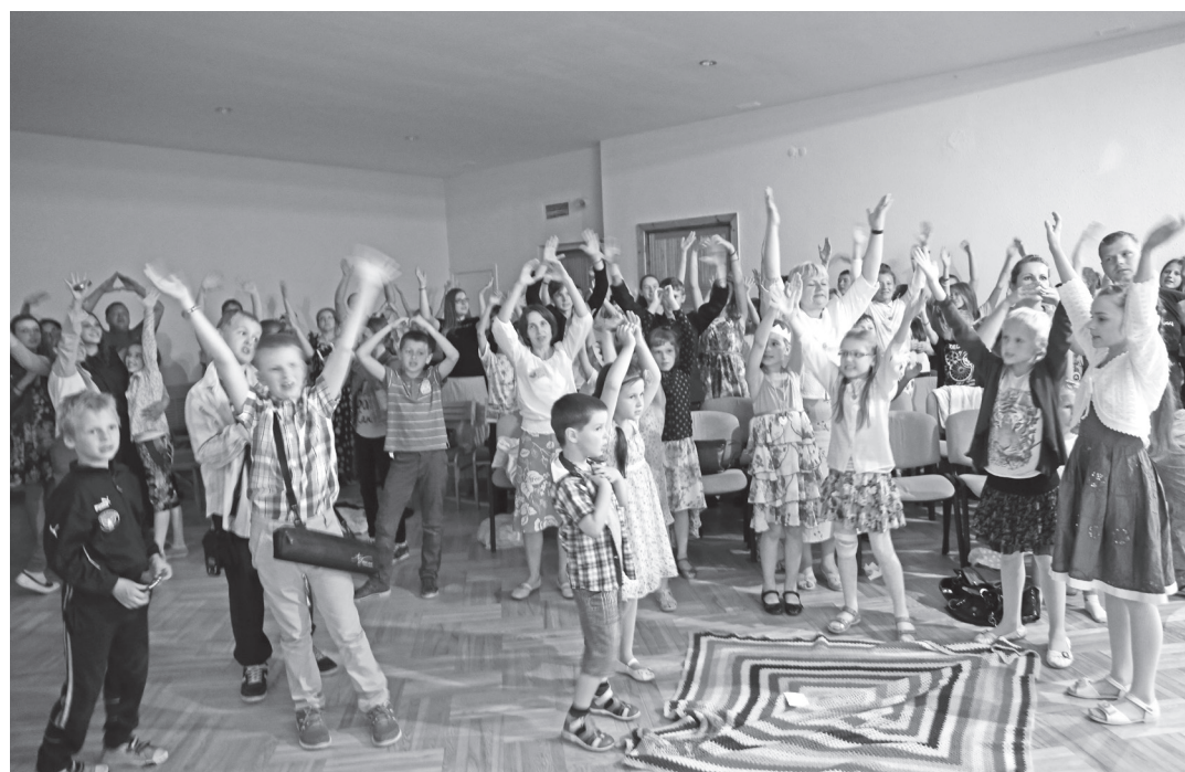
Vasaras kristiešu nometne Bebreņē

No 25. jūnija līdz 1. jūlijam bērniem bija iespēja brīnišķīgi un neaizmirstami pavadīt laiku kristiešu nometnē. Pavisam nometnē piedalījās 106 bērni. Skolēni tika sadalīti 9 grupiņās. Katrai grupai bija savi skolotāji un palīgi, kuri centās šajā laikā būt viņu draugi, kā arī, kuri rūpējās, uzklautāja, iedrošināja, atbalstīja, ja kļuva skumji - samīļoja, un, protams, jūta līdzī-