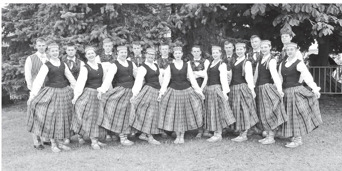
10.-12.klašu deju kolektīvs „Ance”

Ik reizi šīs dienas, kļūst par visas Latvijas svētkiem, kuras