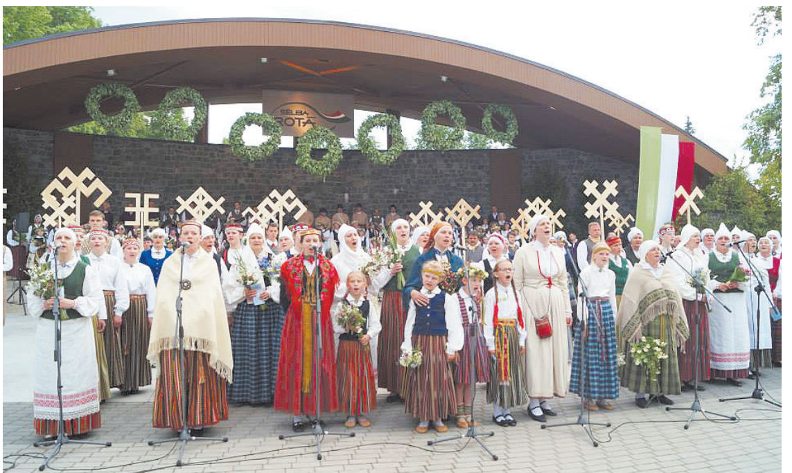
Dižkoncerta „Sēlija Rotā” atklāšana, kur ar pirmo dziesmu svētkus ieskandina arī Bebrenes KN folkloras kopa „Ritam”