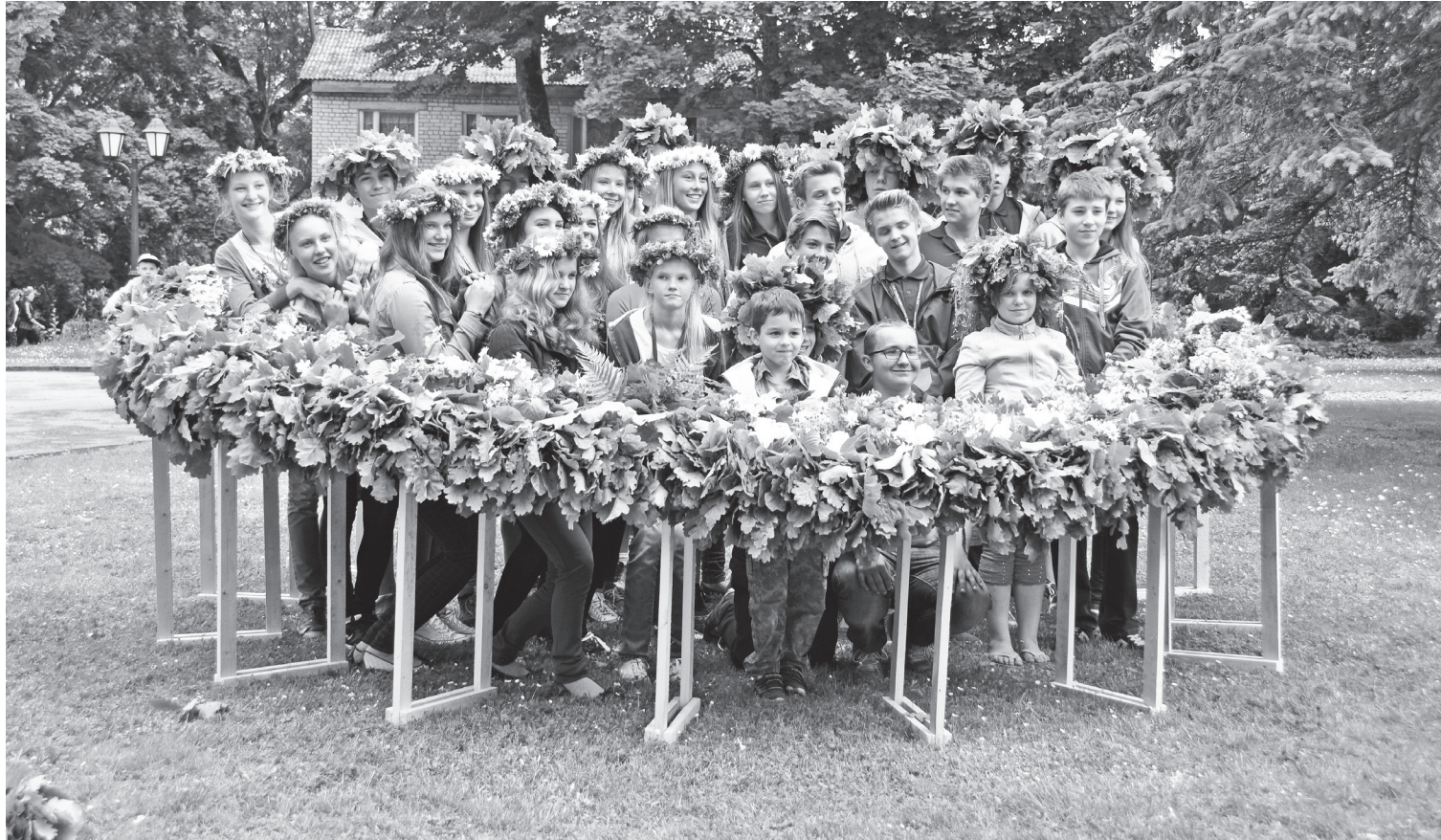
Bebrenē ar Saulgriežu tradīcijām iepazīnās viesi no Amerikas.

Līgo svētki - laiks, kad cilvēks iet roku rokā ar dabu - sauli, ūdeni un uguni, atveroties dziesmā, saviem tuvākajiem un mājvietas gaišumam. Līgo svētki ziedēja visos Ilūkstes novada pagastos. Līgotājus lietus netraucēja, pie uguns kuriem pulcējās ne vien paši pagastu ļaudis, bet arī viesi no tuvākām un tālākām apkārtnēm.