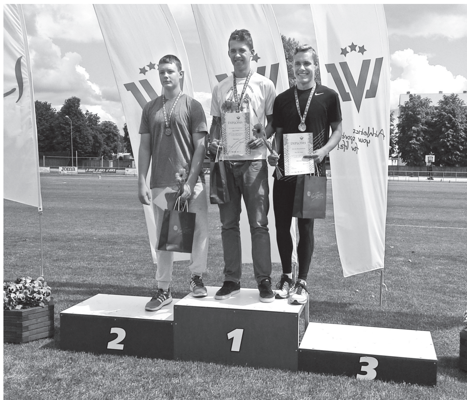
Jaunie sportisti, Latvijas čempionātā vieglatlētikā, labo savus personisko rekordus un izcīna medaļas