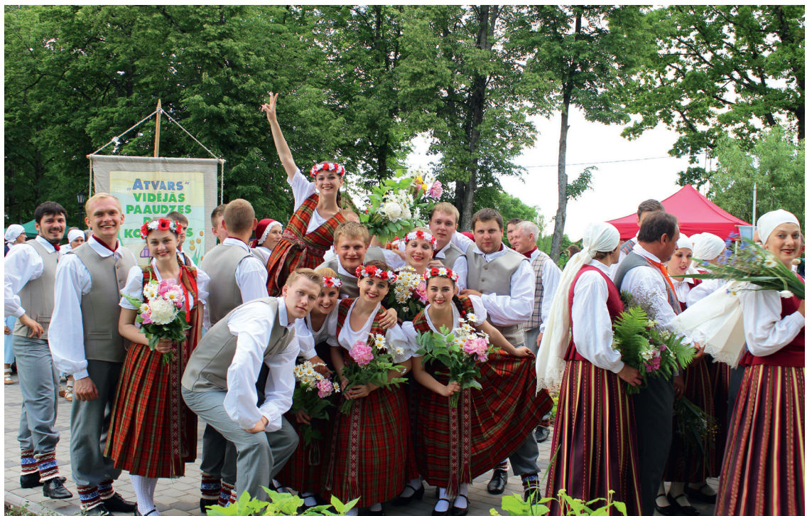
Ilūkstes novada kultūras centra jauniešu deju kolektīvs „Labrīt”