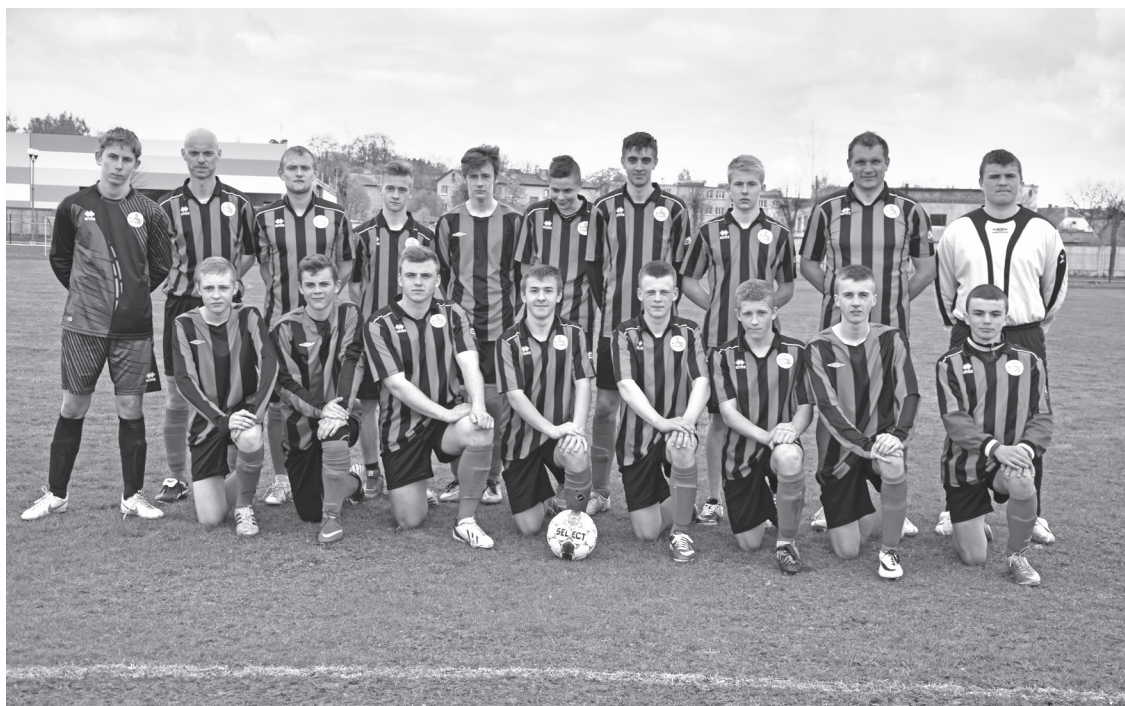
Ilūkstes NSS futbola komanda