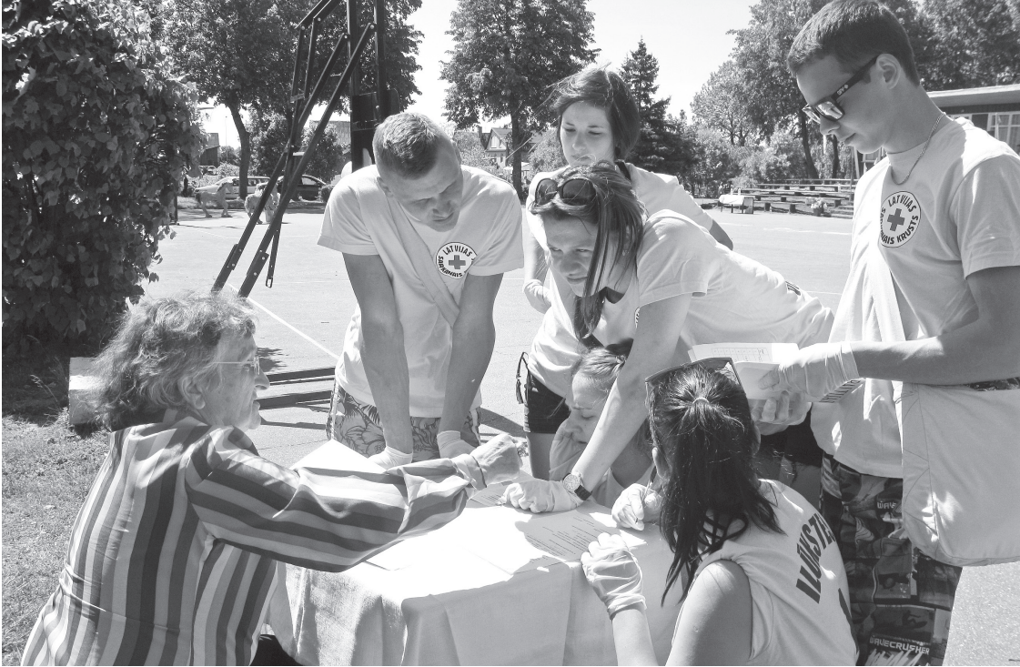
Ilūkstes stadionā notika Daugavpils un Ilūkstes novadu skolēnu pirmās palīdzības sniegšanas sacensības

Tradicionāli 1. jūnijā, Starptautiskajā Bērnu aizsardzības dienā, Ilūkstes stadionā notika Daugavpils un Ilūkstes novadu skolēnu pirmās palīdzības sniegšanas sacensības, kuru mērķis – dot skolēniem iespēju praktiskās situācijās pielietot teorētiski un praktiski iegūtās zināšanas palīdzības sniegšanā, kā arī popularizēt Sarkanā Krusta organizācijas misiju. Ikvienam iegūtās zināšanas ir nepieciešamas, jo mums ikvienam ir jāprot palīdzēt negadījumā uz ielas, atpūtas vietā, mājās. Skolēniem vajag izjust, kā to dara praktiski, kā uzdevumu veic citu skolu skolēni, gūt pieredzi.