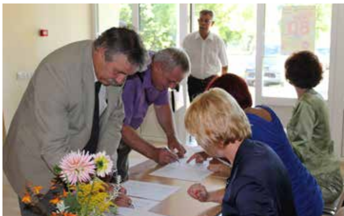
Izpilddirektori no visas Latvijas pulcējās Ilūkstē