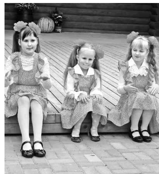
Meitenes dziedāja, skaitīja dzejolišus un iekustināja skatītājus jaukā rotaļā