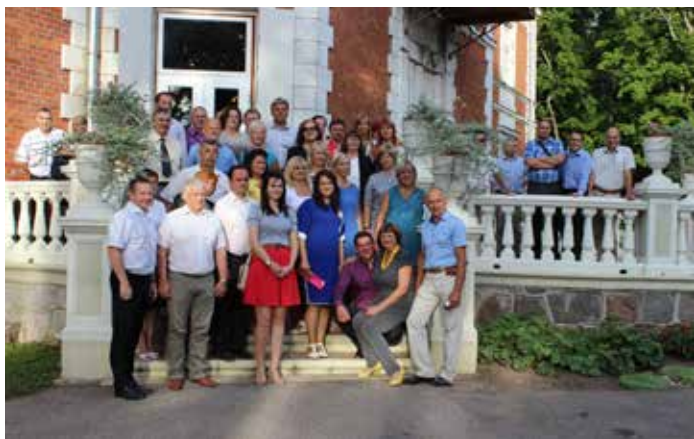
Dienas izskaņā izpilddirektori pulcējās Bebreņē