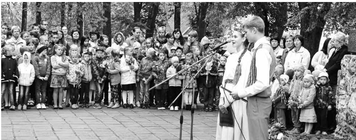
... atvērt dvēseli rudens un dzejas smaržai

ni, attēlojot secīgi dzejoļa notikumus un pārdzīvojumus. Bērni saņēma ne tikai diplomus, bet arī gandarījumu un jaunus iespaidus par dzejnieku Raini.” *