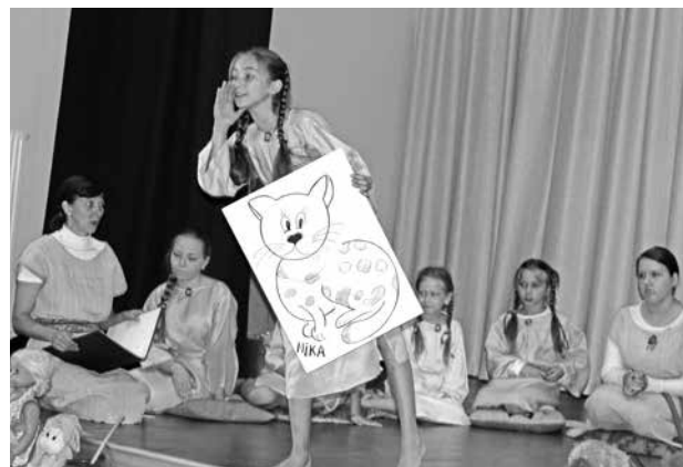
Ar Subates KN iniciatīvu tika realizēts projekts „Rainis-Dzeja-Bērni”