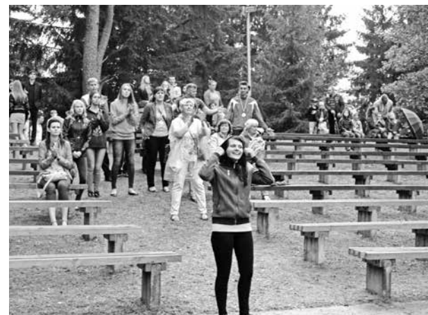
Vakara programma tika aizvadīta Mīlestības salīnā, kur uzstājās arī jaunās grupas no Ilūkstes novada

Par cik šāda veida pasākums tiek plānots kā ikgadējs notikums ir vēlējums mācīties no kļūdām un organizēt kvalitatīvu pasākumu, nodrošinot daudzveidību un radot atmosfēru. Nākošgad Sēlijas jauniešus savās mājās uzņems Nereta, kas tika noteikts ar izlozes palīdzību. Bet viennozīmīgi var apgalvot, ka šāda veida pasākumi var sniegt lielu prieku, saliedēt jauniešus, kā arī kļūt par norisi, kas jauniešos rada izpratni par savu novadu, saknēm un dzimtās puses īpašo garšu.