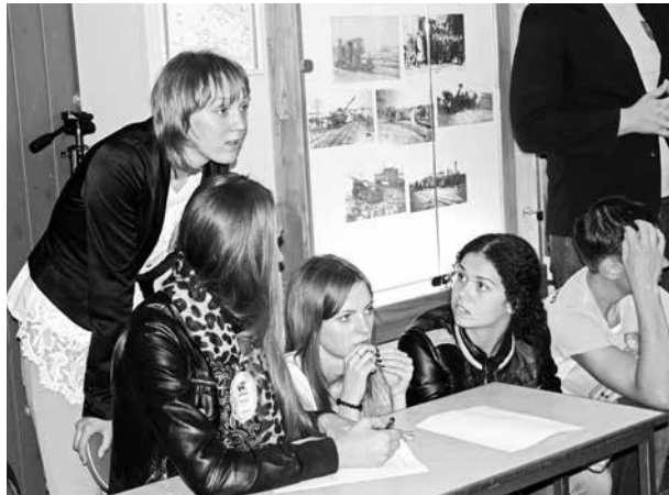
Dienas gaitā sportu nomainīja intelektuālas, radošas un izklaidējošas nodarbes. Erudīcijas konkursā V.I.P. Ilūkstes novada komanda izcīnīja 2.vietu