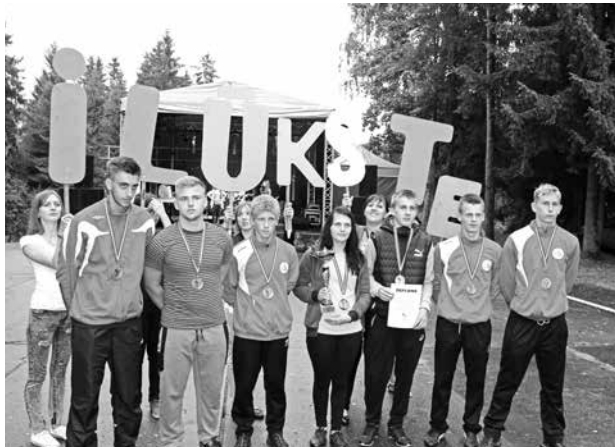
Ilūkstes novada jauniešu komanda futbolā sacensībās izcīnīja uzvaru

„Sēlijā ir manas mājas, mana ģimene, mana skola, mani draugi...te sākas mans ceļš.” Ar šādiem vārdiem 28.augustā Viesītē tika atklāta pirmā „Sēlijas novadu jauniešu diena” ar nosaukumu „Dzimis Sēlijā”. Pasākumā dalību ņēma visi Sēlijas novadu apvienības novadi - Salas, Jēkabpils, Viesītes, Neretas, Aknīstes, Jaunjelgavas un Ilūkstes novads. Pasākuma gaita tika iedalīta trīs posmos, pirmā tika veltīta sportam, otrajā daļā rosība sākās tematiskajos aktivitāšu punktos, kā arī notika pasākuma svinīgā atklāšana ar svētku uzrunām no organizatoriem un novadu pārstāvjiem, bet trešajā daļā tika sumināti pasākuma laureāti un jaunieši liksmoja koncertā.