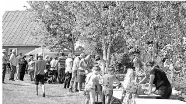
Visu dienu bija iespēja iesaistīties radošajās darbnīcās, vakara noslēgumā – koncerts, brīvdabas kinoizrāde un zaļumballe