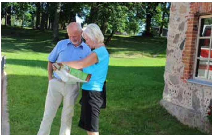
...ieapazīstoties ar Ilūkstes novadu