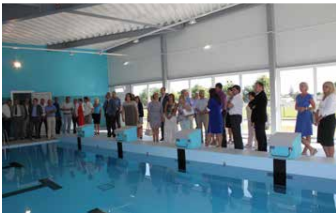
Izpilddirektorus pārsteidza jaunizveidotais Sporta skolas centra baseins, atzīstot to par veiksmīgi izveidotu sporta kompleksu