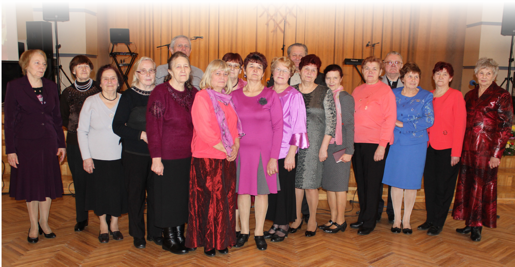
Pensionāru biedrības padome turpmākajiem trīs gadiem