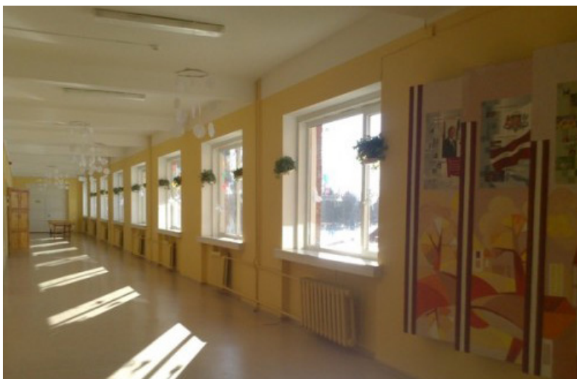
Raudas internātpamatskolā notiek gan internāta nodarbības, gan mācību process, gan bērniem ir iespēja pavadīt brīvo laiku