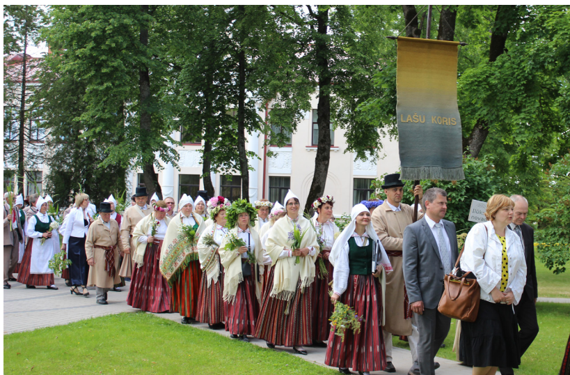
Novada lepnums „Lašu koris”. Fotografija uzņemta no svētku gājiena pasākumā „Sēlija Rotā”, kas notika pagājušā gada vasarā Jaunjelgavā

Šēderes pagasta teritorija izveidojusies padomju laikā. Literatūrā var rast faktus, ka pagasta veidošanās sākumposms saistāms ar Lašu ciemu, ko 1945.gadā izveidoja Lašu pagastā, bet 1949.gadā to likvidēja. 1954.gadā Lašu ciemam pievienoja Gorbunovkas ciema Kirova kolhoza teritoriju, 1962.gadā – Raudas ciemu. 1990.gadā Lašu ciema teritorijā nodibināts Lašu pagasts. Administratīvi teritoriālo pārkārtojumu laikā Šēderes pagastā iekļauta bijušā Lašu pagasta DA daļa, gadrīz viss bijušais Raudas pagasts, bijušā Sventes pagasta DR mala un neliela daļa no bijušā Pilskalnes pagasta. 1991.gadā Lašu pagasts tika pārdēvēts par Šēderes pagastu. Šobrīd lielākās apdzīvotās vietas pagastā ir Šēdere, Pašulīene un Rauda. Pagasta kopējā platība – 11459 hektāri.