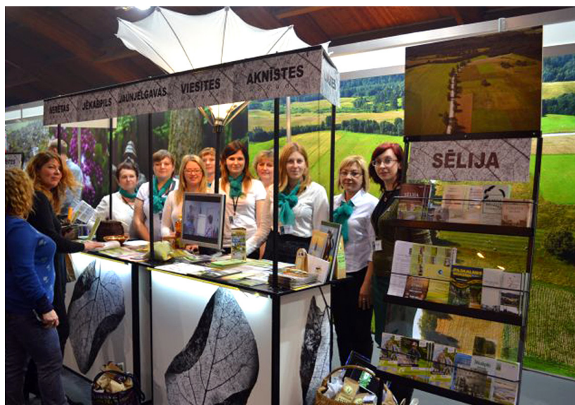
Sēlijas stendā īpašu atzinību guva Ilūkstes novada uzņēmēju un mājražotāju veikums

No 5. līdz 7. februārim Rīgā, izstāžu centrā „Ķīpsala” tika aizvadīta 23. Baltijas starptautiskā tūrisma izstāde - gatatirgus „Balt-tour 2016”. Tajā piedalījās arī Ilūkstes novada pārstāvji, kuri kopā ar piecu citu Sēlijas novadu pārstāvjiem darbojās Zemgales reģiona Sēlijas pudurī.