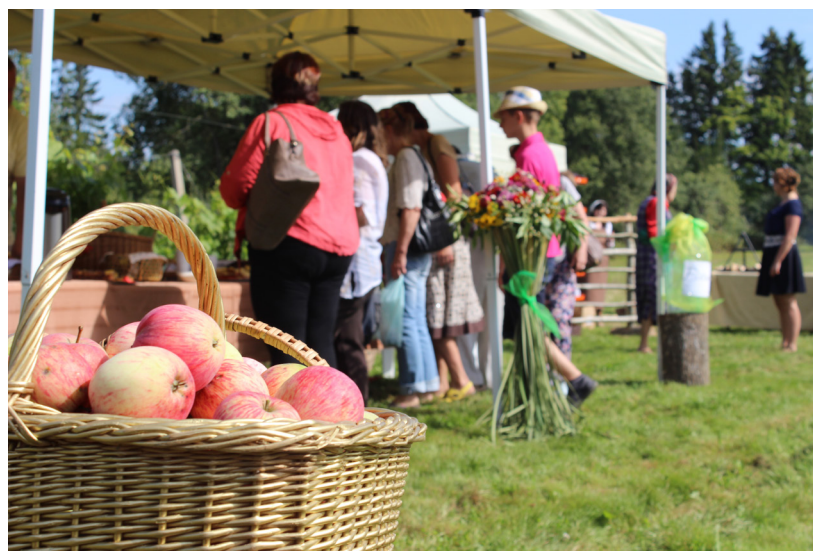
Foto no pasākuma Dvietes pagasta „Apsītēs”, kad tika aizvadīti Latvijas vīnkopju - vīndaru svētki