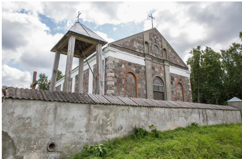
Klusā un nomalā Latvijas nostūrī Dievs ir izvēlējies vietu Grendzes Svētā Pētera Romas katoļu baznīcai, kas celta 1907.gadā no laukakmeņiem