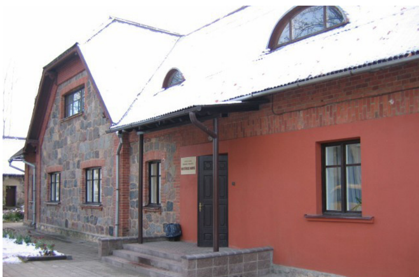
Arhitektūras pieminekļi Šēderē – Grendzes baznīca, bijušās Lašu skolas ēka (attēlā redzamā) tagad te atrodas kultūras nams un bibliotēka un Raudas internātpamatskola