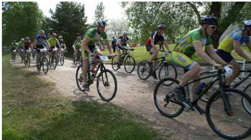
Šogad sacensībās piedalījās un finišu sasniedza 131 dalībnieki, kuri pārstāvēja daudzus Latvijas novadus un pilsētas, bija arī dalībnieki no Lietuvas un Krievijas