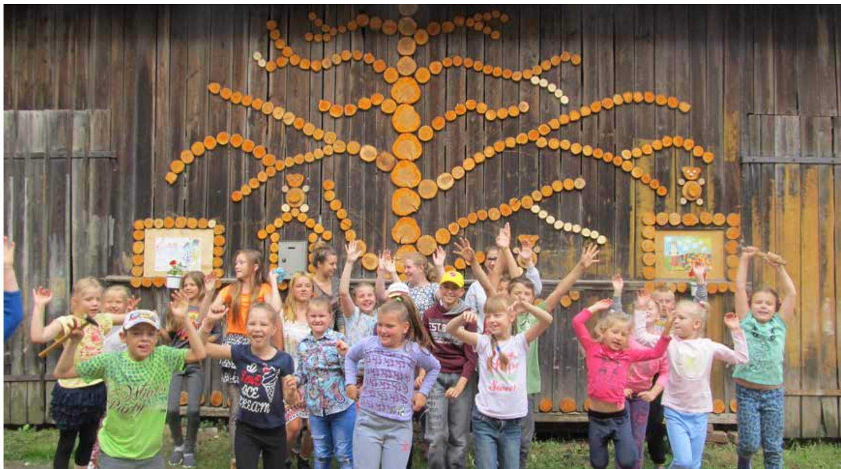
Nometnē "Ziņkārīgā vārņa" bērniem bija iespēja iesaistīties kā radošās tā sportiskās aktivitātēs

Ilūkstes novada pašvaldības izglītības speciāliste