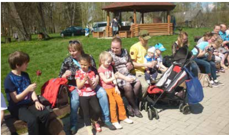
Dvietes pagasta Muižas parkā 4.maijā Ilūkstes novada audžuģimenes pulcināja kopā visa Latgales reģiona audžu ģimenes

Latgales reģiona audžu ģimenes 4.maijā pulcējās Dvietes pagasta Muižas parkā. Ciemiņu vidū bija Liksnas, Vaboles, Kalupes, Rēzeknes, Daugavpils, Medumu, Kumbuļu, Demenes ģimenes ar bērniem un viņu atbalstītāji – audžuģimeņu biedrība „Terēze” no Rīgas, Ilūkstes novada un Daugavpils bāriņtiesu pārstāvji.