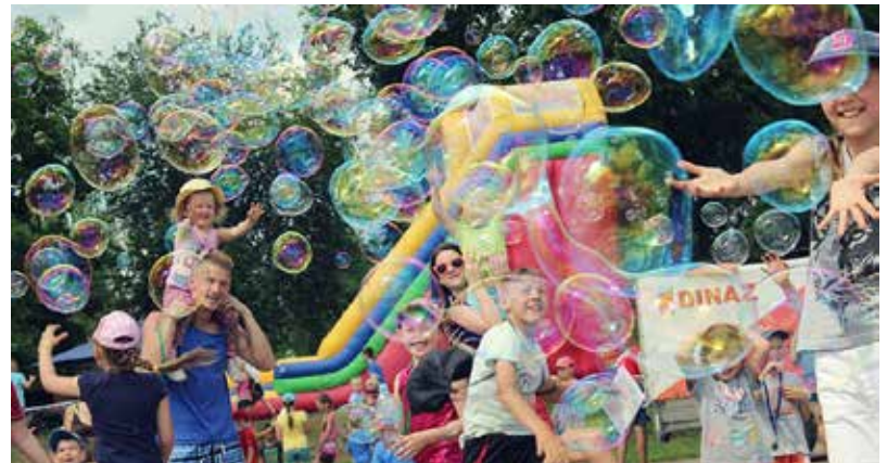
Starptautiskās bērnu aizsardzības dienas ietvaros, Ilūkstes pilsētas stadionā norisinājās Ilūkstes novada Bērnu diena – riteņbraukšanas sacensības