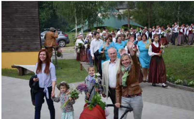
Sēlijas reģiona mazie Dziesmu un Deju svētki šogad notika Aknīstē

„Sēlija Rotā” ir sēļu aktīvo tautas mākslas kolektīvu kopā sanākšanas svētki, tie ir kā Sēlijas reģiona mazie Dziesmu un Deju svētki. Šogad svētki notika 18.jūnijā, Aknīstē, vienkopus pulcējot 23 deju kolektīvus un 30 dziedošos kolektīvus, tajā skaitā korus, ansambļus, folkloras kopas.