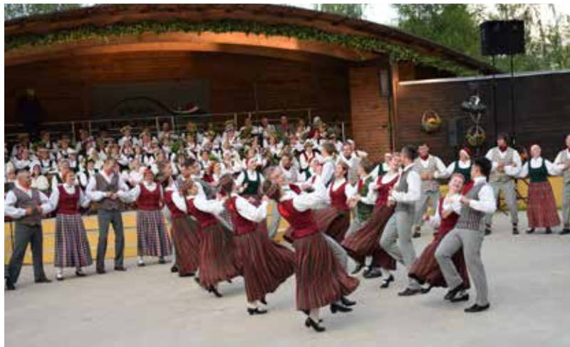
Paldies ikvienam, kurš šajos svētkos nesa Ilūkstes novada vārdu!