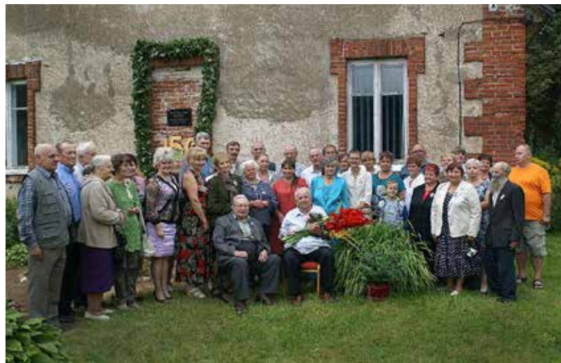
Atzīmējot skolas 150 gadu