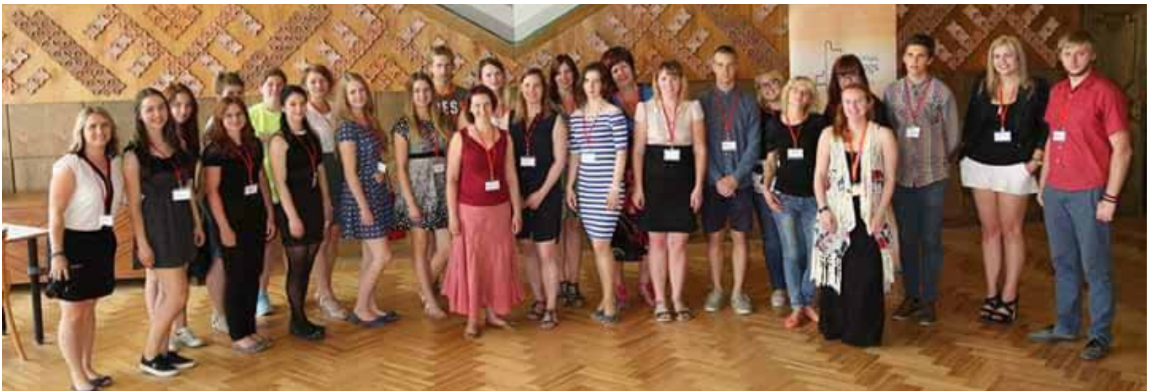
Šovasar jaunieši piedalījās Sēlijas apvienības kongresā, kur tika izveidota Sēlijas novadu apvienības Jauniešu padome "SēJa" – Sēlijas Jaunieši