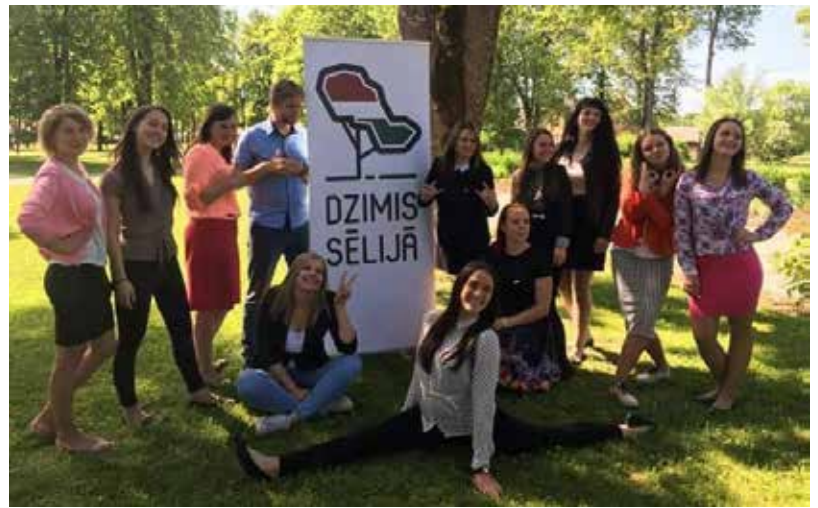
Vasaras noslēgumā 20.-21.augustā notika Sēlijas novadu jauniešu dienas

Visu vasaru jauniešiem notiek sapulces Ilūkstes Bērnu un jauniešu centrā . Šajās sapulcēs tiek izrunātas aktuālās tēmas. Bieži vien sapulcēs rodas idejas par labu darbu darīšanu. Kādā no sapulcēm radās ideja, ka vajadzēt sakopt no Ilūkstes pilsētas netālu esošo ezera krastu. Tad nu devāmie un grābām sienu, vācām atkritumus, izplā-