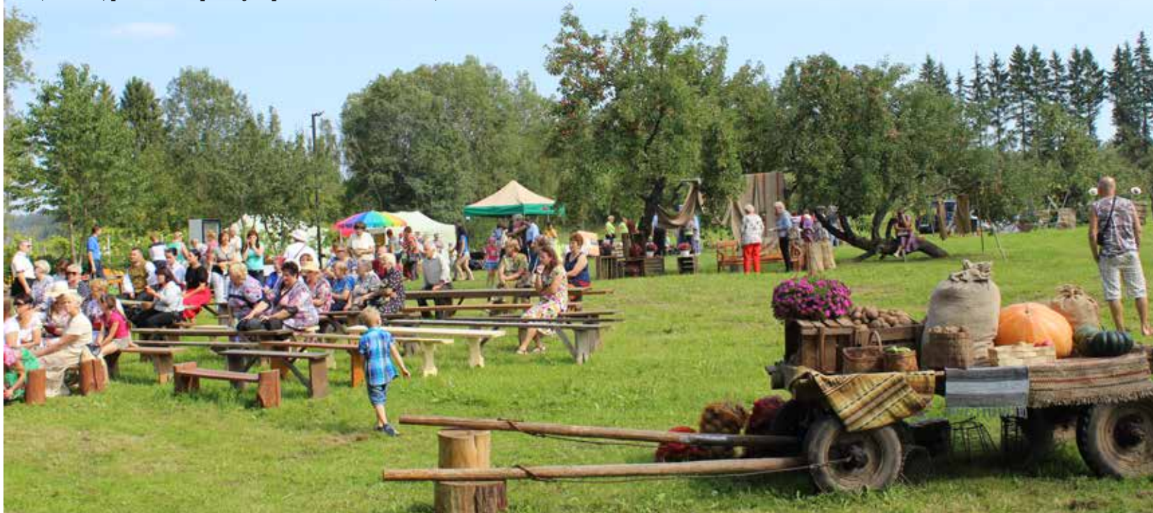
20.augustā Paula Sukatnieka dārzā, pasākumā „Kartupelis, tomāts - baro, dziedē, pārsteidz” pulcējās ap 500 interesentiem