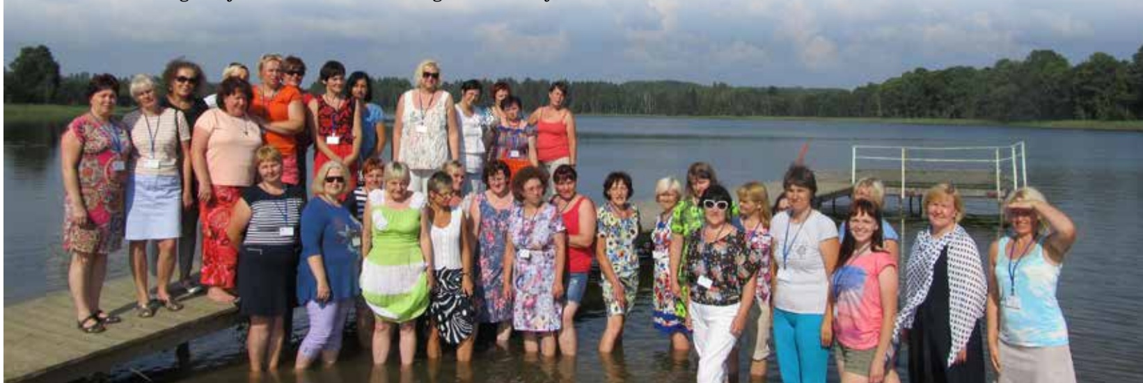
Sēlijas novadu latviešu valodas un literatūras skolotāju radošā nometne „Sēlijas vasara 2016.” darbojās no 25. līdz 28.jūlijam Ilūkstes novadā, viesu namā “Saliņas”