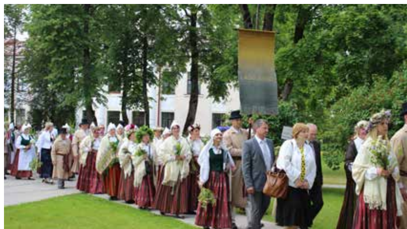
Aicinām papildināt LAŠU kora dziedātāju rindas