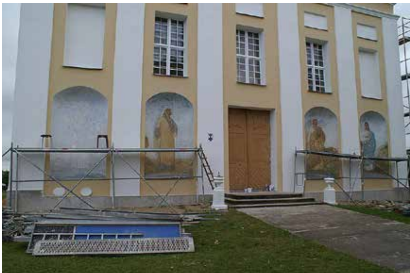
Notiek Bebrenes Romas katoļu baznīcas svēto gleznojumu atjaunošana

● Bebrenes Romas katoļu baznīcai ir atjaunots ār sienu krāsojums un šobrīd notiek svēto gleznojumu atjaunošana.