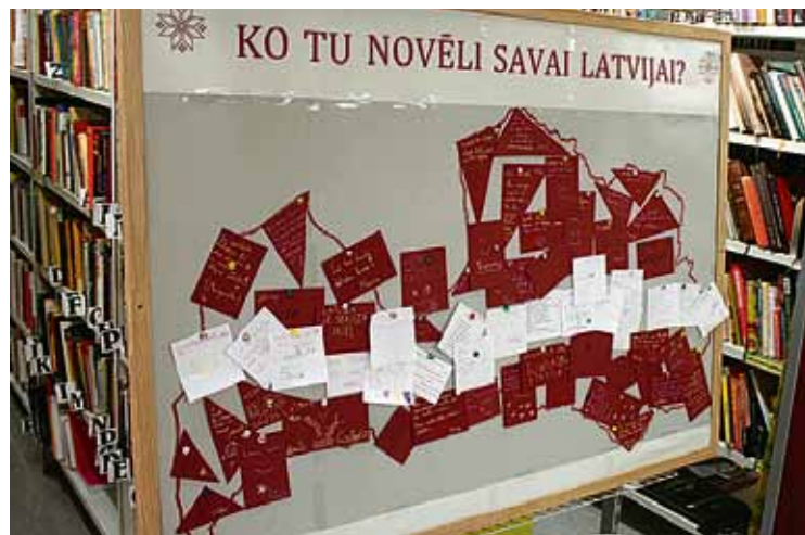
Pie speciāli izveidotas Latvijas kartes bibliotēkā ikviens varēja uzrakstīt savu novēlējumu Latvijai 98. dzimšanas dienā.