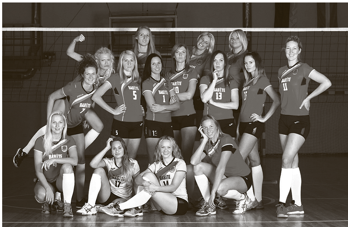
SK „Babīte” volejbolistes pēc izcīnītās uzvaras pār „Jelgava/LU” komandu 12. novembrī Piņķos.