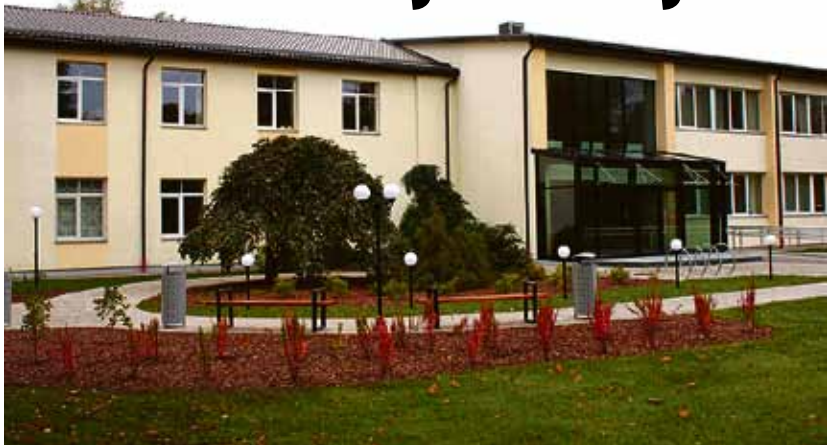
Pašvaldības administrācijas ēka pēc rekonstrukcijas 2016. gada oktobrī.