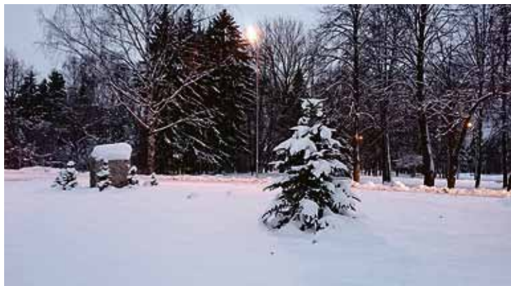
Babītes eglīte kuplos arvien krāšņāk un ik gada nogali tērpsies svētku rotā.

Tuvojoties Ziemassvētkiem, Babītē pie dzelzeļa stacijas un Spuņciemā skolas pagalmā oktobrī iestādītas egles, kas ne tikai papildinās apkārtējo vidi, bet, tērpus svētku rotā, katru gadu arvien kuplākas priecēs garāmgājējus Ziemassvētku laikā.