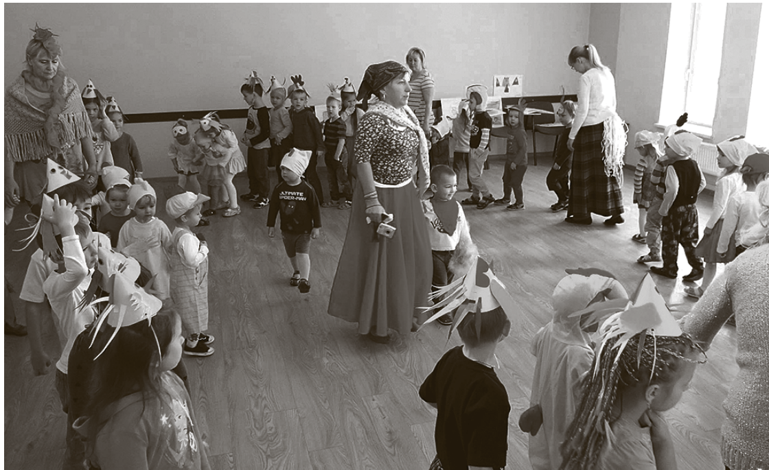
Salas sākumskolā audzēkņi izzina Mārtiņdienas tradīcijas.

Tradīciju nostiprināšana un latviskuma saglabāšana ir viens no Babītes novada pašvaldības Salas sākumskolas mērķiem, skolojot savus audzēkņus. Arī šogad, tāpat kā citus gadus, atzīmējam Mārtiņus, ievērojot gan klasiskās tradīcijas, gan ieviešot svētkos ko jaunu.