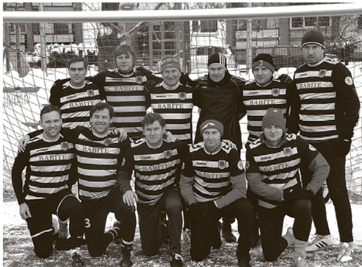
Eiropas veterānu futbola čempionāta otrā posma uzvarētāji – SK „Babīte” komanda.