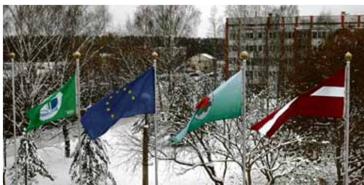
Babītes vidusskolas karogu mastus papildina Ekoskolu programmas Zaļais karogs.

Mūsu mācību iestādē izbaudījām arī Dzejas mēnesi, kas šogad bija veltīts Aleksandra Čaka 115