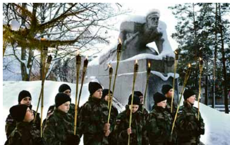
Lāčplēša dienā pie Piņķu kaujai veltītā pieminekļa notika piemiņas brīdis.