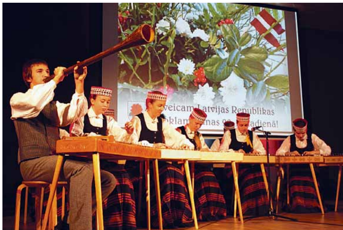
Babītes novada koklētāju ansamblis „Balti” valsts svētku koncertā Piņķos.

Par godu valsts svētkiem Babītes novada pašvaldības iestādes organizēja gan publiskus pasākumus, gan rūpējās par bērnu patriotisko audzināšanu izglītības iestādēs.