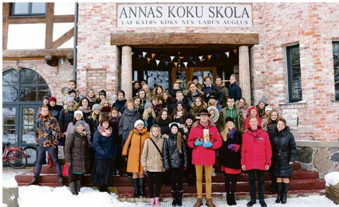
Babītes vidusskolas Ekopadome kopā ar vieskolām ciemojas Annas koku skolā.

Jā, tieši šādi nosaucām ikgadējo rudens tirdziņu, kas norisinājās Babītes vidusskolā, sniedzot iespēju sākumskolas audzēkņiem, radoši darbojoties, sagatavot savu produkciju pārdošanai.