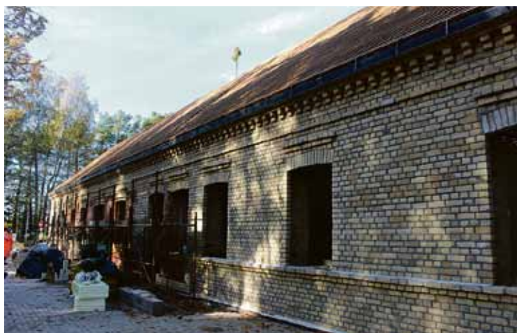
„Vietvalžos” 18. oktobrī notika spāru svētki topošajam Kultūrizglītības centram.

18. oktobrī Babītes novada Salas pagasta „Vietvalžos” notika spāru svētki – pa-beigta jumta konstrukcija bijušajai Salas pagastmājas ēkai, kur renovētās un mūsdienīgās telpās nākamā gada vasarā mājvietu radīs jau otrais Kultūrizglītības centrs novadā. Topošais Kultūrizglītības centrs būs nozīmīgs notikums Babītes novada Salas pagastā – kā dāvana sabiedrībai Latvijas valsts simtgadē.