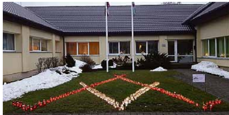
Lai radītu svētku noskaņu, PII „Saimīte” pagalmā rotā no svečiem izveidots Austras koks.

gums un īpašs sveiciens novada iedzīvotājiem un viesiem Latvijas dzimšanas dienā svētku pasākumos bija filmas par Babītes novadu pirmizrāde. Filmā stāstam par novadam nozīmīgākajiem projektiem, kas paveikti šogad, atskatāmies uz pasākumiem, rā-