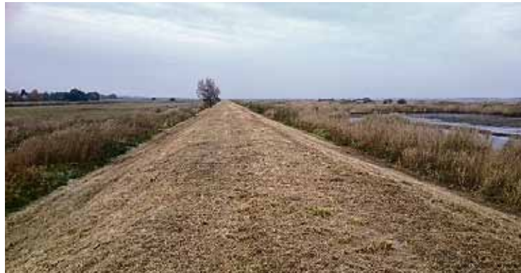
Sakoptais Dzilnupes aizsargdambis.

Oktobrī noslēgušies Babītes pagasta Babītes, Dzilnupes un Trenču polderu aizsargdambju rekultivēšana un zāles pļaušana, sakopjot to teritorijas un padarot izmantojamus gājēju un velosipēdistu vajadzībām.