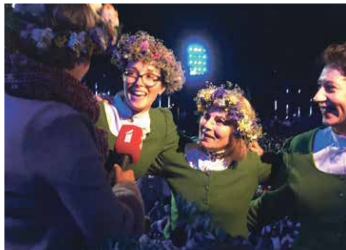
Maza, emocionāla intervija burvīgajos Dziesmu svētkos 2018. gadā.

– Vismīļākās sajūtas ir ballēs, kad tu atver zāles durvis un nav pat vietniņas, jo visi deju slāpjam mugurām. Ejot prom, apmeklētāji saka: „Cik forši! Lai vēl būtu tādas balles!” Vietējie iedzīvotāji ļoti aktīvi izpirka biļetes un rezervēja galdziņus. Es pazinu katru apmeklētāju, zināju, kur un kā sasēdināt kompānijas, lai visiem būtu labi.