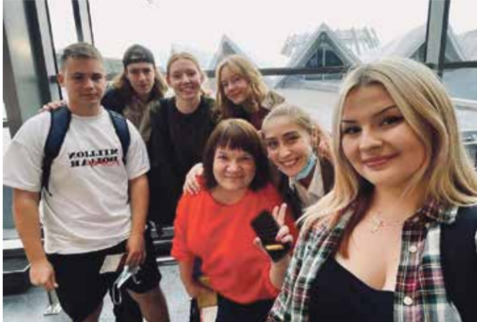
Saulkrastu vidusskolas audzēkņi projekta laikā devās uz Turciju.

● Septembra nogalē Saulkrastu novada vidusskola ar dažādām aktivitātēm iekļāvās Eiropas valodu dienas un Eiropas sporta nedēļas atzīmēšanā. Sadarbībā ar valodu skolotājiem tika izveidotas vairākas spēles par Eiropas valodu daudzveidību un latviešu valodas vietu vietējā un pasaules kontekstā. Izveidots modernais mācību materiāls lieliski noder un papildina mācību procesu. Sadarbībā ar sporta skolotājiem un Saulkrastu sporta un ģimeņu centru 28. un 30. septembris izvērtās par krāsainu Rudens sporta dienu.