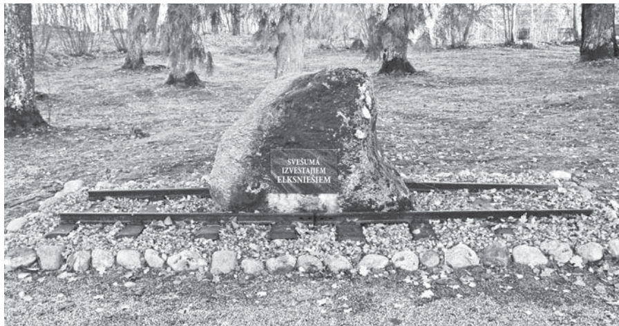
Piemiņas vieta izvestajiem elkšniešiem – sens graudberzis. Izberztā iedobe ir akmens labajā pusē.

Elkšņu graudberzis, kas tātad varētu būt ap 1000 gadus vecs, ir nosacīti sirdsveidīgs, plakanisks, tagad piemiņas vietā nostādīts uz viena sāna. Akmens (ap 1,4 x 1,2 m liels, ap 0,8 m augsts) viena skaldne ir gludi izberzta; izberzums ir ap 0,9 x 0,4 m liels un ap 0,1 – 0,15 m dziļš. Varam tikai minēt, cik gadu, gadu desmitu vai gadu simtu laikā ar otru, mazāku graudberzi varēja izberzt tādu iedobi, pie tam berzējam galvenais bija sasmalcināt graudus un ne izberzt akmeni. Elkšņu akmens savā sākotnējā vietā esot atradies tā, kā būtu jāatrodas apakšējam graudberzim – ar izberzumu uz augšu. Graudberža esamība Elkšņu centrā diezgan noteikti liecina, ka tur