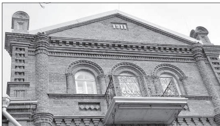
На самом верху — 1911.

На втором этаже Дома Сурмонина располагался молитвенный зал Резекненской баптистской церкви (у нее были приходы в Зелтинях, Липушках и др.). У Резекненской баптистской церкви также был храм на месте бывшего советского книжного магазина «Пионер», но молитвенный зал в Доме