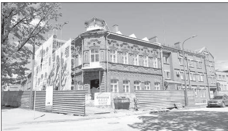
В мае 2020 года.