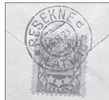
Печать резекненской почты 1928 года.

мецкие марки, доллары, репшики ... После этого в окошко протягивала товар.