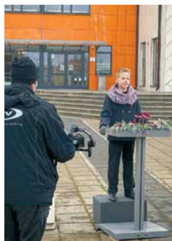
Filmējot runu skolas pagalmā.