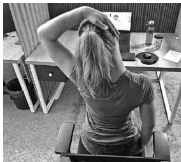
Jāapsēžas un viena roka jānoliek zem kājas, otra uz galvas. Izelpas laikā galva jānolaiž uz augšējās rokas pusi un jātur 30 sekundes. Pēc tam rokas jāsamaina un vingrojums jāizdara uz otru pusi.