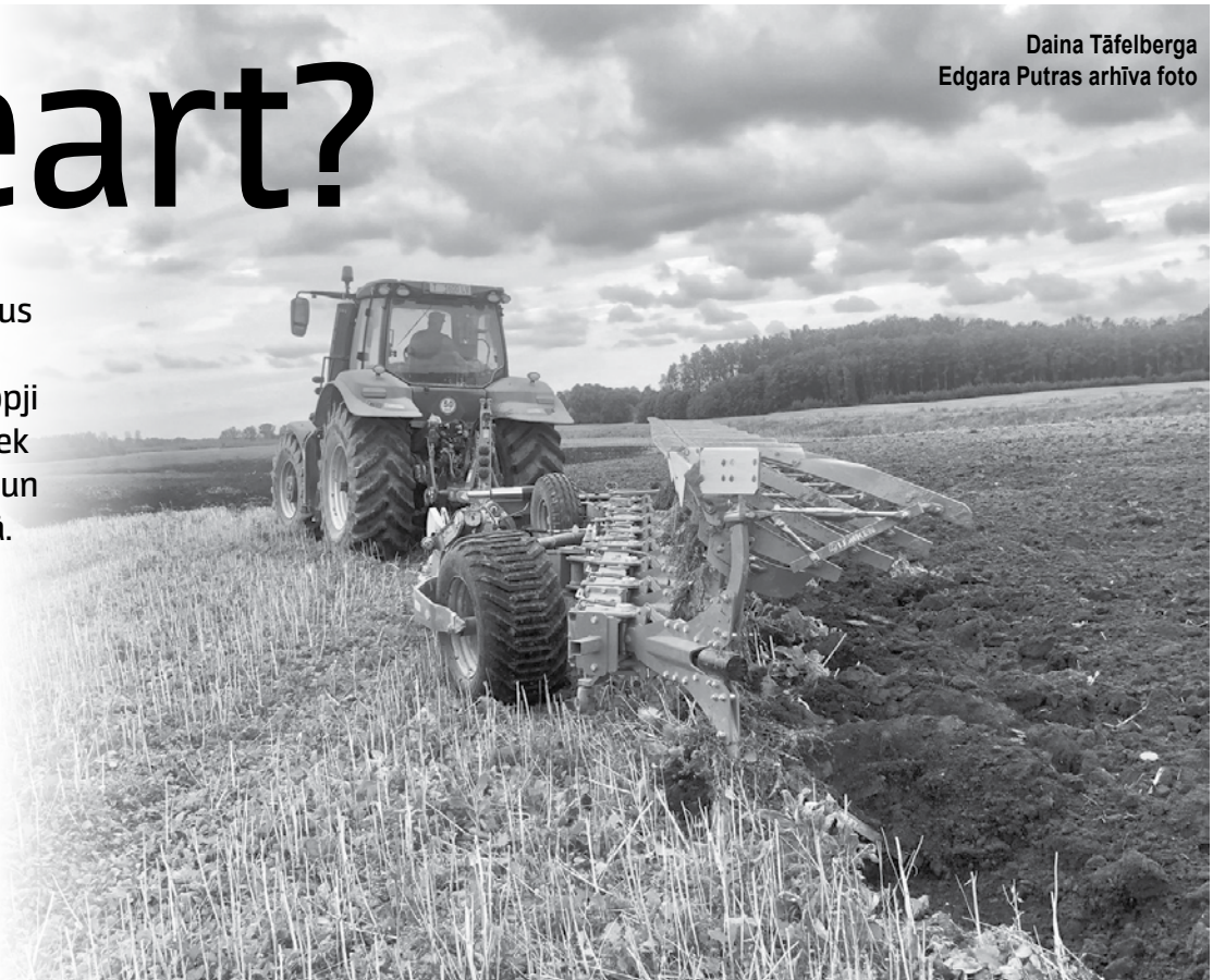
Ar aršanu katrā hektārā ikreiz par pusmetru tiek pārvietots un apvērsts 2000 kubikmetru augsnes.

pirms gadu tūkstošiem, tagad kārtīga zemnieka arsenālā ir moderni arkli, diski, dziļirdinātāji, kultivatori, ecēšas, veltņi, sējmašīnas. Bet pēdējā laikā pasaulē parādījusies tendence iztikt bez aršanas, un tai pievēršusies arī Latvija. Pagaidām pilotprojekta līmenī, lai pierādītu, ka labību un eļļas augus var sēt un labus rezultātus gūt, zemi iepriekš neaparot. Un tas ir gan ekoloģisks, gan ekonomisks ieguvums.