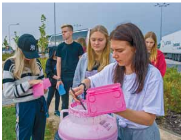
Braucot cauri Polijai, pusdienas un vakariņas jau bija sagatavotas. Trauciņos tiek lieta aukstā zupa.