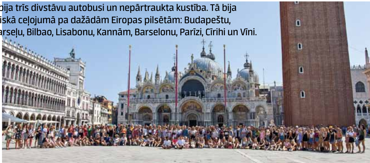
250 Latvijas jauniešu Venēcijā, Svētā Marka laukumā. Visiem sastājoties kopā, sapratu, cik daudz tomēr esam.