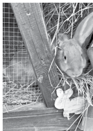
Lindai ir sapnis izveidot minizoodārzu.