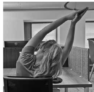
Sēdus jāpaceļ rokas virs galvas un izelpā jānoliecas uz vienu pusi, gurnus neatceļot no krēsla. Vingrojums jāizdara uz abām pusēm un lēni desmit reizes.