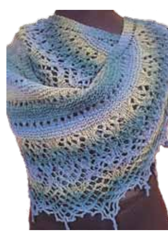
Sieviešu lakats ar pērlītēm.