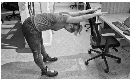
Stāvot kājās, jāpieturas pie krēsla, jānoliecas uz priekšu un jāatbrīvojas. Šādā pozā jāpaliek vismaz 30 sekundes.