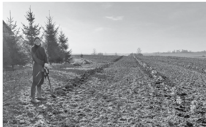
Topošā upenu plantācija.

par pirmsskolas skolotāju. Vēlāk iemācījos šūt un kādu laiku šuvu tilla svārkus. Bet pēc tam tomēr izdomāju, ka gribu vingrot.