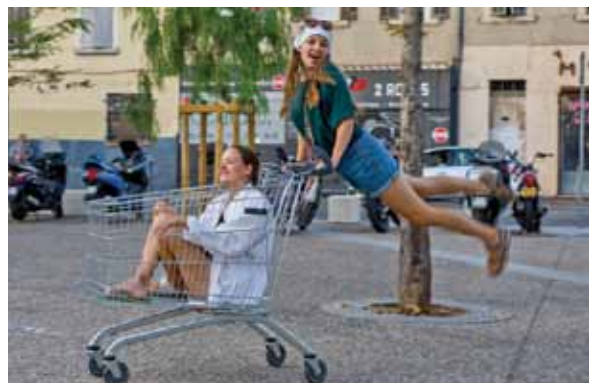
Gaidot vakariņas Marseļā, jaunieši atrod jaunas iespējas, kā sevi izklaidēt.

Viens no iemesliem, kādēļ devos šajā piedzīvojumā, bija piepildīt senu sapni un apskatīt Eifeļa torni. Parīzē gribu atgriezties, jo palika vēl tik daudz, ko iepazīt.