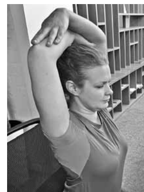
Rokas jānoliek nabas augstumā, ar plaukstām jāapķer elkoņi, un saliktās rokas lēni jāpaceļ augšā, pēc tam jālaiž lejā. Vingrojums jāatkārto desmit reizes.