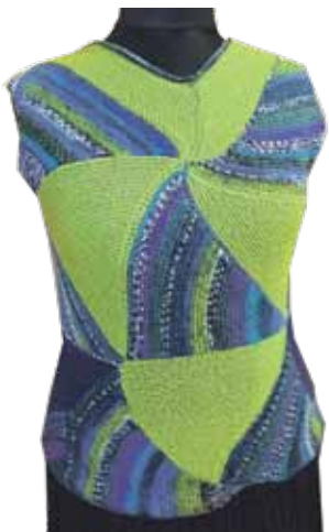
Šigada aktualitāte – adītas vestes.