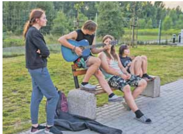
Kāds uzņēmīgs jauniešis paņēmis līdzi ģitāru, un dažkārt kopā padziedājām.

20 dienas augustā 250 jauniešiem mājas bija trīs divstāvu autobusi un nepārtraukta kustība. Tā bija iespēja jauniešiem no 13 līdz 30 doties lieliskā ceļojumā pa dažādām Eiropas pilsētām: Budapeštu, Zagrebu, Splitu, Venēciju, Romu, Milānu, Marseļu, Bilbao, Lisabonu, Kannām, Barselonu, Parīzi, Ārihi un Vīni.