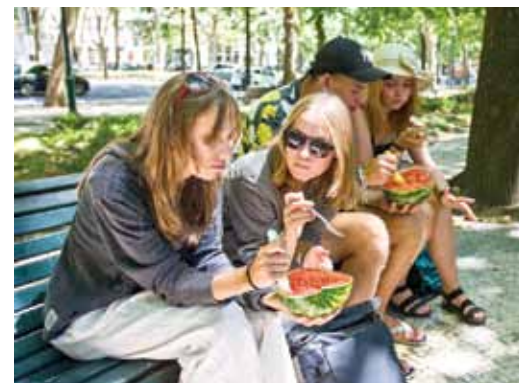
Lisabonā sēdējām pretī piecvaigžņu viesnīcām un ēdām arbūzu, kas sadalīts ar šķērēm.