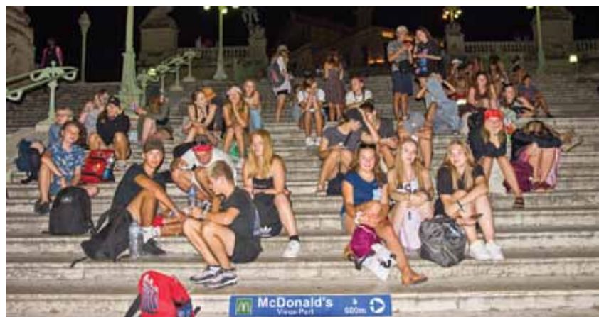
Marseļā pēc garas dienas netālu no stacijas gaidām autobusus, lai dotos tālāk.