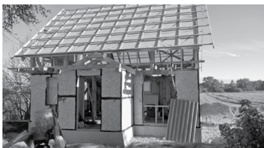
Rit mājas celtniecība.