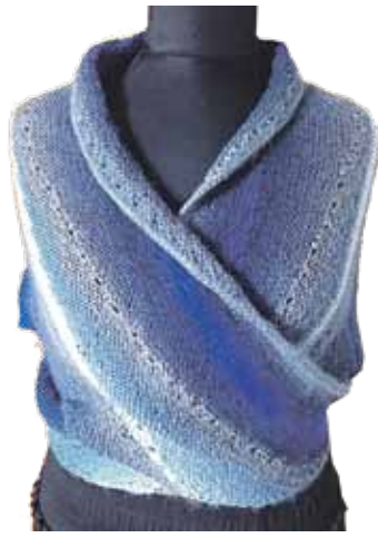
Pēdējā laikā uzadītais lakats.