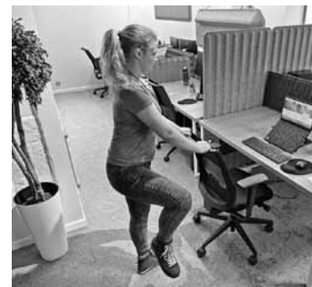
Jāpieceļas un stāvus, pieturoties pie krēsla, katrā kājā jāizapļo piecas reizes uz katru pusi.