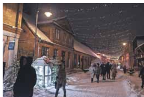
Diezgan daudz cilvēku, izbaudot ziemas vakarus, dodas pastaigā pa izgaismoto pilsētu.