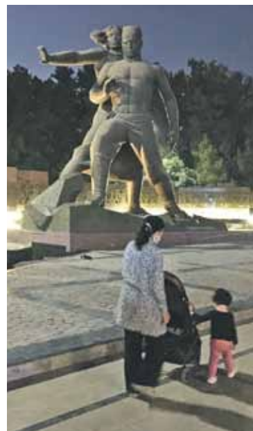
Iespaidīgs monuments 1966. gada 26. aprīļa Taškentas zemestrīces upuriem.