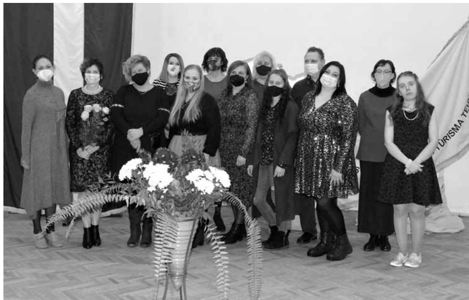
Kuldīgas Tehnoloģiju un tūrisma tehnikumā pusotra gada programmu apguvuši 12 pārtikas ražošanas tehniķi.

Pirmo reizi Kuldīgas Tehnoloģiju un tūrisma tehnikumā mācības pabeigusi grupa, kas apguvusi programmu Pārtikas produktu tehnoloģija , iegūstot pārtikas ražošanas tehniķa kvalifikāciju.