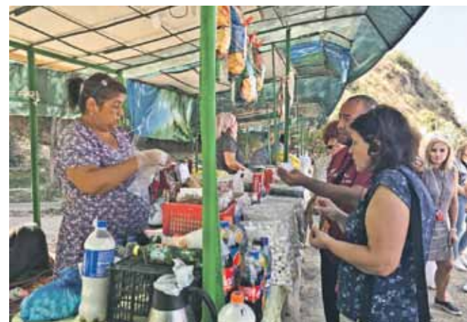
Pirmā sastapšanās ar tirgotājiem ceļa malā.