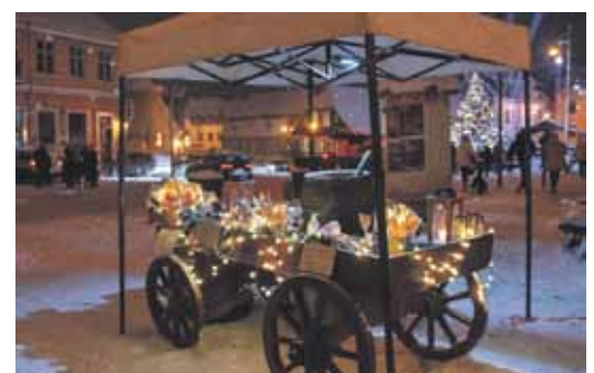
Dažviet Liepājas ielā darbojas mājražotāji, piedāvājot uzkodas un siltos dzērienus.

Liepājas ielā – lieli lukturi ar Ziemassvētku ainiņām un vēlējumiem. Semināra parkā noskaņu palīdz radīt izgaismoti vārti un eņģeļi, baltas meža ainas ir Pilsētas dārzā. Ar sarkanām lentēm pie laternām rotāts ķieģeļu tilts pār Ven-