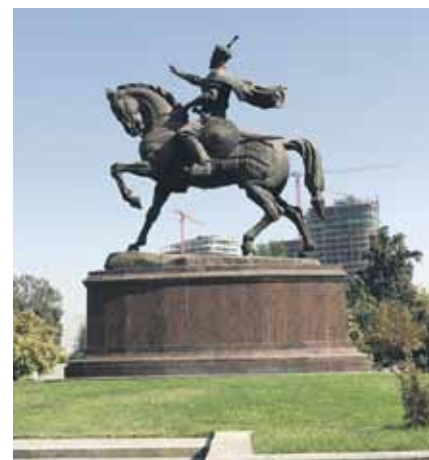
Pieminekļis Timuram, slavenajam uzbeku valdniekam un karavadonim.