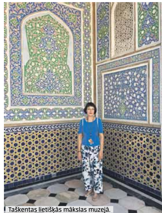
Taškentas lietišķās mākslas muzejā.