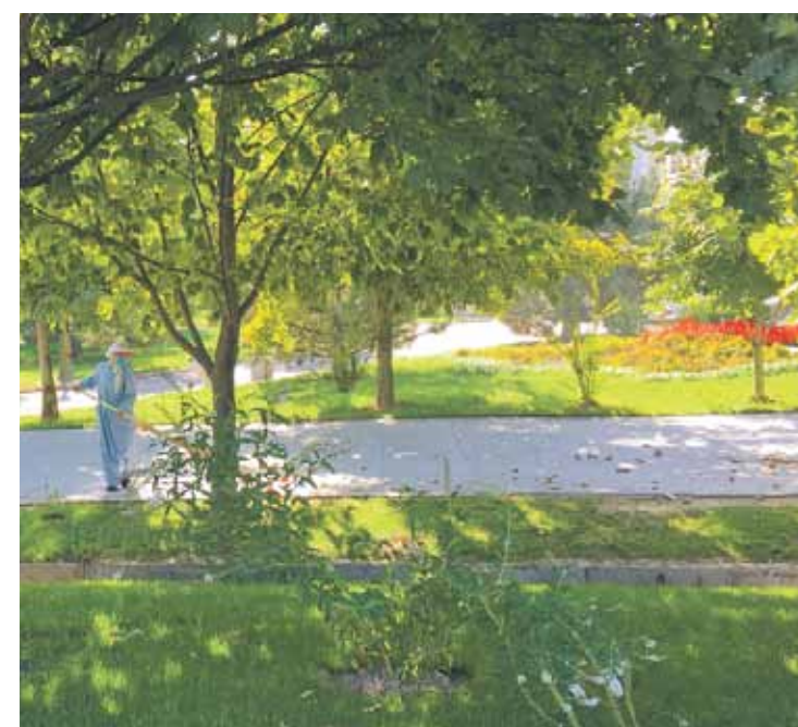
Sestdienas rītā parkā tikai sētnieki.

200 dolāriem – laikam iedomājoties, ka te esot ne kāda Dubaja! Kontrasti tāpat kā pilsētā: gan spoji žums un grandiozas ēkas, un lepnas mašīnas, gan nabadzība un nefīrība. Jā, Taškenta atstāj diezgan vienaldzīgu (cik nu vienā dienā pagūstam redzēt), taču daba gan aizrauj. Uz-