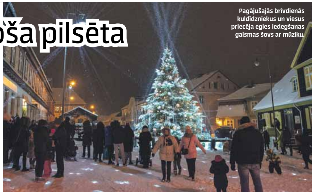
Pagājušajās brīvdienās kuldīdzniekus un viesus priecēja egles iedegšanas gaismas šovs ar mūziku.