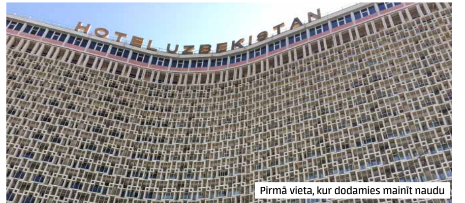
Pirmā vieta, kur dodamies mainīt naudu