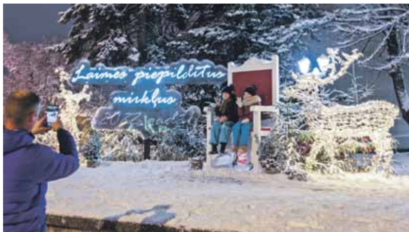
Ģimenēm iecienīts pieturas punkts ir Pilsētas laukuma fotostūris.