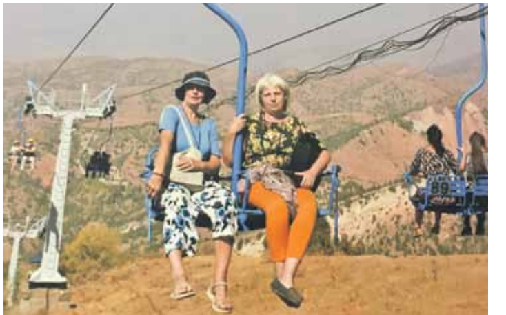
Brauciens ar pacelāju līdz Beldersajas kalnu kūrortam.