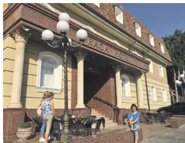
Mūsu viesnīca. Jau no paša rīta 30 grādu.