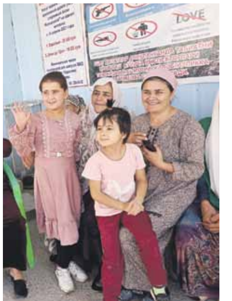
Uzbekietes ir laipnas un draudzīgas. Grib nobildēties ar mums. Un labprāt pozē mūsu fotogrāfiem.