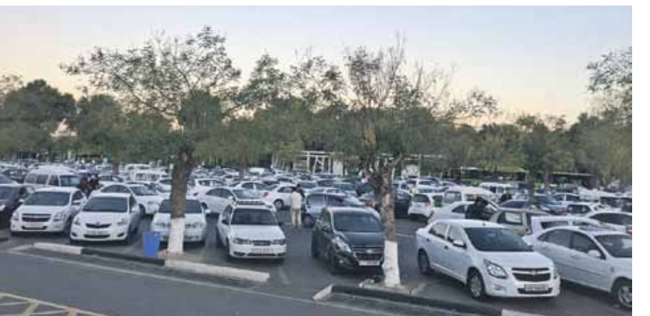
Ielās pārsvarā baltas automašīnas.

vizinājušās vairākas manas paziņas!) Pretī braucošie pāri visbiežāk sveicina – smaidīgi māj uzbekietes lielos lakatos, aturīgāki vai nopietnāki ir vīrieši un tūristi.