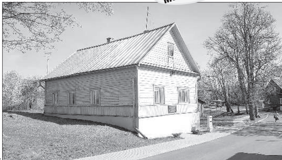
Дом Заволок на улице Сеницина.