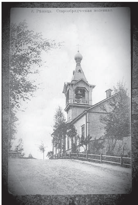
Резекненская моленная в начале 20-го века.