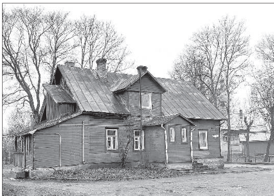
Дом на улице Сеницина, 1.