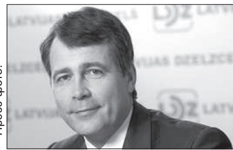
Экс-глава «Latvijas Dzelzceļš» Угис Магонис.

Он, ознакомившись с материалами дела, считает, что изменение обвинения делает обвинение «более ясным и более точным».