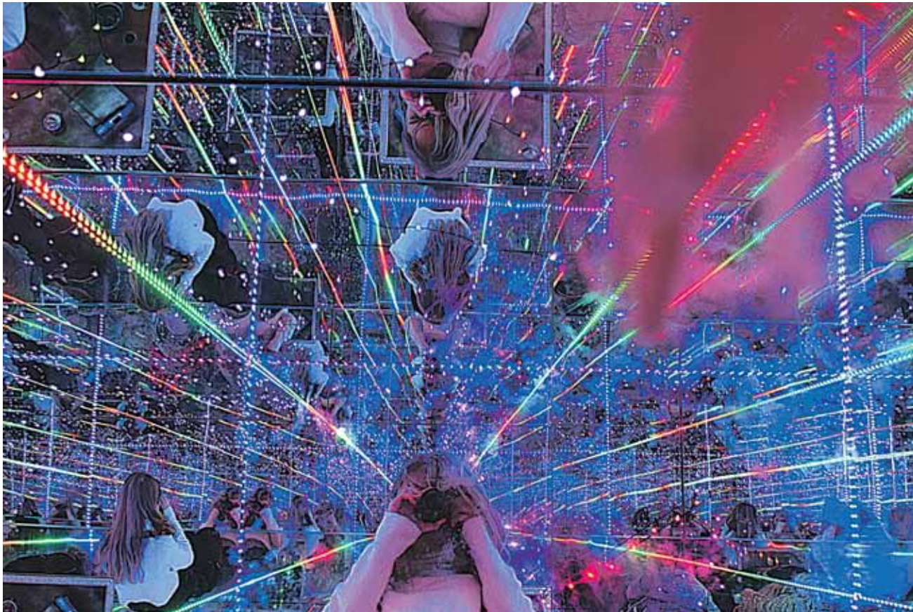
Visumnīcas gaismas kubs ļauj izdzīvot trīs stāstus: diskotēku, kaut ko romantisku un dumpošanas pret likteni.

Rīt, 11. decembrī, no 10.00 līdz 17.00 Kuldīgas vieglatlētikas manžā atkal būs izbraukuma vakcinācija pret Covid-19, nodrošinot gan pirmo, gan otro potes devu, pēc pieprasījuma arī balstvakcināciju.