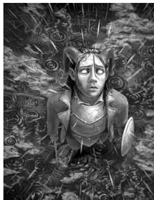
Kates veidotie grafiskie fantāzijas tēli.

Kates radītos tēlus var apskatīt vietnē Artstation.com/virensere . Šogad viņa piedalījās akcijā Draw October , katru dienu oktobrī vienu savu tēlu instagrama kontā ievietojot ar mirkļbirku #Drawtober .