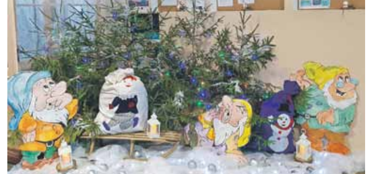
Gaidot gada gaišākos svētkus – Ziemassvētkus, rotājušies arī Vārmes pamatskola.

Šonedēļ Vārmes pamatskolā notika Ziemassvētku dziesmu maratons, un bērni gatavoja apdāvināt pagasta vecākos ļaudis.