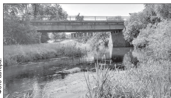
Вид со стороны городища.