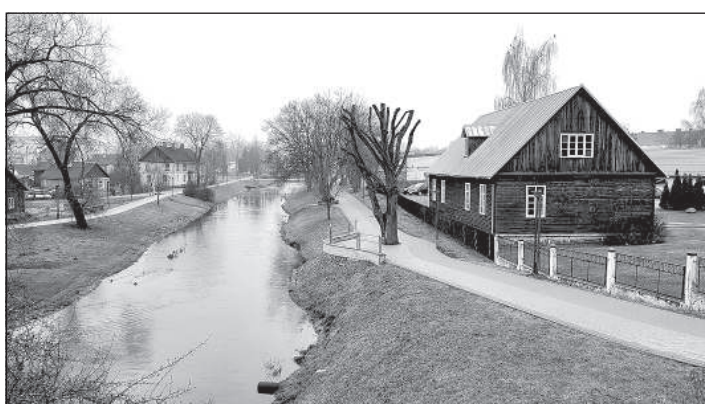
С правой стороны — так называемый дом Пурвитиса (2020).

После войны у подножия моста на улице Дарзу, со стороны рынка, была сна-