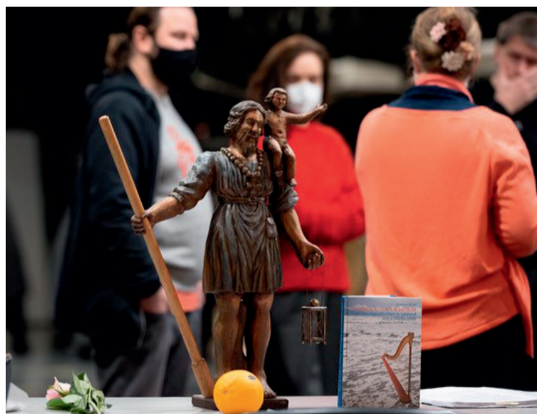
Skats no izrādes tapšanas gaitas