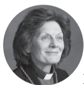
LAUMA ZUŠĒVICA, Latvijas evaņģēliski luteriskās Baznīcas pasaulē archibīskape