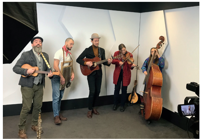
Mūzicē folkgrupa "Rahu the fool"

1. Latvijas valsts drošības sargāšana un stiprināšana