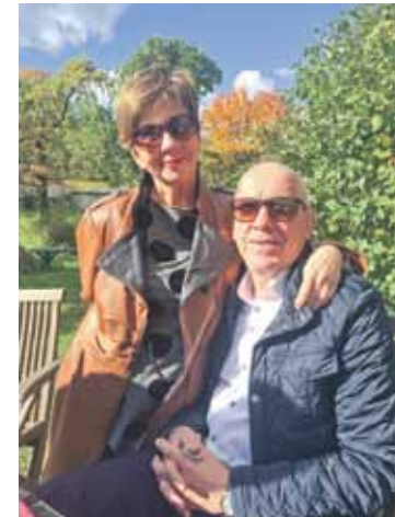
2016. gadā 60. jubilejā kopā ar sievu Anitu.