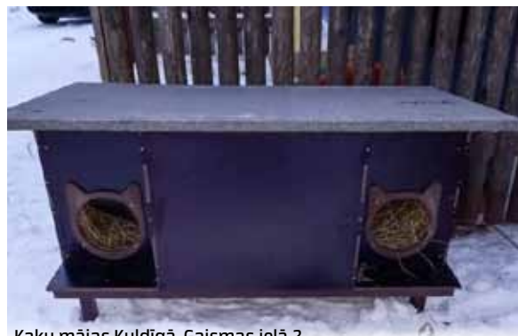
Kaķu mājas Kuldīgā, Gaismas ielā 2.