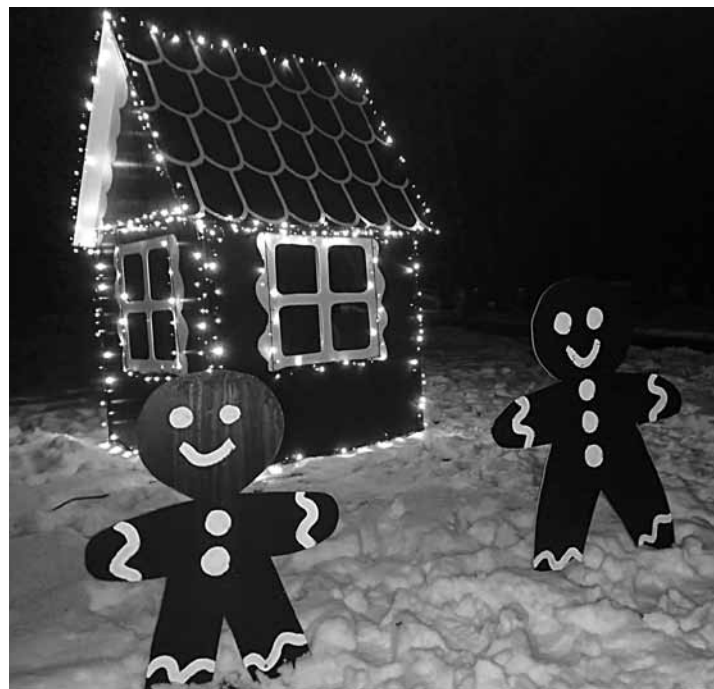
Turlavas pārvaldes darbinieki no koka izgatavojuši vakaros apgaismotu piparkūku namiņu, kas pagasta centru dara jautrāku un gaišāku.

Savukārt Kuldīgas novada garās distances maršrutā Mežataka , kas šķērso šo pagastu, labiekārtotas divas atpūtas vietas: pie Ušņām un Vārpām . Turlava iekļauta arī septiņu jaunu rotaļlaukumu projektā, ko īsteno novada pašvaldība. Mazajiem jāpaciešas līdz pavasarim, kad ieradīsies būvnieki, jo viņiem laika apstākļu dēļ ir tehniskā pauze.