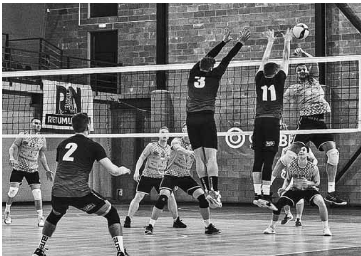
Mirkļis no Kuldīgas un Augšdaugavas volejbolistu spēles.

Volejbola komanda Kuldīga/Kuldīgas novada sporta skola Latvijas čempionātā aizvadīja divas spēles, un abās piedzīvots zaudējums.