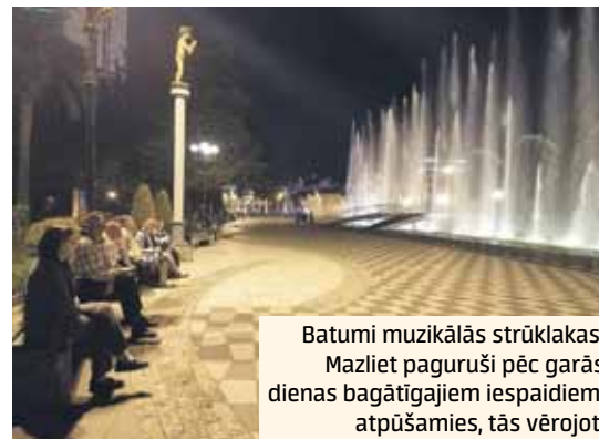
Batumi muzikālās strūklakas. Mazliet paguruši pēc garās dienas bagātīgajiem iespaidiem, atpūšamies, tās vērojot.

Šeit ar niansēm viņa dalās teorētiski, bet pēc koncerta nodemonstrē gavilēšanas dziesmu, kas tiek uzņemta ar ovācijām.