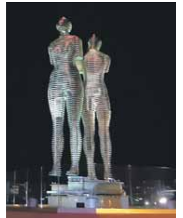
Statujas Ali un Nino. Viens no slavenākajiem mūsdienu Batumi objektiem – 2011. gadā uzceltais mākslas darbs Mīlestība par godu romantiskam stāstam kara apstākļos par azerbaidžāņu jauniešu Ali un skaisto gruzīnieti Nino. Lēni kustoties pa apli, tās viena otrai tuvojas, saplūst un atkal atdalās. Izgaismotas īpaši skaisti izskatās tumsā.

Pandēmijas dēļ šoreiz piedalās tikai divi ārvalstu kolektīvi – mūsu un lietuviešu, pārējie ir vietējie ansambļi. To priekšnesumu klausāmies pirmajā vakarā atklāšanā un secinām, ka ne velti gruzīnu tradicionālā daudz balsība iekļauta UNESCO nemateriālā kultūras mantojuma sarakstā – iespaidīgi, vokāli sarežģīti un reizē līdz asarām aizkustinoši. Festivālu rīko Batumi Mākslas Valsts universitātes Mūzikas fakultāte. Tas dibināts 2005. gadā, un 15 gadu laikā