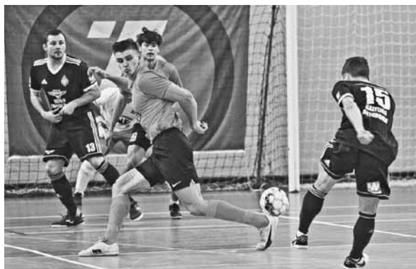
Kuldīgas Nikera un Rīgas Rabas futbolistu spēle.