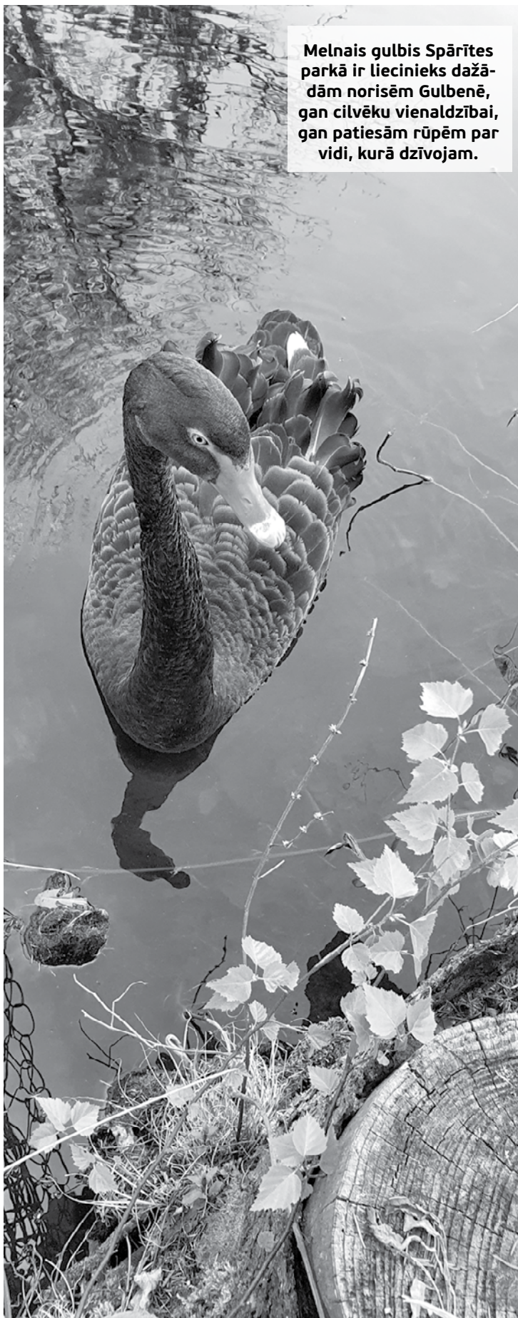
Melnais gulbis Spārītes parkā ir liecinieks dažādām norisēm Gulbenē, gan cilvēku vienaldzībai, gan patiesām rūpēm par vidi, kurā dzīvojam.

saglabājušās 79 koku un krūmu sugas, vairāki dīķi, tiltiņi, taču skulptūras – eņģeļi, putni, fon Volfu simbols vilki, lāči – gājušas bojā. Abu parku platība šodien ir 246 ha, muižas laikā tā sasniedza aptuveni 500 ha. Vietā, kur kādreiz pletās parks, tagad ir Nākotnes ielas dzīvojamo māju masīvs, pļava, BMX trase, veikals.