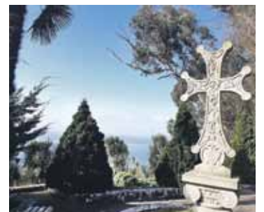
Batumi botāniskajā dārzā. Izbaudām gan fantastiskus skatus uz Melno jūru, gan iespaidīgu augu un koku kolekciju. Vairāk nekā 2000 augu no visas pasaules: eikalipti, palmas, cipreses, bambusi, smaržīgu ziedu bagātība. Dārzs dibināts pagājušā gadsimta sākumā un ir viens no lielākajiem pasaulē (ap 111 ha).